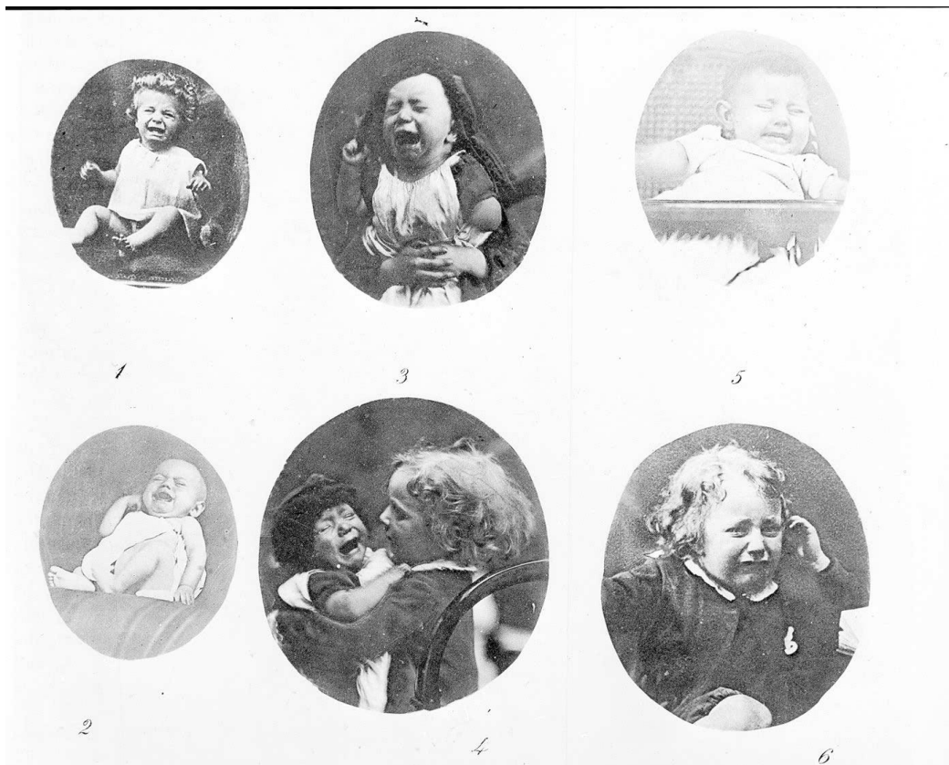
Slika 1: Preuzeto: Charles Darwin, The Expression of the Emotions in Man and Animals , New York: D. Appleton and Company, 1897, str. 146

Baš kao i mladunčad drugih životinja, djeca plaču kada žele hranu, trebaju pomoć ili na bilo koji način pate ili traže olakšanje. 10