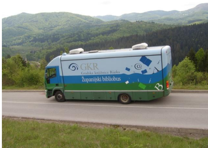
Slika 6 . Županijski bibliobus (Gorski Kotar) 33