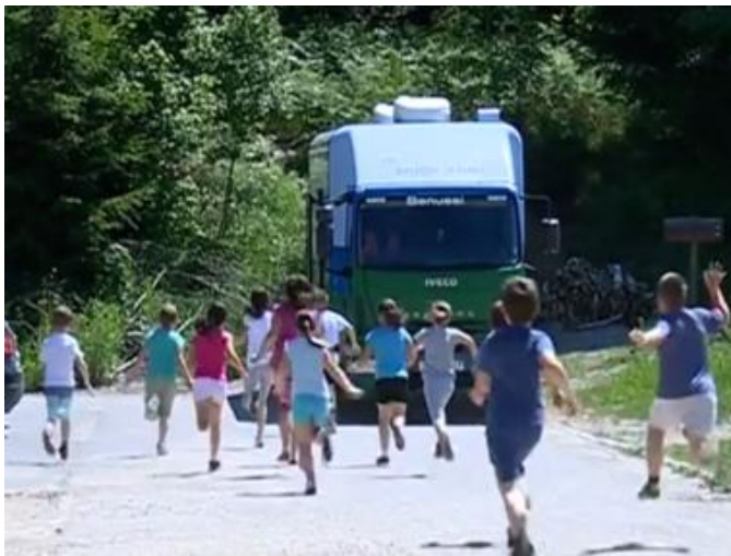
Slika 7. Djeca se vesele bibliobusu 36

Županijski bibliobus, uz moto Knjiga svima! Knjigom do svih! , obuhvaća područje u 12 općina i gradova tj. 33 naselja na 44 stajališta. 35