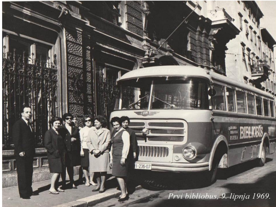
Slika 2. Bibliobus u Rijeci, 1969. 19

knjižnica smještenih u vozilu. 17 Zanimljivo je što se u riječkoj knjižnici, o potrebi uvođenja bibliobusne službe, govorilo godinu ranije, 1963., ali je zbog nedostatnih sredstava ista počela s radom tek šest godina kasnije. Godine 1969. svečano je promoviran bibliobus Gradske knjižnice Rijeka. Zapravo se radilo o autobusu preuređenom za pružanje knjižničnih usluga kao "prva pokretna knjižnica takve vrste u Hrvatskoj i Jugoslaviji..." 18