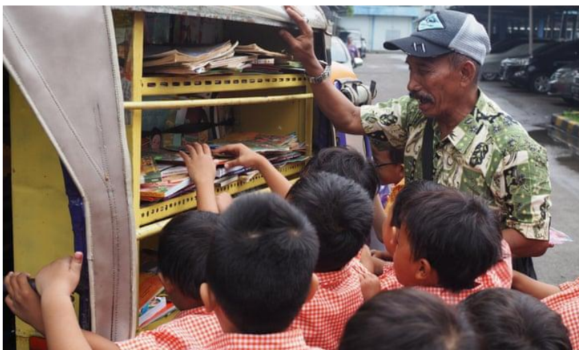
Slika 14. Pokretna knjižnica u Indoneziji 53