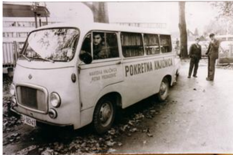
37 Slika 8 . Prvi bibliokombi (Bjelovar, 1972.)

Također, usluge i programi koji je promovirala ova pokretna knjižnica približavali su kulturne sadržaje radnicima tj. stanovništvu u ruralnim krajevima.