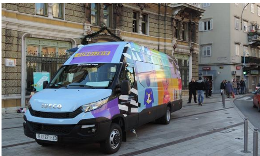
Slika 5. Gradski bibliobus u Rijeci. 31

S obzirom na potrebu pružanja knjižnične usluge u svim mjestima županije koja nemaju druge oblike djelatnosti narodne knjižnice, Gradska knjižnica Rijeka osmislila je projekt bibliobusne službe Primorsko-goranske županije za područje Gorskog kotara i drugih brdsko - planinskih dijelova tog prostora. Partnerski projekt Gradske knjižnice Rijeka i Primorsko-goranske županije prepoznalo je i Ministarstvo kulture, koje je 2004. godine sufinanciralo nabavu novog Županijskog bibliobusa. 32 Osnovne značajke navedenog bibliobusa su sljedeće: