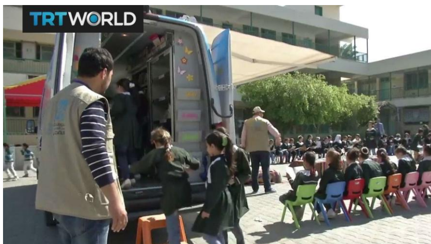
Slika 15. Pokretna knjižnica u Gazi

Rat između Izraela i Gaze uništio je ili oštetiio stotine škola u 2014. Mnogi od tih škola tek se trebaju obnoviti. Dječji centar u Gazi pokrenuo je vrijednu kampanju za poticanje navika čitanja među djecom. Prva pokretna knjižnica Gaze opskrbljena knjigama o najrazličitijim temama obilazi škole u raznim četvrtima kako bi udovoljila želji tamošnje djece za čitanjem. Cilj ovih