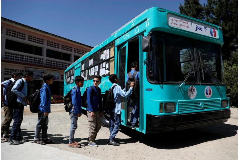
Slika 11. Pokretna knjižnica u Afganistanu