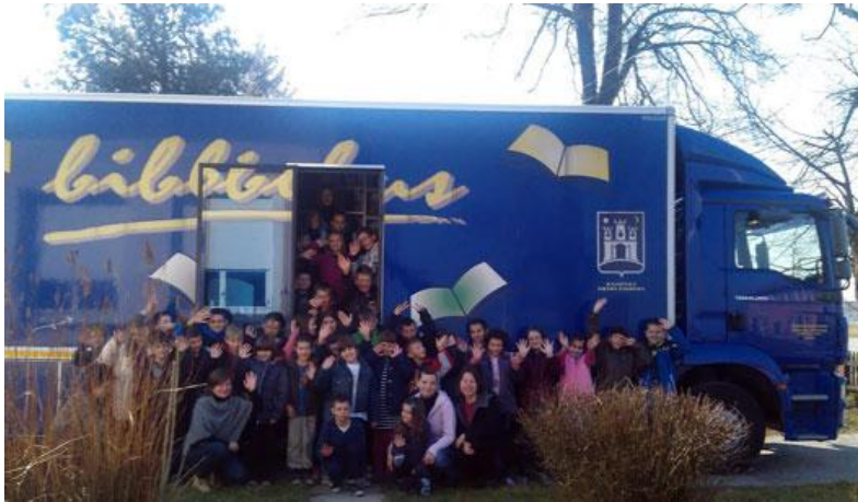
Slika 4. Zagrebački bibliobus. 30

„Nabavom županijskog bibliobusa omogućilo bi se povećanje broja stajališta u gradovima i općinama Zagrebačke županije, čime bi se stanovništvu osiguralo temeljno pravo na knjigu i informacije, kao i pristup suvremenoj informacijskoj tehnologiji, u cilju poticanja kreativnosti i čitalačkih navika kod djece i mladeži te cjeloživotnog učenja svih dobnih skupina. Unapređenjem i proširenjem mreže bibliobusnih stajališta izravno bi se doprinijelo i ciljevima Strategije razvoja Urbane aglomeracije Zagreb, s obzirom na to da Zagrebačka županija sa 61 % površine i 256689 stanovnika ulazi u Urbanu aglomeraciju Zagreb.“ 29