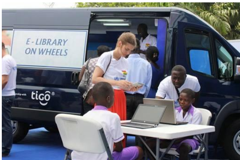
Slika 13. Pokretna knjižnica u Gani. 51