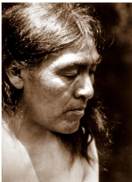
Slika 2. Ishi