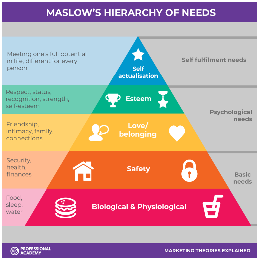
Slika 1. Maslowova piramida hijerarhije potreba

„Uspješan tradicionalni marketing cilja na osnovne porebe ciljne publike, u skladu s Maslowljevom hijerarhijom potreba, fizičkim potrebama, racionalnim potrebama, emocionalnih i duhovnim potrebama. Prodavači pronalaze način da ugrade svoje robne marke u svijet potrošača, kao i da naporno rade na razvijanju svojih emocija kroz marku koju pokušavaju prodati. Da bi se to postiglo, potrebno je razviti izvrstan imidž marke s percepcijom koja cilja na racionalne i emocionalne potrebe potrošača.“ (Basant Eyada, 32.-33., 2020., prijevod: Lea Broz )