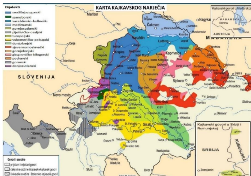
Karta 3. Karta kajkavskoga narječja 5 (Lončarić 1996: 199)

Govori ludbreškopodravskih naselja u dijalektološkoj su literaturi još uvijek nedovoljno zastupljeni. Prema geografskome prostiranju i prema svojim značajkama oni pripadaju kajkavskome narječju. Stjepan Ivšić (1996: 58–69) na karti kajkavskoga narječja, priloženoj djelu Jezik Hrvata kajkavaca , tu regiju, prema akcenatskim kriterijima, uvrštava u konzervativnu, odnosno zagorsko-međimursku grupu kajkavskih govora koja čuva stariju akcentuaciju, a naročito mjesto starijih naglasaka na unutrašnjim slogovima ( posĕkli ) te razvijeni metatonijski cirkumfleks ( \overset{\sim} ) ( posĕkel ). Konzervativnu je grupu govora nadalje podijelio na osam skupina gdje, temeljem nepostojanja oksitoneze 3 te čuvanja akuta u nefinalnim slogovima, govore ludbreške Podravine uvrštava u naglasni tip I 5 4 (Ivšić 1996: 58–73). U okviru te podjele Mijo Lončarić, na svojoj karti kajkavštine, ludbreške govore poblize svrstava u varaždinsko-ludbreški dijalekt. Kao osnovne značajke tih govora ističe: čuvanje osnovne kajkavske akcentuacije, izjednačavanje stražnjega nazala * ɔ i slogotvornoga * ɨ s refleksom etimološkog o te nenaglašeni vokalizam s četiri jedinice (Lončarić 2005: 111–112).