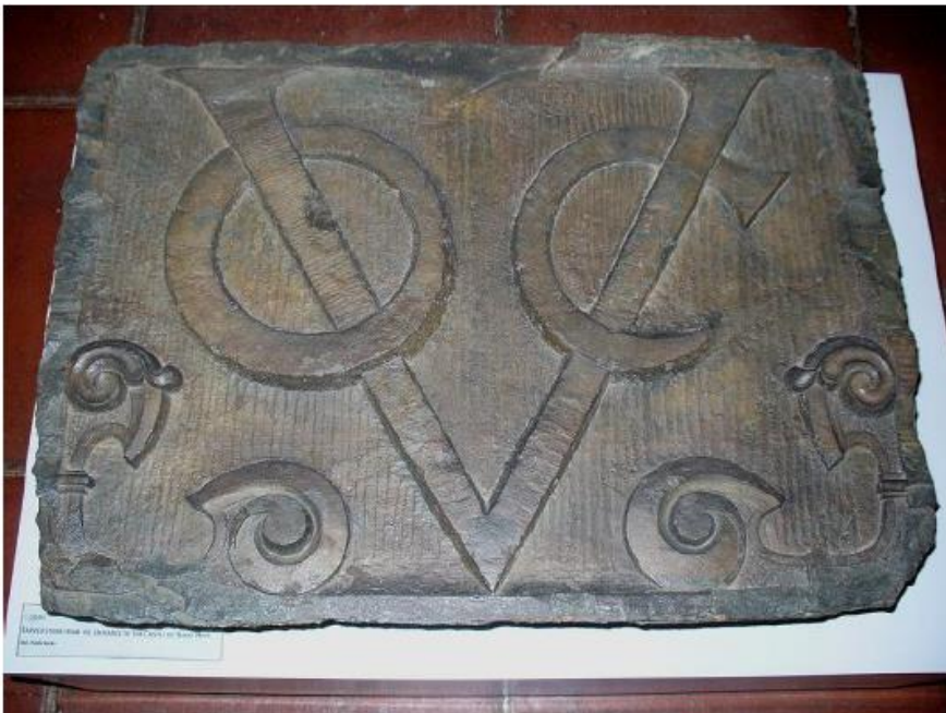
Slika 5- Monogram VOC