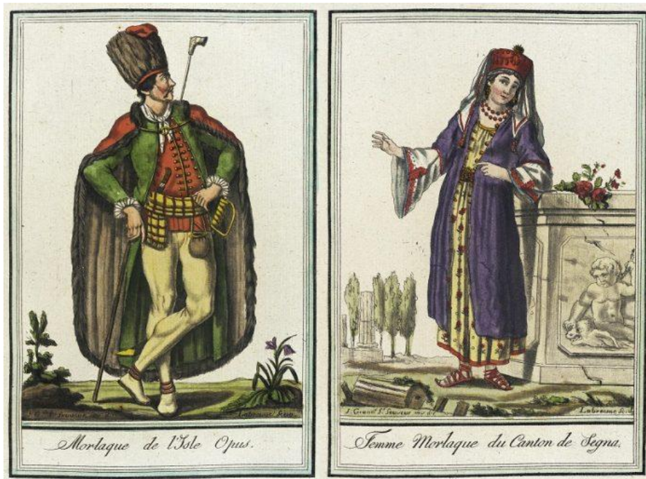
Prilog 2: Primjer nošnje Morlaka i Morlakinje ( https://povijest.hr/drustvo/narodi/tko-su-bili-morlaci-u-sluzbi-mletacke-vojske/ )

Talijanima koji su ju ismijavali. Također se spominje da se odjeća Morlaka razlikuje od mjesta do mjesta. 72