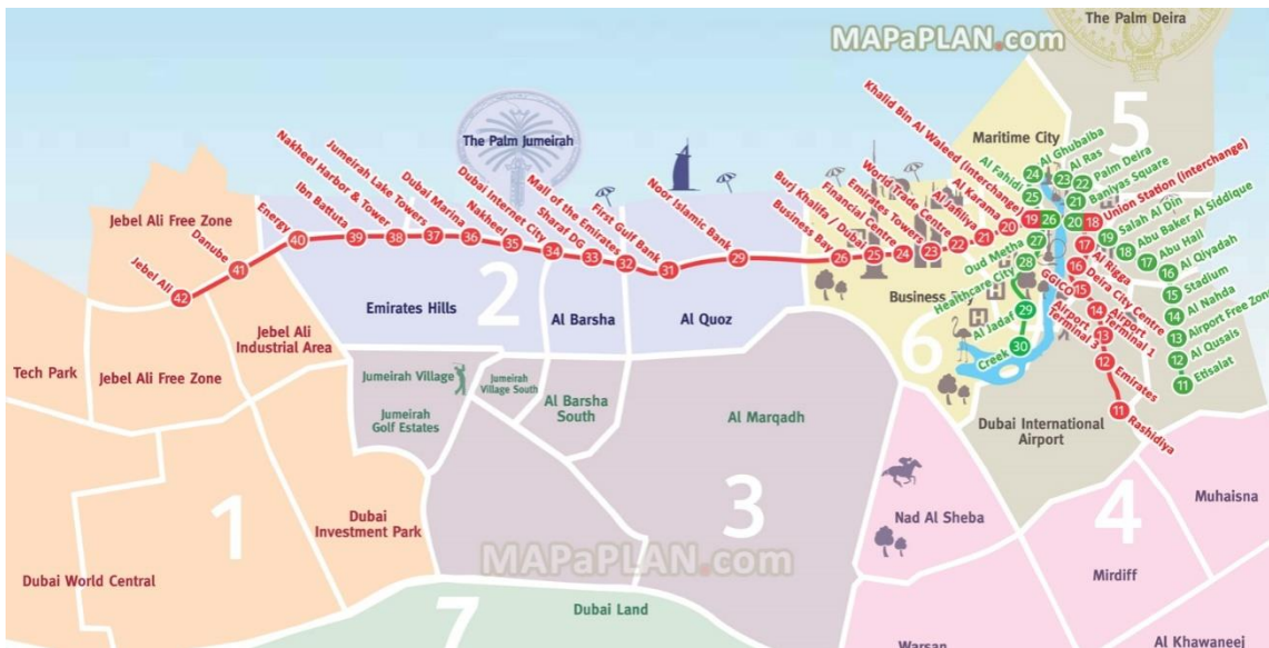
SLIKA 2 Plan vožnje metroa

Prilikom izgradnje važnu ulogu imala je klima. Naime, Dubai se nalazi na pustinjskom području gdje temperatura ljeti prelazi 40°, ponekad 50°C stupnjeva, dok se zimi kreće oko ugodnih 25 °C. Kako bi osigurali dolazak posjetitelja i u vrijeme vrućih ljetnih mjeseci većina turističkih atrakcija smještena je u zatvorenom prostoru, u strogo kontroliranim uvjetima s