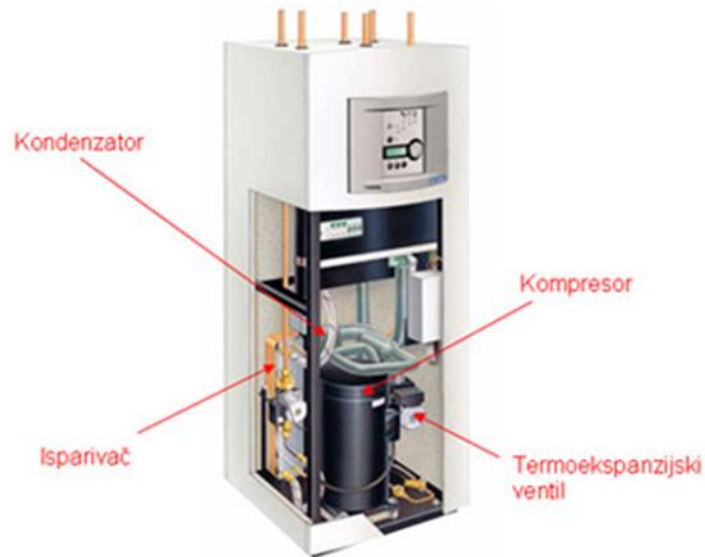
Slika 2. Osnovni dijelovi dizalice topline