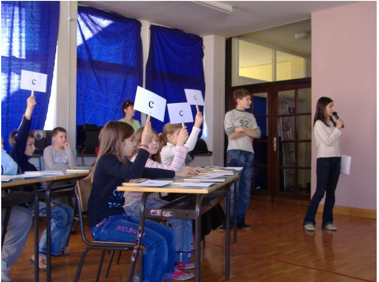
Prilog 2. Primjer kviza Šegrt Hlapić održanog u POŠ Ogulin