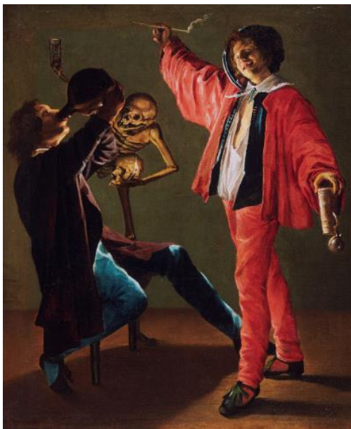
Slika 13. Judith Leyster, Posljednja kap , 1639., 89 x 73.7 cm, Philadelphia Museum of Art, Philadelphia

Zaključuje se kako Judith Leyster slijedi norme u načinu življenja i uvažavanjem slikarske tradicije, primjerice u vidu slikanja genre scena. Emancipacija bi se u njezinom slučaju mogla objasniti novinama koje uvodi na slike. Želi dokazati da je sposobna kao i njezini muški kolege, što joj uspijeva te izgrađuje uspješnu karijeru koja rezultira emancipacijom nje kao umjetnice i žene u društvu 17. stoljeća.