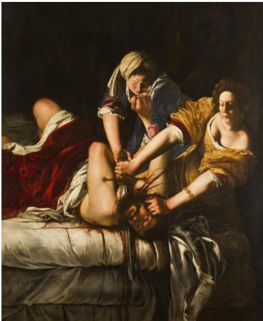
Artemisia Gentileschi, Judita ubija Holoferna , 1620., 146 x 108 cm, Galerija Uffizi, Firenca

Jedna od umjetnica kod koje se želja za emancipacijom snažno iščitava na djelima jest Artemisia Gentileschi (1593. – 1652.). Na teatralan i često nasilan način prikazuje motive i osobe na slikama što je vidljivo i na djelu Judita ubija Holoferna (vidi Slika 9 ). Scenu povezuje s vlastitim životom prikazujući ženu, odnosno Juditu koja je nadvladala nasilnika Holoferna.