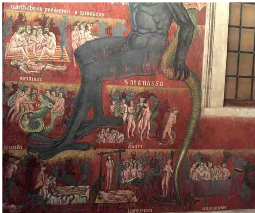
Antoniazzo Romano, Vizija pakla Franciske Rimske (detalj), 1468., freska, samostan Tor de' Specchi, Rim