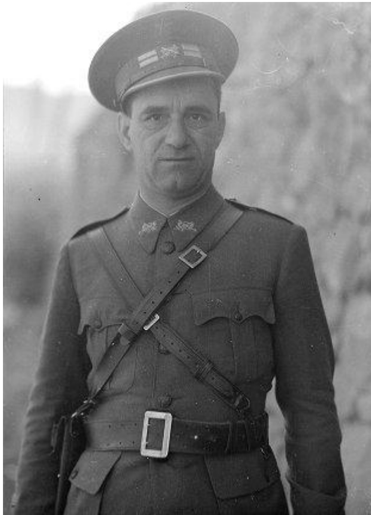
Vladimir Čopić u Španjolskom građanskom ratu 1937. Godine