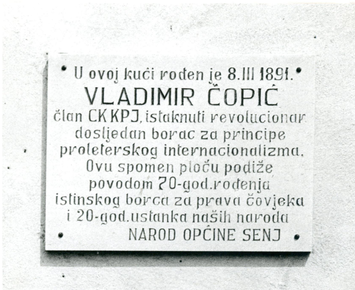
Izgled spomen ploče na Čopićevoj rodnoj kući u Senju