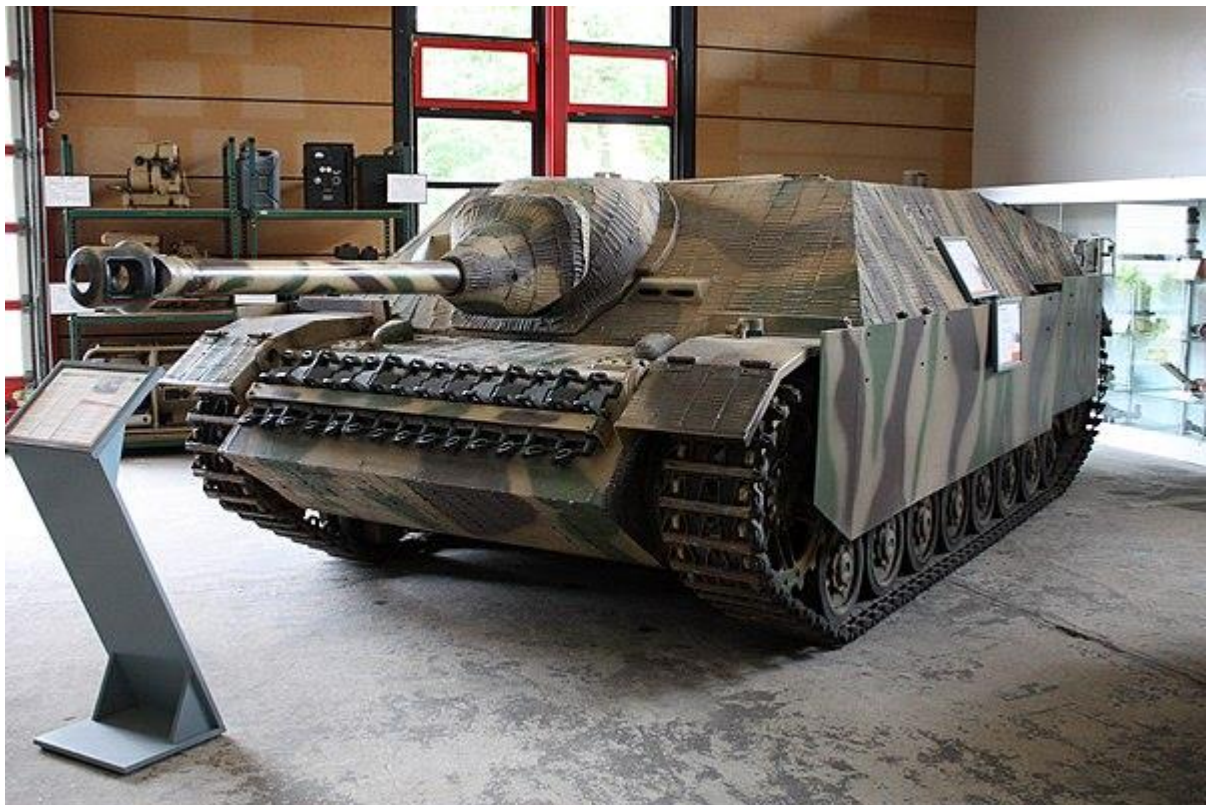
Slika 18.: Jurišni top na bazi Panzera IV-Jagdpanzer naoružan topom od 75 mm. Mogao se koristiti kao jurišni top ili lovac na tenkove, ovisno o situaciji. Gotovo svi primjerci korišteni su na istočnom bojištu od 1944. do 1945. godine kao lovci na tenkove u defenzivnim operacijama. 64

formacijama. Jagdpanzer IV izgledom je nalikovao povećanom Hetzeru (lovac na tenkove na bazi Panzera 38 (t)) s pojačanim naoružanjem. Dugi top od 75 mm imao je dobre protutenkovske karakteristike, a za obranu od pješastva u oklopljenu strukturu montirane su dvije strojnice MG-34. Čeoni nakošeni oklop debljine 60 mm mogao je zaustaviti protutenkovske projekte na srednjim i dalekim udaljenostima, no zbog nedostatka kupole vozilo nije bilo predviđeno za blisku borbu. Druga varijanta Jagdpanzera IV pokušala je u vozilo montirati jači i duži protutenkovski top od 75 mm, no to nije bilo moguće bez povećavanja visine vozila. Ipak je 1944. pokrenuta proizvodnja s obzirom na to da je druga varijanta bila jeftinija, a njemačkoj je vojsci u to vrijeme nedostajalo oklopnih vozila. Ukupno je proizvedeno približno 1050 primjeraka tog vozila što je veoma malo ako se usporedi proizvodnja glavnih modela njemačkih Panzera i ostalih oklopnih vozila. 63