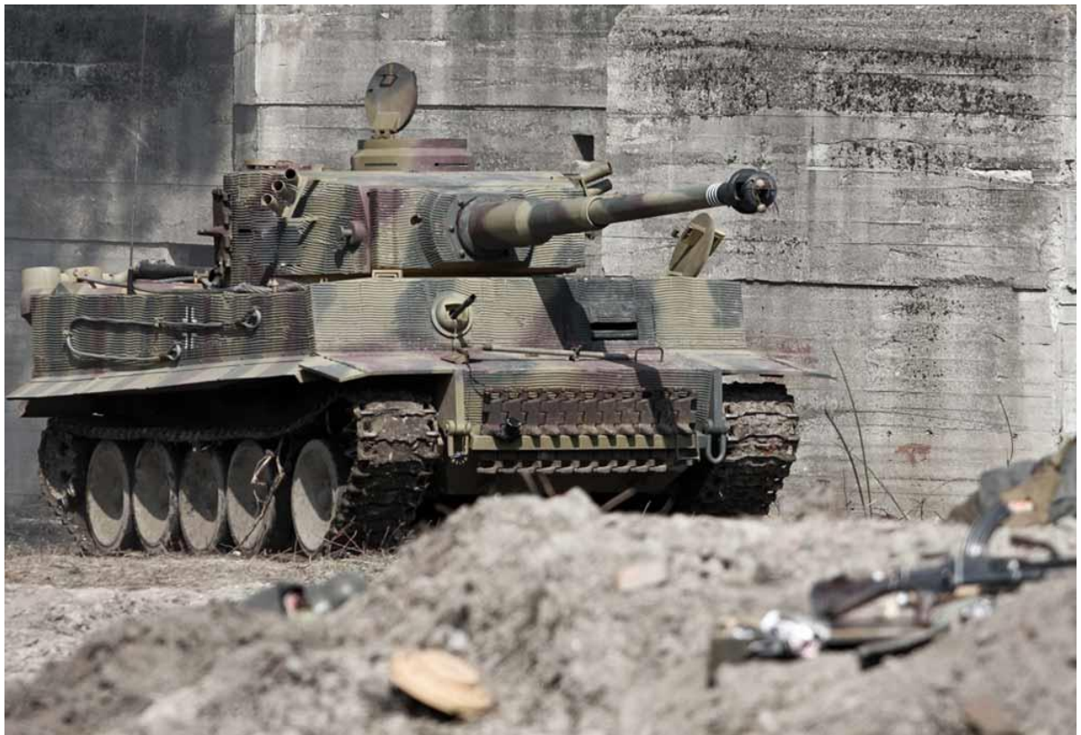
Slika 24.: Njemački teški tenk Tiger bio je dizajniran kao ofenzivni probojni tenk, no tijekom borbi na istočnom frontu češće je bio u defenzivi. Od približno 1500 Tigera većina ih je sudjelovala u obrambenim borbama na istočnom bojištu od 1943. do 1945. godine. Jedan manji broj Tigera prebačen je na zapadno bojište 1944. godine. 84

kopiran je od sovjetskih tenkova zbog lakše zamjene prilikom oštećenja. Problem se nalazio u pogonu i upravljanu tenka jer jedan motor nije bio dovoljan za pokretanje tako teškog tenka pa je Porsche ugradio dva motora, svaki za pogon jedne gusjenice. Sustav mijenjanja brzina koristio je mnogo žica i bakra što je bilo izuzetno skupo za proizvodnju i stvaralo je dodatne probleme. Preopterećenje sustava uzrokovalo bi česte kvarove i požare koji bi onеспособili ili uništili tenk. Motor je bio smješten u zadnjem dijelu tenka odozgo zaštićen mrežastim poklopcima radi hlađenja što je bila ahilova peta tenka jer ga je mogla zaustaviti jedna boca Molotovljeva koktela. Da je Porsche bio manje optimističan, sigurno bi na vrijeme prekinuo s razvojem tenka, no suprotno tome on je pokrenuo proizvodnju vjerujući u pobjedu nad konkurencijom. Tako je do kraja 1942. proizveo gotovo 100 šasija Tigera P, pritom trošeći vrijedne resurse koje njemačka nije imala samo da bi kasnije te šasije stajale u skladištima. Kasnije će te šasije imati svoju svrhu u jednoj, gotovo nepraktičnoj prenamjeni. 83