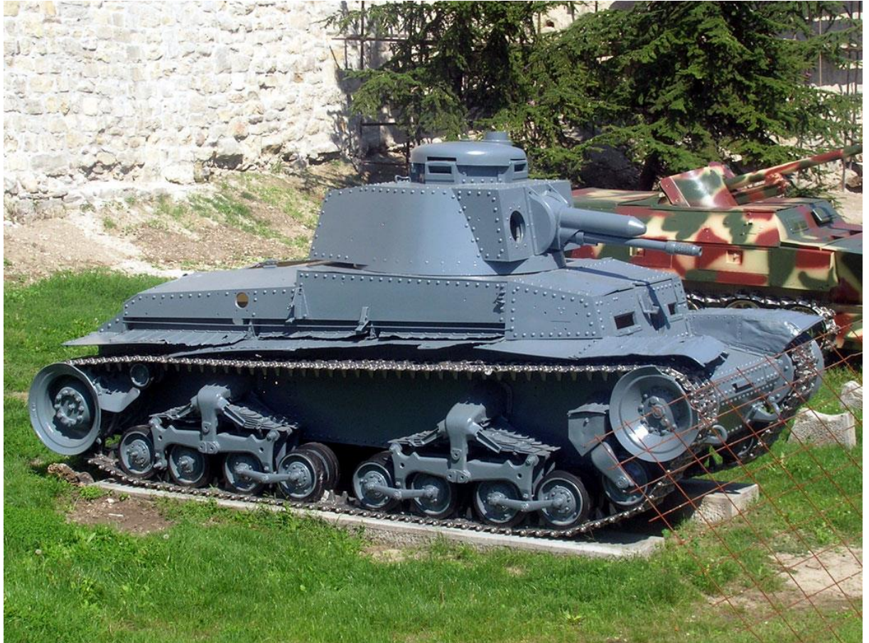
Slika 6.: Laki tenk model 35, odnosno Panzer 38 (t) korišten je u borbama u Poljskoj, Beneluxu, Francuskoj, Jugoslaviji i Sovjetskom Savezu. Naoružan topom mogao je uništavati sabije oklopljene protivničke tenkove te pružiti zaštitu drugim njemačkim tenkovima. Do studenoga 1941. godine taj je tenk povučen iz borbene upotrebe zbog zaostalosti. 19

Lehky tank vzor 35 (laki tenk model 35) dizajniran je u Čehoslovačkoj ranih 1930-ih, a njegova je glavna proizvodnja započela 1935. godine. Sa samo 135 primjeraka proizvedenih do 1938. godine ne može se količinski usporediti sa stotinama njemačkih Panzera I i II, no njegovi brzina, oklop i naoružanje superiorniji su prema njemačkim tenkovima proizvedenima do 1938. godine. Top marke Škoda od 37,2 mm kojim je tenk bio naoružan mogao je pouzdano probiti bilo koji tadašnji njemački tenk, a brzina od 40 km/h tom je tenku omogućila mobilnost ravnu njemačkim tenkovima. Osim topom tenk je bio naoružan i strojnicom za potporu i odbijanje napada pješništva. Njegova težina od 11,6 tona bila je malo veća od većine njemačkih tenkova, ali unatoč tome i posadi od četiri člana (njemački tenkovi imali su posadu od dva ili tri člana osim Panzera III i IV) taj je tenk bio bolje dizajniran. Treba napomenuti da oklop tenka (35 mm sprijeda do 12 mm straga) nije bio zavarivan kao u Panzera, nego pričvršćen zakovicama. Formacija sastavljena od tih tenkova u otvorenom okršaju uništila bi bilo kakvu formaciju sastavljenu od Panzera I i II jer potonji nisu bili