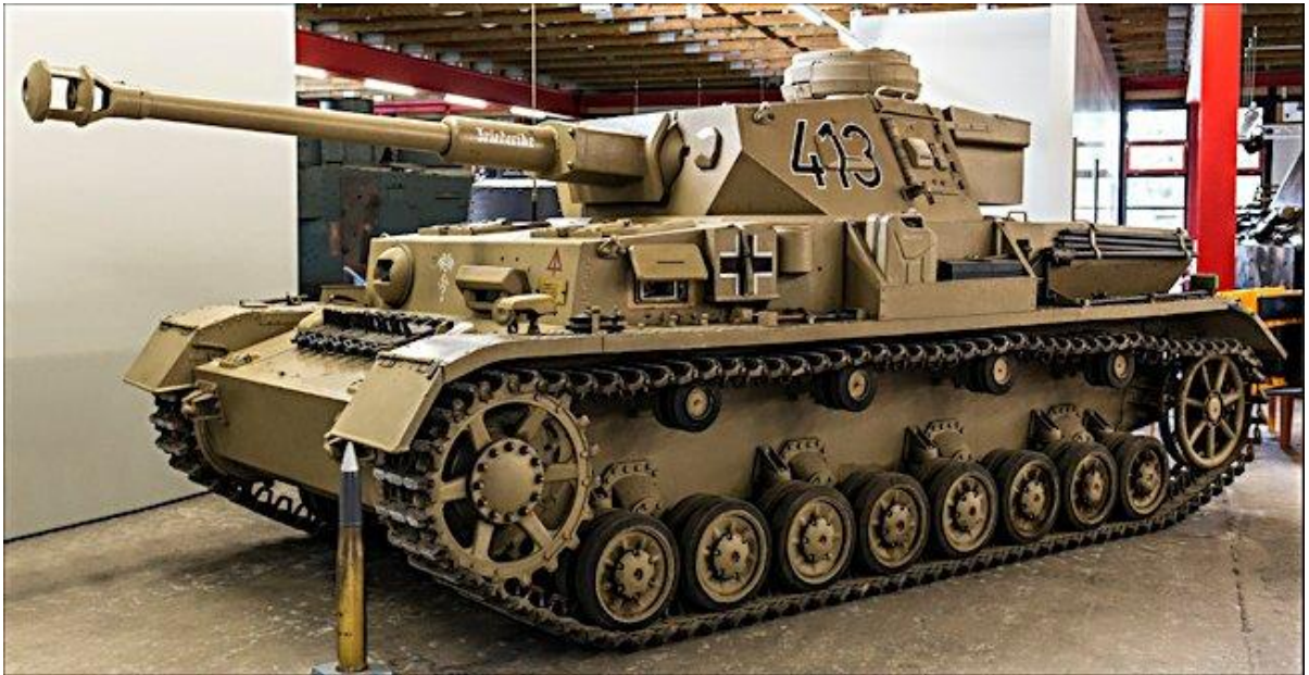
Slika 17.: Panzer IV proizveden sredinom Drugoga svjetskog rata. Ta varijanta naoružana je dugim topom od 75 mm za borbu protiv neprijateljskih tenkova. Prvotne varijante koje su imale ulogu potpore pješastvu tijekom rata nadograđivane su. Taj je tenk sudjelovao u borbama na svim europskim bojištima od 1939. do 1945. godine. Manji je broj tenkova sudjelovao u borbama u sjevernoj Africi. 60

Panzer III ne može nositi jači top od 50 mm, započela je proizvodnja Panzera IV s naoružanim dugim protutenkovskim topom od 75 mm, pretvorivši tenk za potporu pješastva u tenk za borbu protiv ostalih tenkova. Međutim, tenk nije posve izgubio ulogu potpore pješastvu jer su eksplozivni projektili koje je top ispaljivao bili sasvim dovoljni za uništavanje određenih obrambenih pozicija. Oklopno probijajući projektili nisu imali poteškoće pri probijanju sovjetskih i savezničkih tenkova, ali su isto tako bili ranjivi u borbi protiv istih tenkova. 59