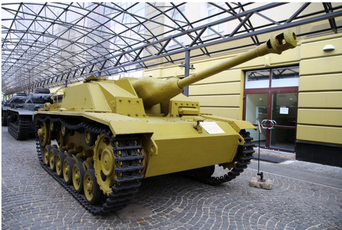
Slika 15.: Jurišni top na bazi Panzera III od 1940. godine do kraja rata sudjelovao je u borbama na svim bojištima, s manjim brojem vozila koja su poslana na bojište sjeverne Afrike. Mogao je pružati vatrenu potporu pješastvu i služiti kao lovac na tenkove. 54

Kako bi pješastvo dobilo vozilo za blisku vatrenu podršku i nešto za urbanu borbu Panzer III modificiran je u još jednu vrstu borbenog vozila. Umjesto protutenkovskog topa vozilo je bilo naoružano dugom lakom haubicom od 105 mm za protupješačko i protutenkovsko djelovanje. To vozilo, nazvano Sturmhaubitze ili Stuh III više je djelovalo kao topništvo nego kao tenk. Haubica je ispaljivala kumulativne projekte, pogubne za neprijateljske tenkove te obične eksplozivne projekte za borbu protiv pješastva. Iako je vozilo nosilo naziv jurišna haubica, ono je bolje djelovalo u defenzivnoj nego ofenzivnoj ulozi prilikom borbe protiv tenkova i ponekad protiv pješastva. Oklop od 50 mm nije mogao zaustaviti protutenkovske projekte proizvedene sredinom Drugoga svjetskog rata, stoga nije bilo poželjno poslati vozilo u izravan sukob. 55