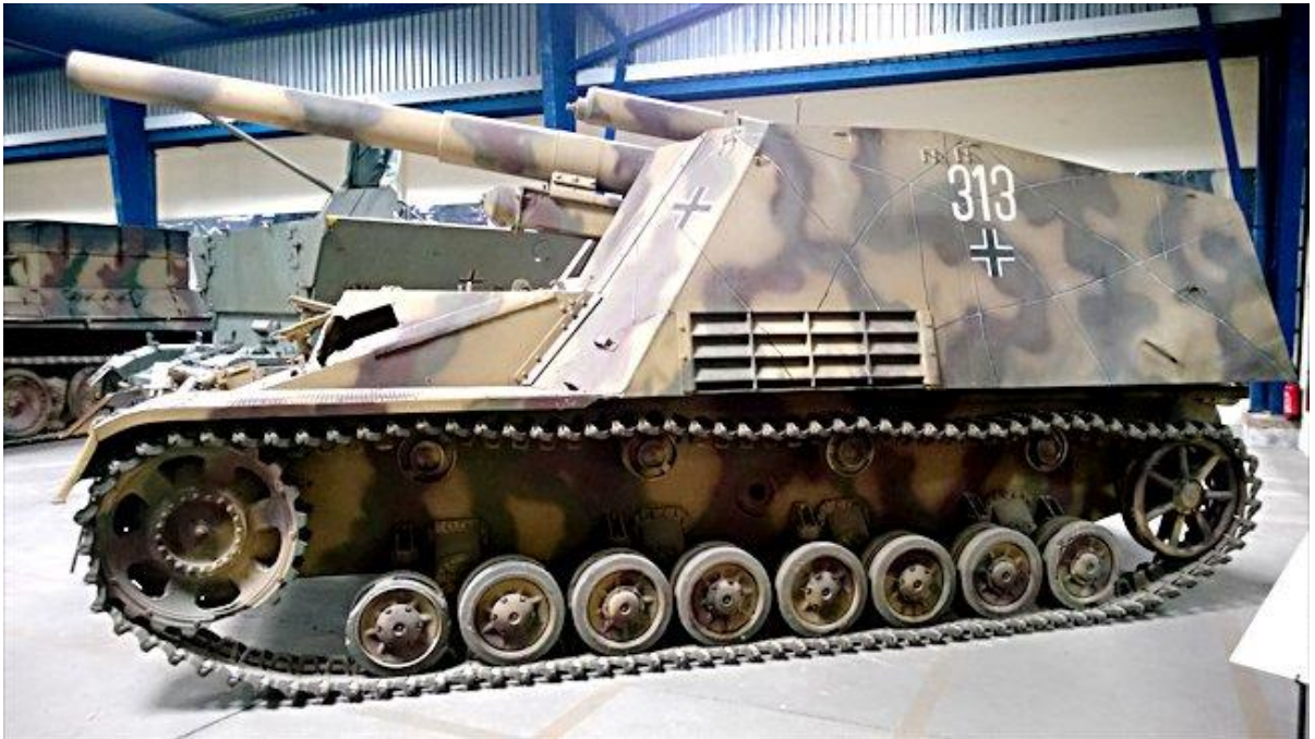
Slika 20.: Samohodna haubica Hummel imala je ulogu pružanja indirektno vatrene potpore pješastvu i oklopnim formacijama. Korištena je u toj ulozi od 1943. do 1945. godine prilikom ofenzivnih i defenzivnih borbi na istočnom bojištu. Manji broj vozila sudjelovao je od 1944. do 1945. godine na zapadnom bojištu. 68

rukovođenja protutenkovskim topom. Maksimalan domet toga samohodnog topa iznosio je 13 km, što je vozilu omogućavalo da djeluje iz pozadine. Proizveden u približno 670 primjeraka Hummel se pokazao dostojnim svoje uloge, no nedostatak je bio manjak streljiva jer je u borbu mogao ponijeti samo 18 projektila. 67