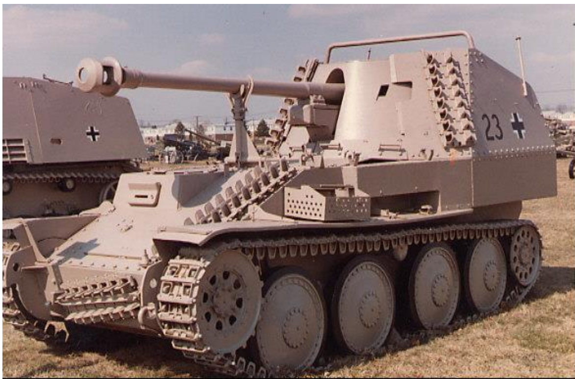
Slika 10.: Jedna od varijanti lovca na tenkove Marder III naoružana njemačkim topom od 75 mm, ali s promijenjenim smještajem posade. Taj lovac na tenkove sudjelovao je u borbama na svim važnijim europskim bojišnicama Drugoga svjetskog rata od 1943. do 1945. godine. 30

Jedan od najbrojnijih i možda najuspješnijih lovaca na tenkove bio je Jagdpanzer 38 (t) poznatiji pod imenom Hetzer . Po uklanjanju kupole i modificiranjem šasije na istu je montirana potpuno oklopljena struktura za zaštitu posade i vozilo je naoružano protutenkovskim topom od 75 mm. To vozilo moglo je svojim topom uništiti sve osim najteže oklopljenih savezničkih tenkova na udaljenosti od 800 metara. Na krovu vozila postavljena je strojica za borbu protiv pješastva, no pri upravljanju strojnicom vojnik je bio izložen neprijateljskoj vatri. Kako bi se otklonila opasnost za vojnika, strojnicom se moglo upravljati iz unutrašnjosti vozila. Sama debljina oklopa nije bila velika, no njegova kosina od 75 stupnjeva predstavljala je debljinu od 90 mm što je impresivno poboljšanje za vozilo koje je prethodno posjedovalo 35 mm oklopa na čeonj strani. Vozilo je prerađeno s isključivo protutenkovskom ulogom i njegova visina, jedva preko 2 m te širina od 2,6 m omogućila je napade iz zasjede. U slučaju da neprijatelj otkrije vozilo, ono se moglo udaljiti brzinom od 42 km/h ako su uvjeti to dopuštali. U relativno kratkom razdoblju od 1944. do 1945. godine