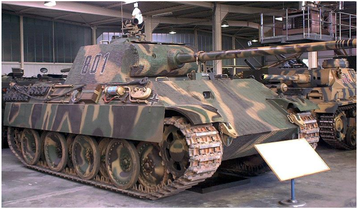
Slika 22.: Panther, možda najbolji njemački tenk Drugoga svjetskog rata. Dizajniran kao tenk za borbu protiv drugih tenkova s taktičkom ulogom probijanja neprijateljske crte obrane zbog preokreta na istočnom bojištu nakon 1943. godine; često je morao djelovati defenzivno. Panther je sudjelovao u ofenzivnim i defenzivnim borbama na svim europskim bojištima Drugoga svjetskog rata od 1944. do 1945. godine. 75