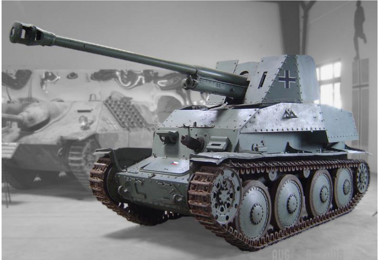
Slika 8.: Lovac na tenkove Marder III. 27 Taj lovac na tenkove bio je naoružan zarobljenim sovjetskim topom od 76 mm te je djelovao na istočnom bojištu. Proizvodnja je trajala do razvitka bolje dizajniranih lovaca na tenkove. 28