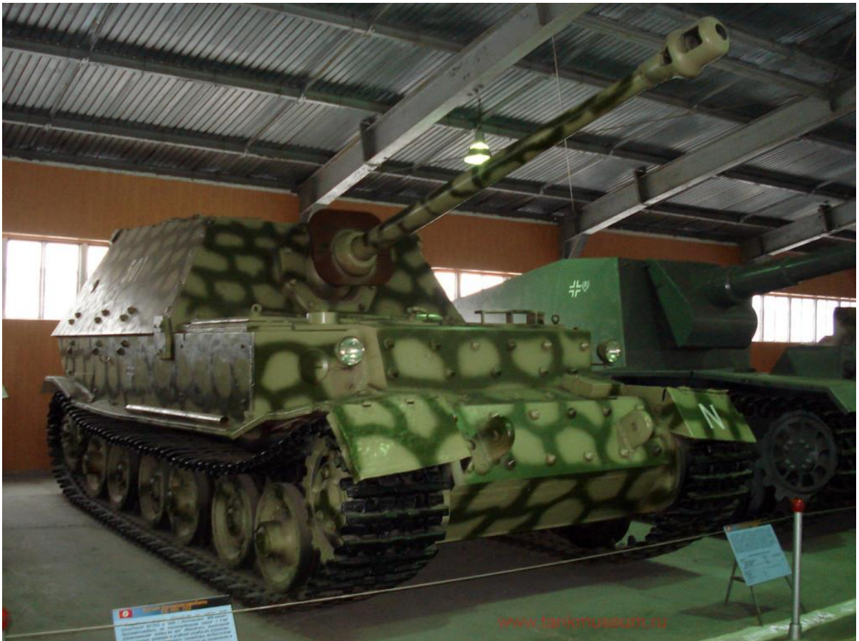
Slika 25.: Lovac na tenkove proizveden na šasiji Porscheova Tigera Ferdinand. 91 Svi primjerci sudjelovali su u ofenzivnoj operaciji kod Kurska 1943. godine. Nakon Kurska preostala vozila modernizirana su i upućena u defenzivne borbe u Italiji. 92

riješeni. Sada pod nazivom Elefant vozila su nastavila službu u oklopnim formacijama, ali užasne performanse osigurale su završetak proizvodnje i prenamijene Porscheova Tigera. 90