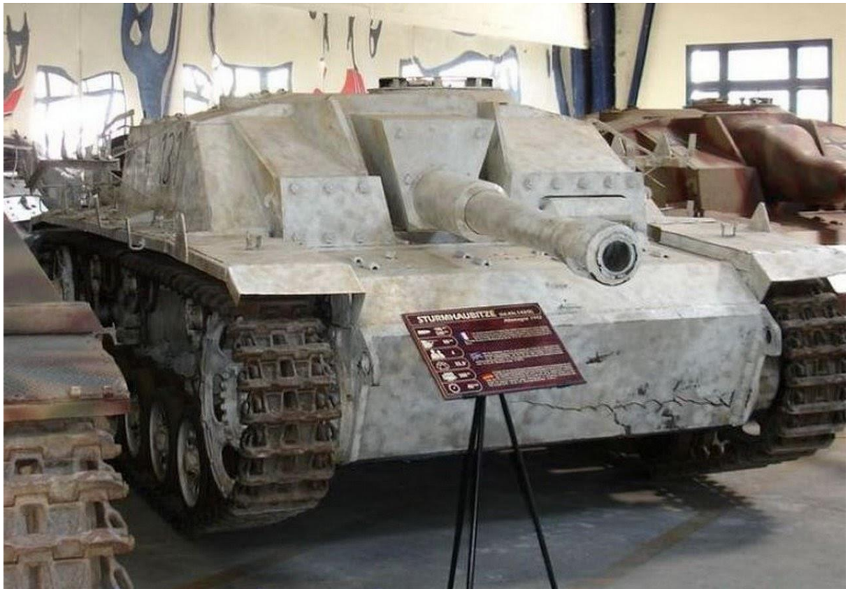
Slika 16.: Jurišna haubica Stuh 42 imala je ulogu pružanja bliske vatrene potpore pješastvu, pogotovo u urbanim borbama na istočnom bojištu. Proizvodnja je trajala od listopada 1942. do kraja rata 1945. godine. 56

Budući da je proizvodnja svih varijanti Panzera III trajala do sredine Drugoga svjetskog rata i da su njegove inačice rađene sve do kraja rata, može se zaključiti da je Panzer III bio jako dobro dizajniran tenk svojeg doba. Iako je razvoj bio odužen, konačni proizvod bio je gotovo izvrstan. U prilog tome govori činjenica da je tenk konstantno nadograđivan i moderniziran bez prevelikog truda za razliku od ranije proizvedenih tenkova i nekih savezničkih tenkova koji nisu mogli primijeniti jednostavne nadogradnje i modifikacije. Unatoč odličnim značajkama Panzera III njemačka vojska radila je na razvoju dugog, vrlo sličnog tenka koji će nositi naziv Panzer IV.