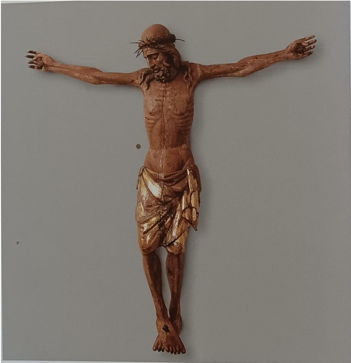
Slika 10. Fragment raspela sa ograde svetišta zadarske katedrale. (PETRICIOLI, 2004, str. 76)