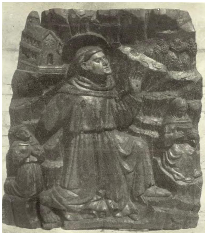
Slika 6. Fragment poliptiha Petra de Riboldisa. Stigmatizacija. (FISKOVIĆ, PETRICIOLI, 1956, str. 160)