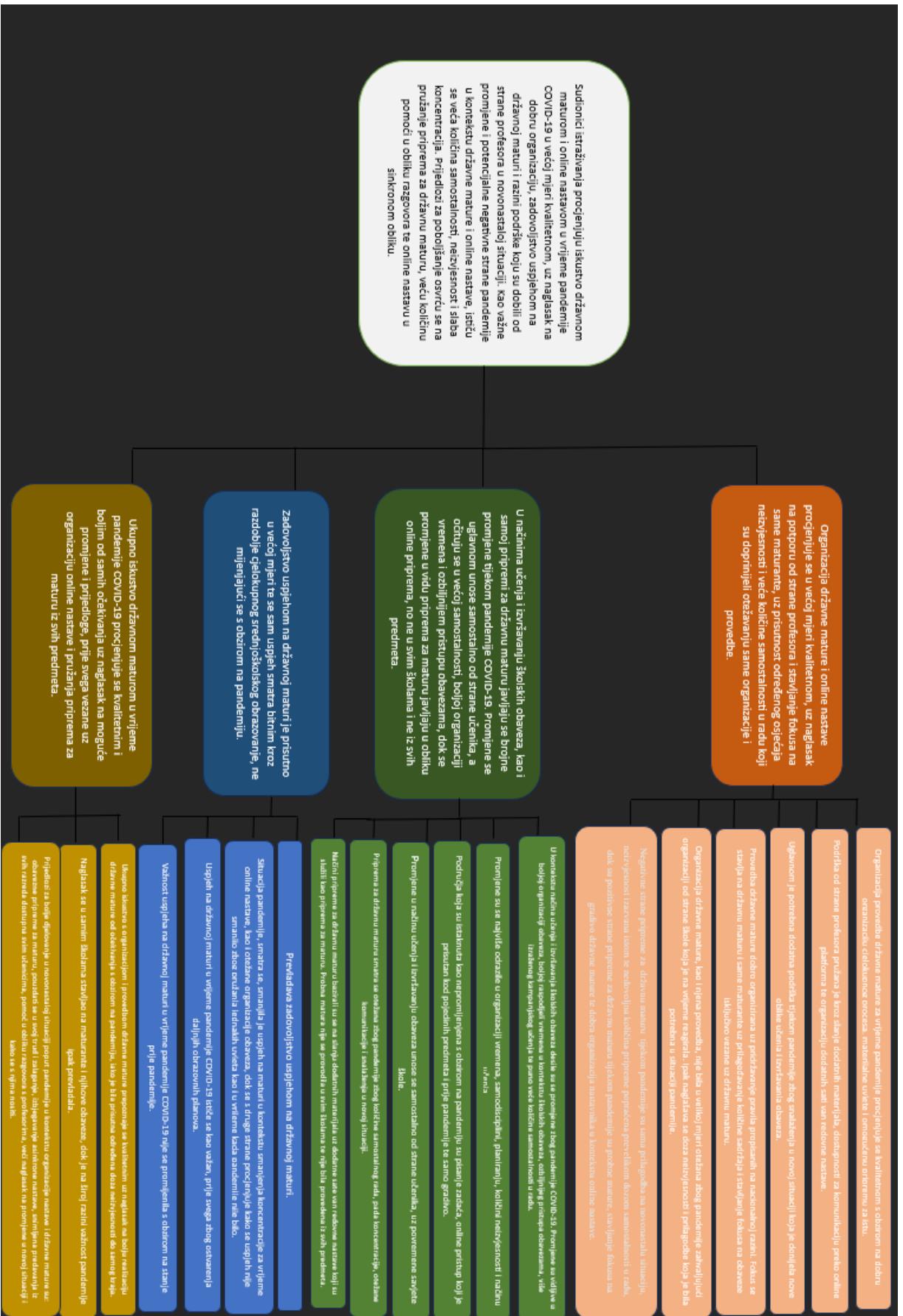
Slika 2. Trostrazinska mreža istraživanja