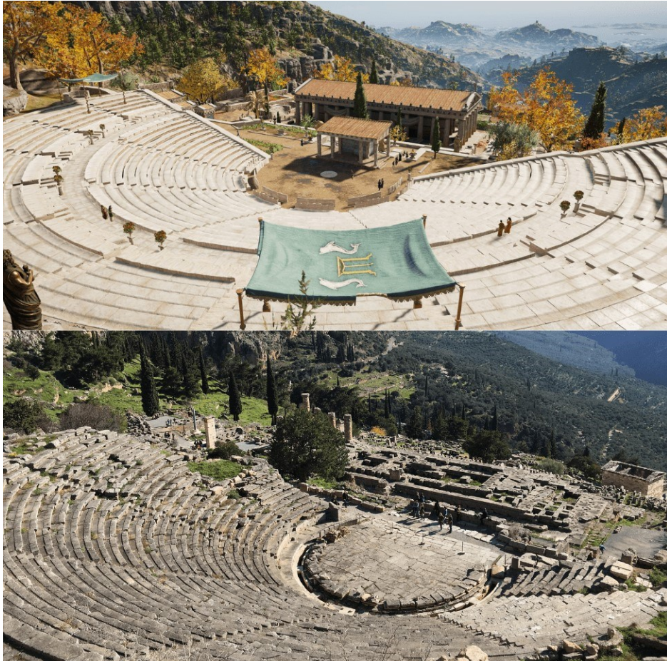
Slika 4 Prikaz kazališta u Delfima i Apolonova hrama ispod kazališta (donja slika) te rekonstrukcija u videoigri Assassin's Creed Odyssey (gornja slika).

Duttonova disjunktivna teorija umjetnosti naglašava važnost institucija i tradicije u definiranju umjetnosti. Videoigre su ostvarile prihvaćanje u akademskim zajednicama kroz nagrade koje se dodjeljuju u više kategorija, a već godinama se videoigre uključuju u muzejske i galerijske postavbe što im pridaje legitimitet kao oblik umjetnosti. Primjerice, MoMA je imala izložbu pod nazivom „Never Alone: Video games and Other Interactive Design“ koja se sastojala od 14 videoigara koje su izabrane kao primjeri izvanrednog interaktivnog dizajna i kreativnosti. 2 Također, Smithsonian American Art Museum organizirao je izložbu The Art of Video Games koja je prikazivala revoluciju igara od 70-ih godina do suvremenih igara. 3 U ožujku 2006. godine, francuski ministar kulture prvi je put okarakterizirao videoigre kao kulturno dobro i „oblik umjetničkog izraza“, te je