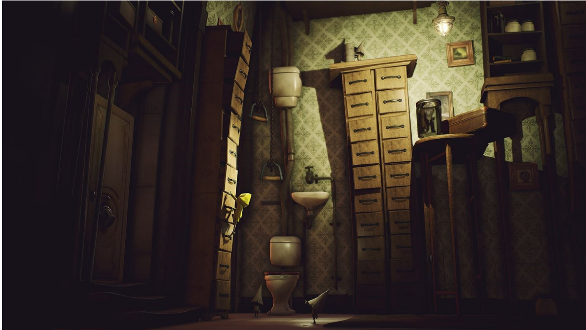
Slika 1 Okruženje u igri Little Nightmares, screenshot

Posljednja od klasičnih teorija jest formalistička. Zagovornici formalističkih teorija umjetnosti tvrdili su da je značajna forma suština svake umjetnosti. Glavni nedostatak formalizma je njegova sklonost da sadržaj smatra potpuno nebitnim za status umjetnosti. Ova doktrina postaje vrlo neuvjerljiva kada se uzme u obzir povijest umjetnosti, budući da je većina tradicionalne umjetnosti jednako usmjerena na sadržaj kao i na formu. Također, u mnogim slučajevima bilo bi nemoguće prepoznati značajnu formu u umjetničkim djelima ako se sadržaj smatra nebitnim za njihov umjetnički status (Carroll, 1999: 152-153).