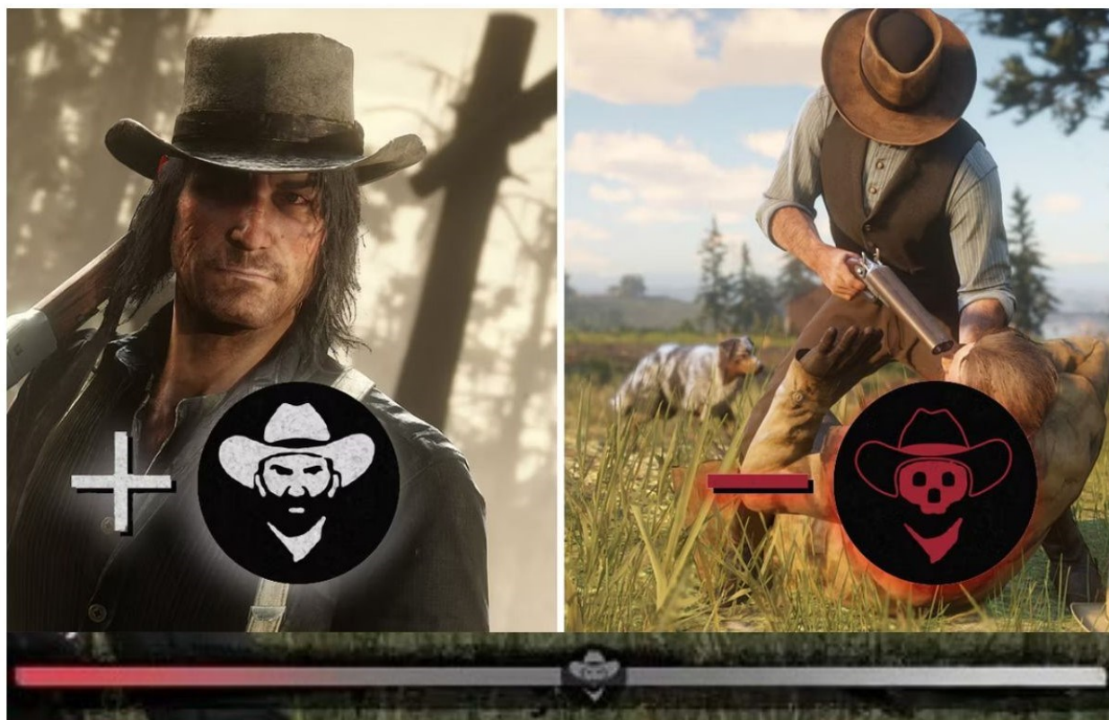
Slika 8 Na slici je prikazan moralni sistem s primjerom + i – na „moralnom metru“ u Red Dead Redemption 2 te se na dnu slike nalazi traka na kojoj se prikazuje moral lika tijekom igranja igre, a koji se mijenja s obzirom na odabire tijekom igranja

loši i činiti sve kako bi postali omraženi kauboји i dalje takvo ponašanje ostaje u interaktivnoj fikciji, a videoigru treba razlikovati od stvarnosti. Ipak, smatram da je većini igrača češći izbor u videoigrama da njihov lik krene „dobrim putem“, bez obzira na to što ponekad čine nemoralne stvari jer ih zabavljaju ili opuštaju takva djela u videoigrama, a koje bi se u stvarnom svijetu smatrale lošima. Na kraju je ipak bitna moralna prosudba u videoigri te da je moj odabir temeljen na etičkim vrijednostima kako bih za kraj priče oblikovala lika koji je ipak zadržao moral. Priča o Arthuru predstavlja njegovo iskupljenje, rast i spoznaju vlastite vrijednosti što čini ovu igru fantastično oblikovanim narativom, gameplayom, ali i zabavom.