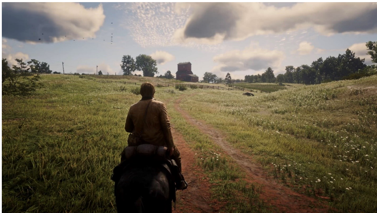
Slika 3 Primjer gotovo savršenog fotorealizma u videoigri Red Dead Redemption 2 pomoću moda, https://80.lv/articles/a-photorealistic-mod-for-red-dead-redemption-2/

I Dutton i Gaut ističu vještinu i virtuoznost izvedbe kao važne kriterije umjetnosti. Videoigre često prikazuju visok stupanj vještine dizajnera i razvojnih timova, koji stvaraju estetska i interaktivna iskustva. Takva iskustva su stvarana različitim metodama animacije, 3D modeliranja, teksturiranja i slično (Vigato, 2019: 16). U usporedbi s nekim tradicionalnim oblicima umjetnosti koji gube vještinu u izvedbi, videoigre jasno pokazuju vještinu kroz kreaciju realističnih i stilski različitih vizualnih reprezentacija. Suvremene igre napreduju, posebno u računalnoj grafici te se fotorealizam u videoigrama sve više približava savršenstvu.