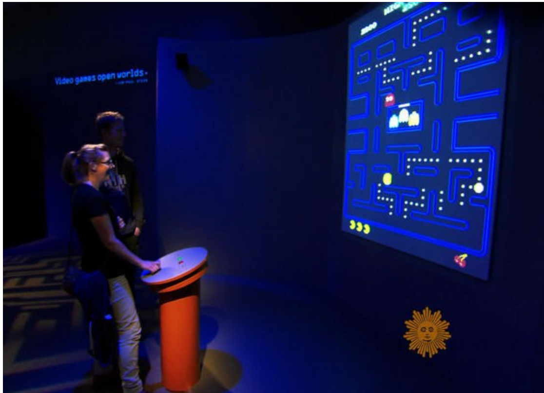
Slika 5 Posjetitelj igraju Pac-man na izložbi „The Art of Videogames“u Smithsonian American Art Museum

dodijelio industriji videoigara poreznu subvenciju. Tada su dva francuska dizajnera igara, Michel Ancel i Frédéric Raynal, te japanski dizajner videoigara Shigeru Miyamoto uvršteni u Ordre des Arts et des Lettres. (Crampton, T., 2006) Još jedan primjer priznavanja videoigara od strane institucija ostvaren je u svibnju 2011. godine kada je Nacionalna zaklada za umjetnost Sjedinjenih Američkih Država u procesu prihvaćanju prijava za umjetničke projekte za 2012. godinu uključila „interaktivne igre“ u proces (Funk, J., 2011). Time je SAD priznao videoigre kao oblik umjetnosti.