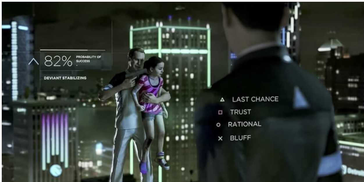
Slika 9 Schreenshot Detroit: Become Human