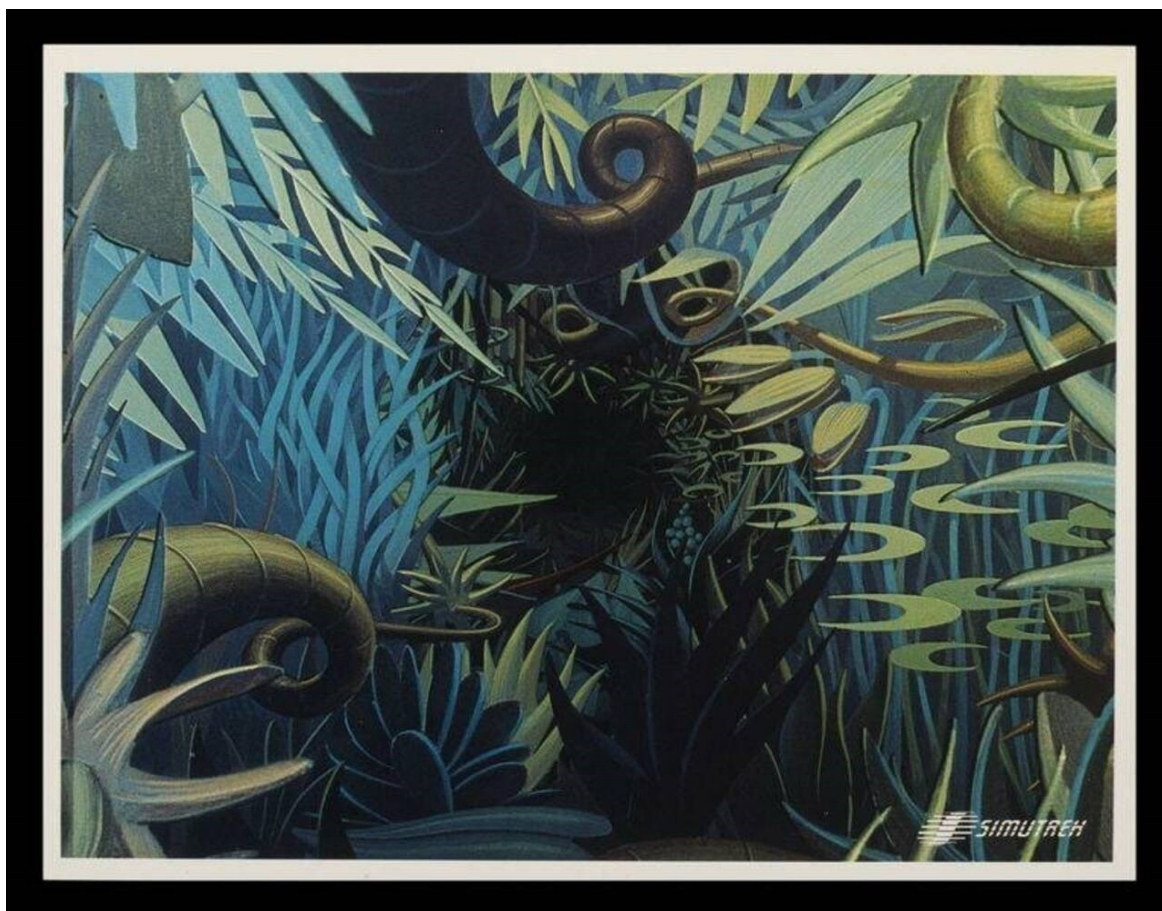
Slika 6 Fotografija iz videoigre „Cube Quest“, Paul Allen Newell, 1984, United States. Museum no. E.986-2008.