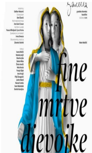
Slika 2: Kompromitirajući plakat predstavljen za predstavu „Fine mrtve djevojke“

Iza susretljivosti i ljubaznosti sustanara Ive i Marije, sakrivaju se mračne strane i motivi koji na vidjelo izlaze u trenutku kada susjedi saznaju kakav odnos Iva i Marija gaje jedna prema drugoj. U otkrivanju tajne koju su Iva i Marija krile se zapravo otkrivaju karakteristike ostalih likova filma. Da se tajna nije otkrila, ostali stanovnici tog kvarta živjeli bi uobičajenim životom. Otkrivanjem seksualne orijentacije svojih sustanara, otkriva se mračna strana Hrvatske realnosti. Naime, Matanić je na primjeru filma „Fine mrtve djevojke“ pokazao koliko je društvo netolerantno i puno mržnje, spremno ići do mjere ubojstva koje se na kraju filma i dešava u slučaju Marije koju sustanari bace po stepenicama, te ona umire. Prikaz realnosti hrvatskog društva, ne prikazuje se samo u filmu već i putem reakcija na film i kazališnu predstavu, a posebice plakat postavljen za potrebe predstavljanja predstave u kazalištu Gavella. Dizajner plakata bio je Vanja Cuculić, autor brojnih plakata i stalni suradnik kazališta Gavella, umjetnik uvršten na listu 115 najznačajnijih suvremenih hrvatskih umjetnika koju je objavio internetski portal engleskog vodiča Time Out Croatia. 14