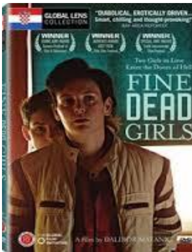
Slika 1: Naslovnica filma „Fine mrtve djevojke“

„Film je tek polazišna točka za ispitivanje stanja u kojem se kao društvo nalazimo, a na melodramatskom zapletu gradi se opasna i duhovita, zastrašujuća i na trenutke apsurdna, no prije svega upozoravajuća priča o tome što smo sve spremni učiniti jedni drugima, uvjereni da različitost ugrožava spokoj naših naoko skladnih života.“ 13