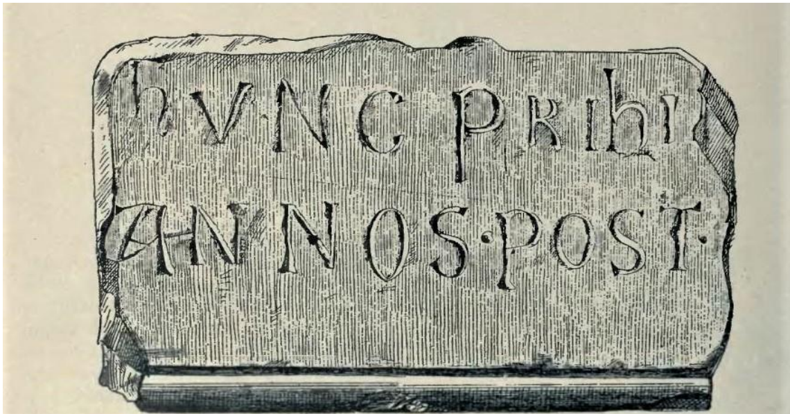
Slika 3. Odlomak natpisa na kamenu iz doba bana Pribine pronađenog na Kapitulu kod Knina (polovica 10. st.). 74

bio jedan od sinova Krešimira I. Odlučio je osvetiti bratovu smrt te je oko 970. pobijedio bana Pribinu u boju.