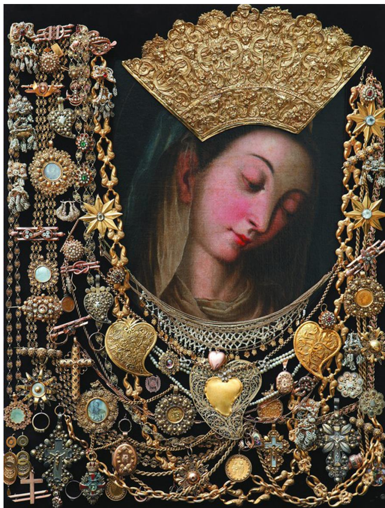
Slika 7. Čudotvorna slika Gospe Sinjske. 142

Gospa ih je čula. Sva u bilu pojavila se na gradskin zidinama, pogledala u svoje vjernike i ispružila ruku prema Turcima. Kažu da je odala po gradskin zidinama, a da su Turci počeli bižat, a neki da su umirali na mistu. Svit priča da je na njih poslala kugu, a meni ti je moja baba pričala da in je dala srdobolju i oni su ti se rabižali, a velik dio njih se utopijo u Cetini koja je onda naglo narasla. I nikad ti se više oni nisu u naš kraj vratili. 141