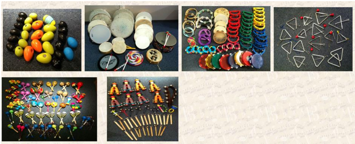
Slika 2. Glazbeni instrumenti Orffova intrumentarija