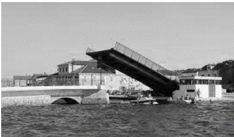
Slika 3. Most u Tisnome (otok – kopno) 6