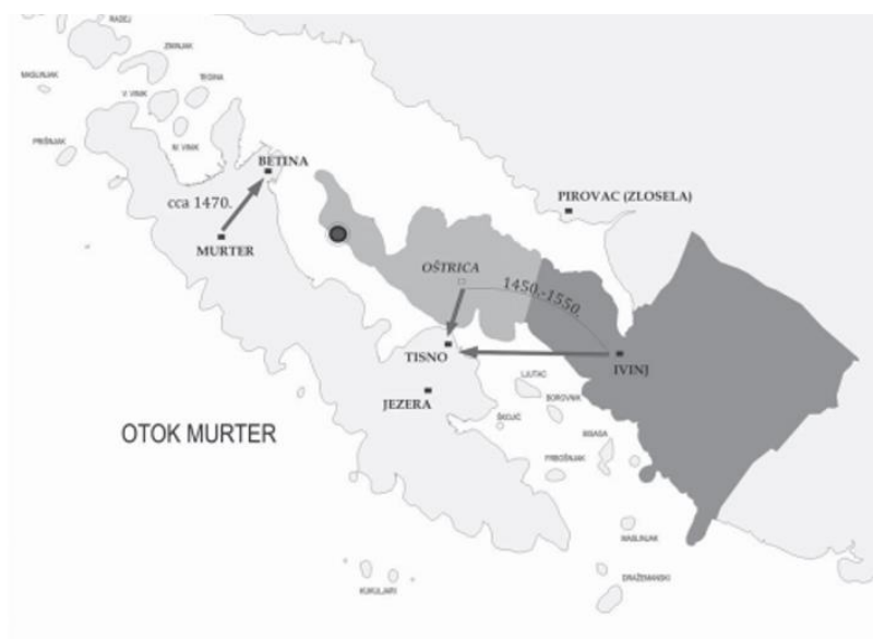
Slika 1. Položaj Tisnoga i Jezera u odnosu na Murter i Betinu 4

Kao što je rečeno, govor Tisnoga i Jezera pripada južnočakavskom ili ikavskočakavskom dijalektu. Južnočakavski dijalekt glavninom je zastupljen na otocima od Pašmana do Korčule, uključujući i zapadni Pelješac (Lovište, Trpanj, Orebić, Viganj, Kućište, Kuna, Pijavičino, Potomje) i jug otoka Paga (Dinjiška, Povljana, Vlašići). Tom dijalektu, dakle, pripadaju mjesta od Ždrelca do Tkona na Pašmanu, otok Vrgada, Betina, Murter, Tisno i Jezera, Prvić, Zlarin, Žirje i drugi otoci pred Šibenikom, Drvenik Mali i Drvenik Veliki, Grohote i druga mjesta na Šolti, bračka naselja Supetar, Postira, Pučišća, Milna, Dračevica i druga, mjesta od Hvara preko Brusja, Vrnisnika do Bogomolje na Hvaru, Vele Luke, Blata, Smokvice, Žrnova i drugih mjesta na Korčuli... Ikavski čakavski idiomi su i Klana i Studena sjeverno od Rijeke, zatim zona od Novigrada i Privlake kod Zadra do Cetine (Bibinje, Sukošan, Sv. Filip i Jakov, Biograd na Moru, Pakoštane, Vodice, Primošten, Rogoznica, Marina, Vinišće, Trogir, Kaštel Štafilić i druga kaštelanska mjesta, Solin, Mravince, Žrnovnica, Stobreč, Dugi Rat itd.). Čakavsko je i južno Gradišće (Stinjaki, Santelek, Žarnovica, Jezerjani, Prašćevo, Veliki Medveš, Žamar, Nova Gora, Pinkovac, Hrvatska Čenča, Zajčje Selo, Hrvatski Hašaš, Vardaš i Katalena) kojem se dodaje i tzv. Štoje u mjestima Milištrof, Sabara, Vincjet, Čajta, Čemba (Austrija) te u selima Narda, Čatar, Hrvatske Šice i Petrovo Selo u Madžarskoj (Lisac, 2009: 139).