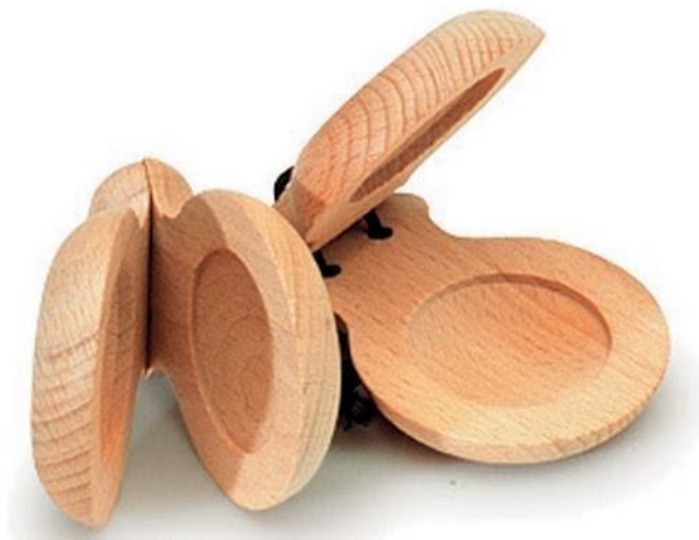
Slika 11. Kastanjete