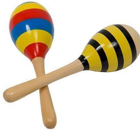
Slika 8. Zvečke