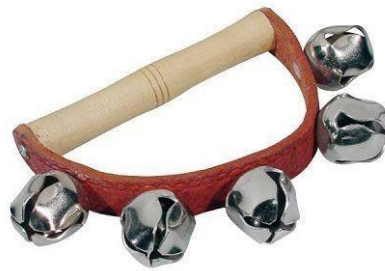
Slika 10. Praporci