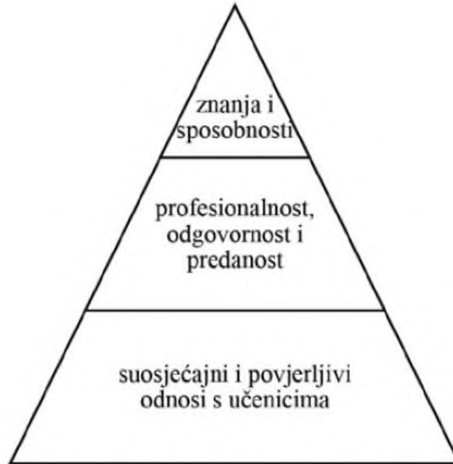
Grafikon 2. Hijerarhija cijenjenih kvaliteta dobrog učitelja (McKnight i sur., 2011, str. 44)

Slijedom istraživanja, Whitaker (2004; 2012) donosi sažetak što i kako rade najbolji učitelji: