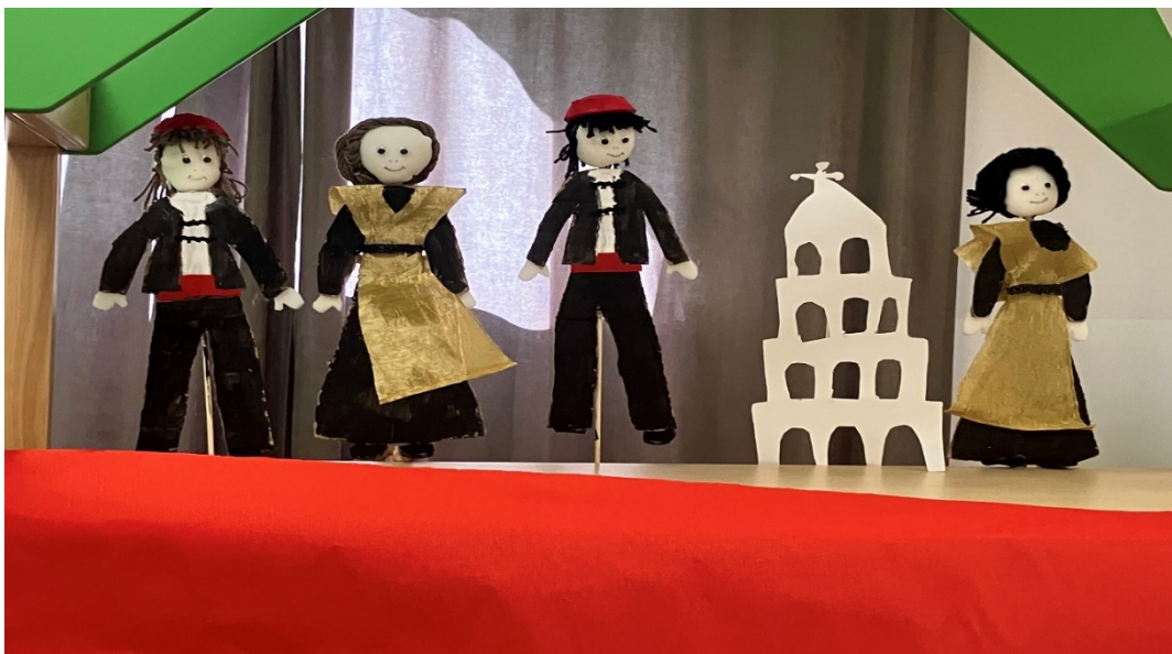
Slika 12. Animacija lutaka

Dječak III.: Split mi je u duši i ništa kontra Splita.