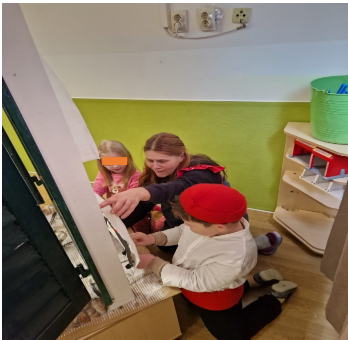
Slika 2. Scensko uvježbavanje

divojko i Dvi gitare i jedna mandolina 31 . Koreografija za Splitske plesove pojednostavila se i prilagodila djeci, a uzor je bio videoprikaz izvedbe KUD-a Jedinstvo 32 . Splitske narodne nošnje napravljene su prema slikama na mrežnoj stranici narodni.NET 33 .