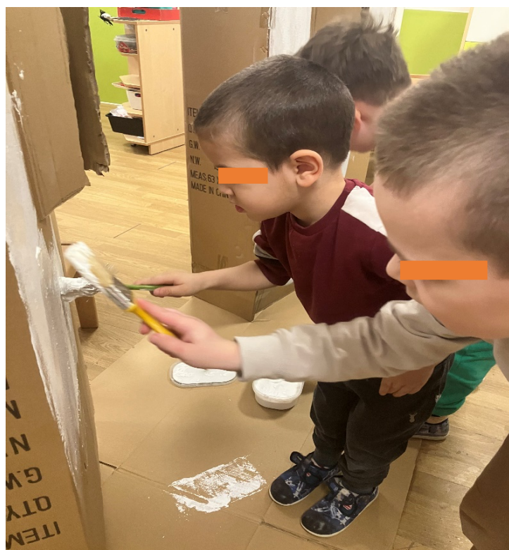
Slika 9. Bojenje dalmatinske kuće