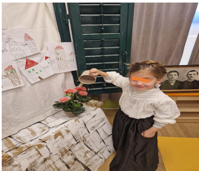
Slika 21. Zalijevanje cvijeća