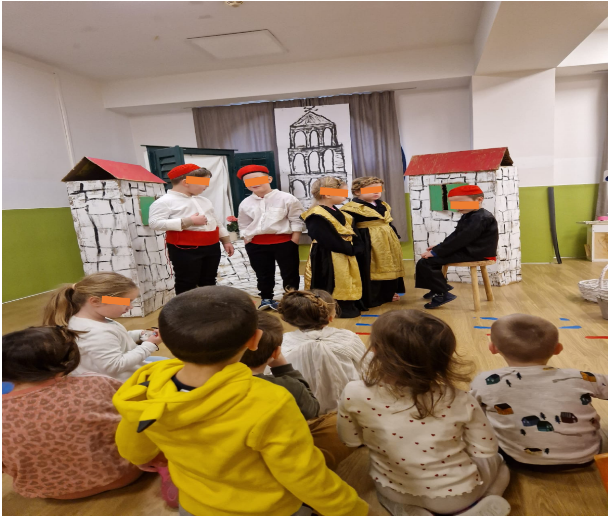
Slika 23. Pripovijedanje dječaku