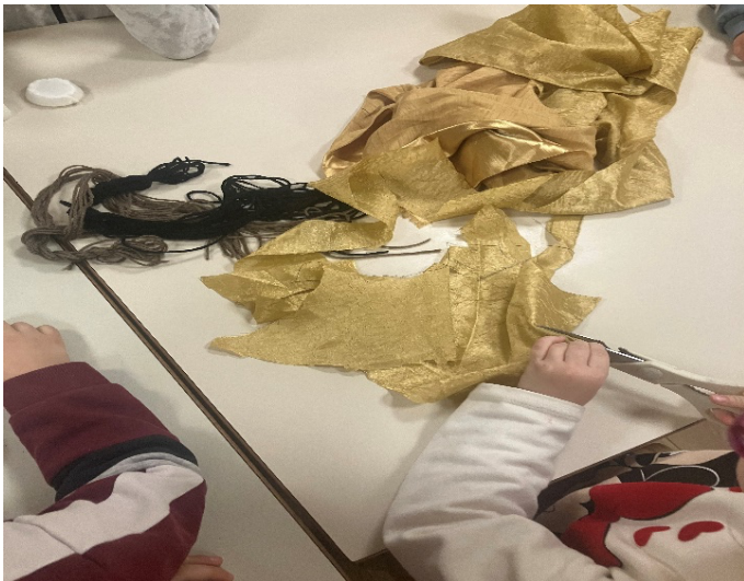
Slika 6. Krojenje odjeće za lutke