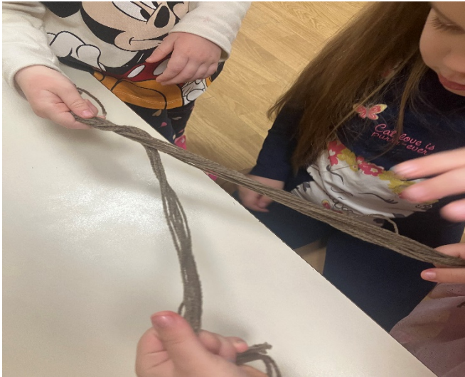
Slika 4. Pletenje pletenica za kosu lutke