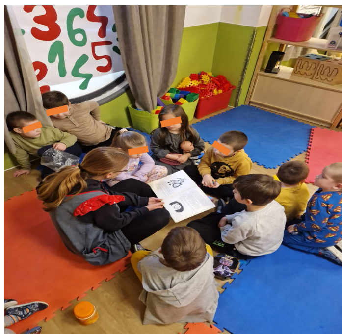
Slika 3. Čitanje teksta na čakavici