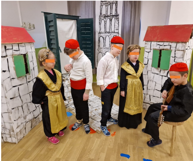
Slika 25. Pjevanje pjesme