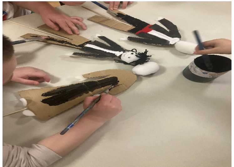
Slika 7. Bojenje tijela lutke

Izradio se veći broj scenografija: priprema kazališta lutaka, kazalište sjena, izrada dalmatinskog trga (slike 8, 9 i 10) i dekoracija dalmatinske kuhinje (slika 11). Materijal koji se upotrebljavao za izradu scenografije bio je kartonske kutije, škare, ljepilo, tempera, kistovi, četke za bojenje, valjci, metalne kukice, hamer papir i boja za zid. Prikupljali su se, uz sudjelovanje roditelja, mnogi stari predmeti kao što su pegla , demižana , starinska fotografija, tronožac, škure , mandolina i predmeti novije izrade, ali po starinskoj shemi kao što su vrčevi, čipkasti stolnjaci, miljetici , košare, maštilo i čikare . To je pridonijelo autentičnosti projekta.