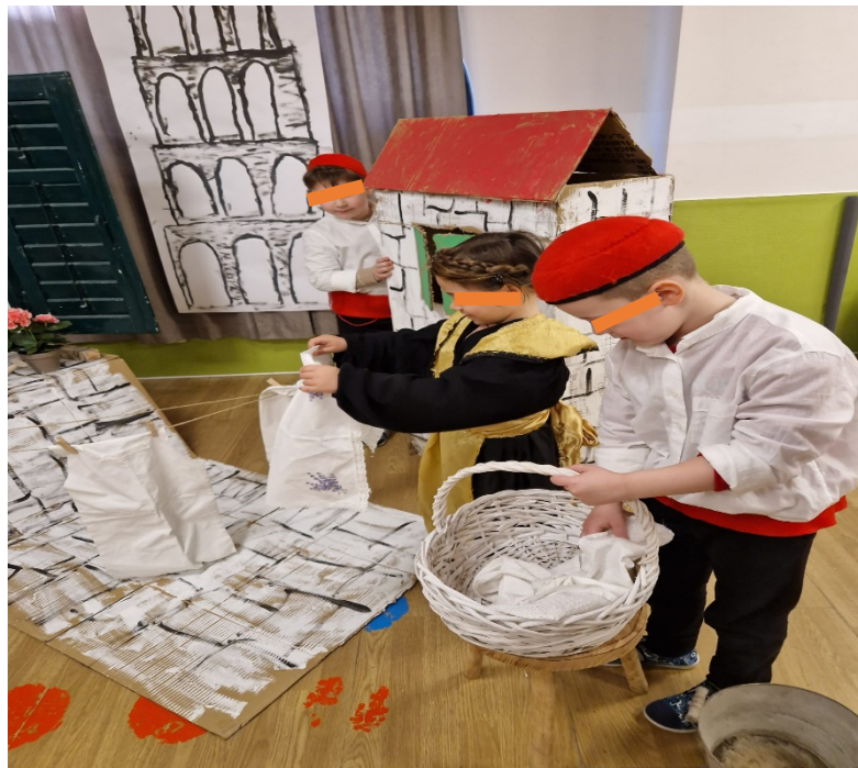
Slika 19. Prostiranje robe na tiramolu