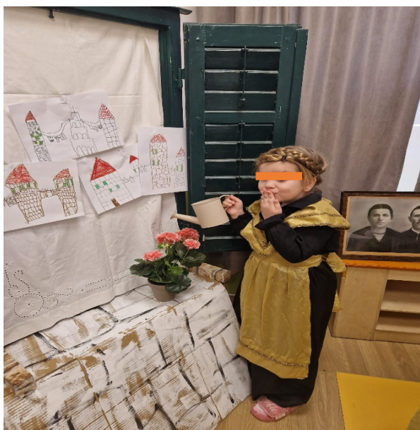
Slika 20. Zalijevanje cvijeća