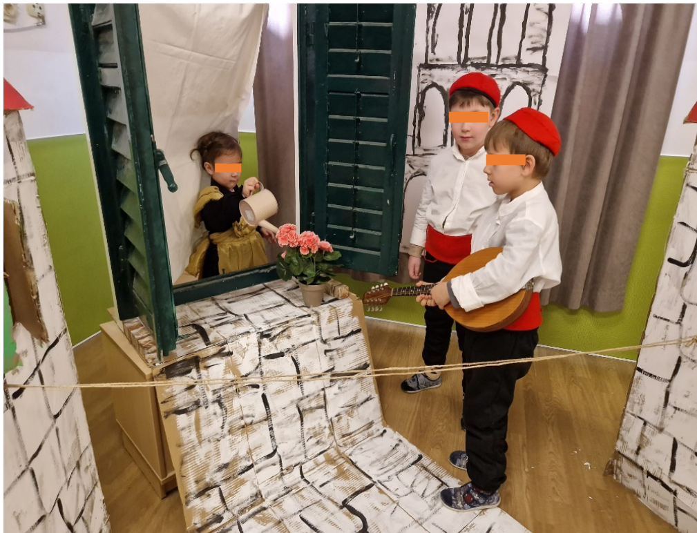
Slika 26. Pjevanje serenade