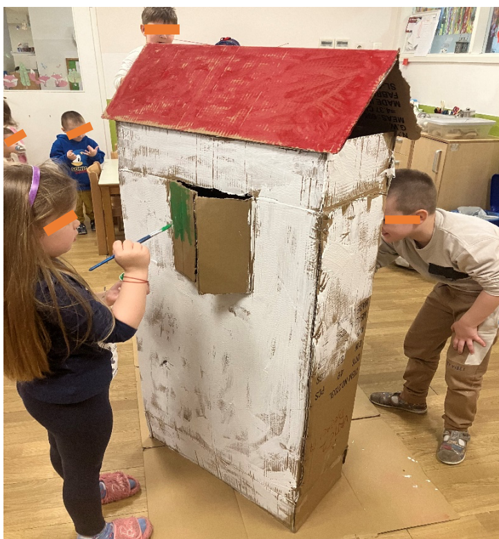
Slika 8. Bojenje dalmatinske kuće