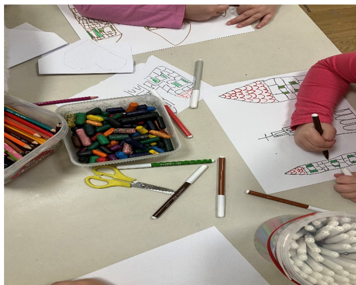
Slika 11. Crtanje grada Splita