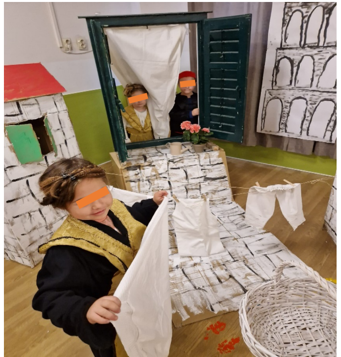
Slika 18. Prostiranje robe na tiramolu