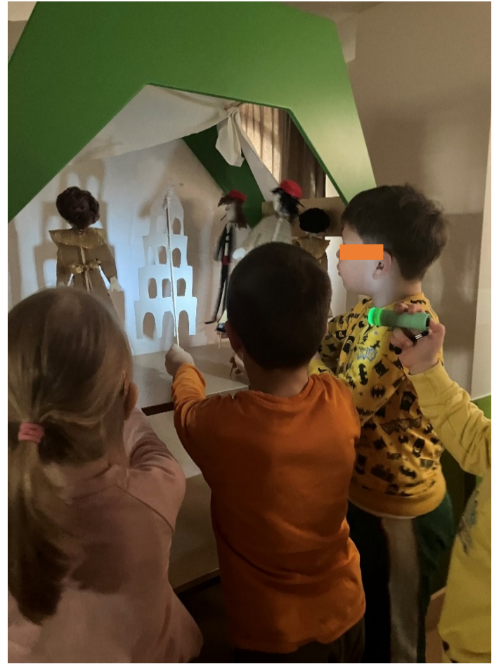
Slika 16. Kazalište sjena