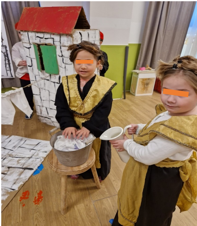
Slika 17. Pranje robe u maštalu