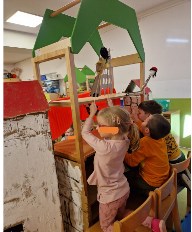
Slika 14. Animacija lutaka