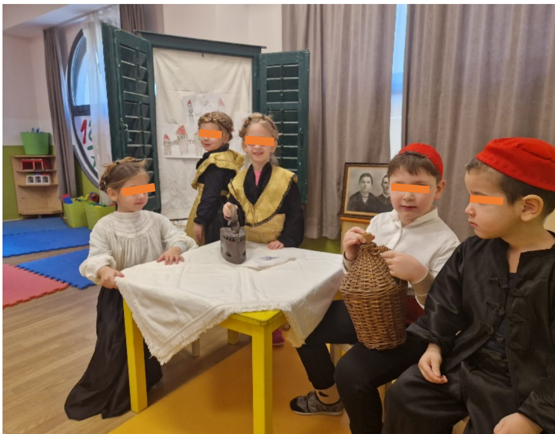
Slika 22. Ugođaj dalmatinske obitelji

Priprema za scensko izvođenje pjesama obuhvaćala je čitanje stihova, razgovor o pročitanom i razumijevanje značenja riječi u pjesmi. Djeca su ponavljanjem uz igru zapamtila izvorni tekst. Odabirale su se riječi na čakavskom narječju i tražio njihov književni izričaj: