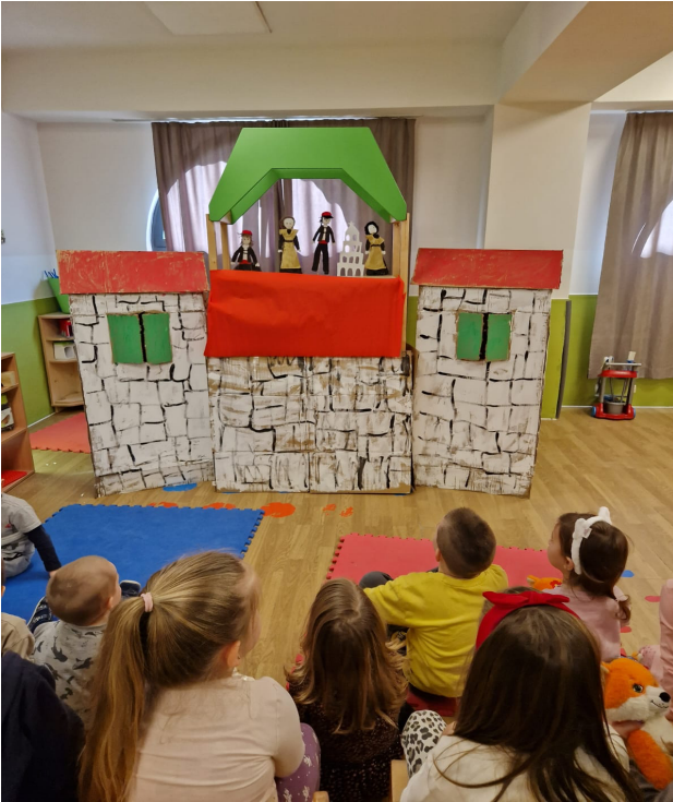
Slika 13. Animacija lutaka