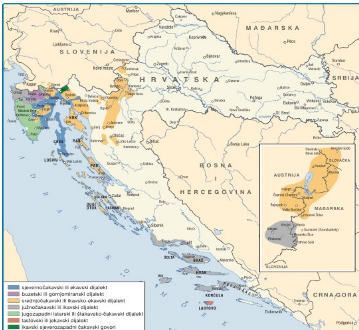
Slika 1. Rasprostranjenost čakavštine