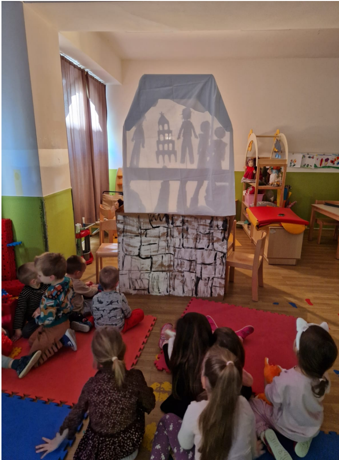
Slika 15. Kazalište sjena