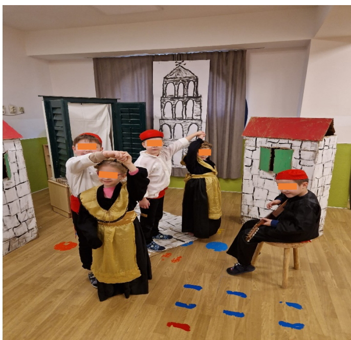
Slika 27. Plesanje Splitskih plesova

SUDJELUJU: U ovoj aktivnosti sudjelovalo je petero djece, od toga tri dječaka (6, 6,5 i 6,7 godina) i dvije djevojčice (5 i 6 godina).