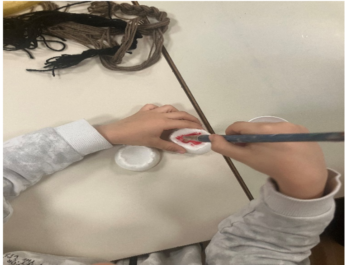
Slika 5. Bojenje dijelova odjeće za lutke