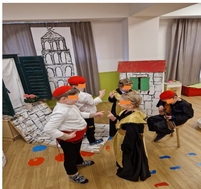
Slika 28. Plesanje Splitskih plesova