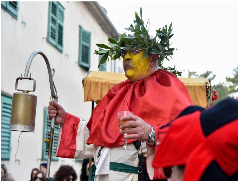
Bako u povorci 2018. godine 76

Da te u Milan vrag odnese, jer ti prazniš naše kese! 75