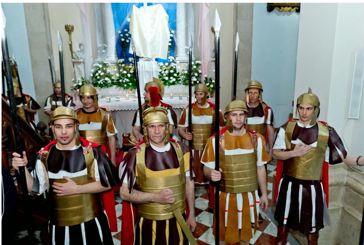
Čuvari Kristova groba (žudije) u Imotskom 90