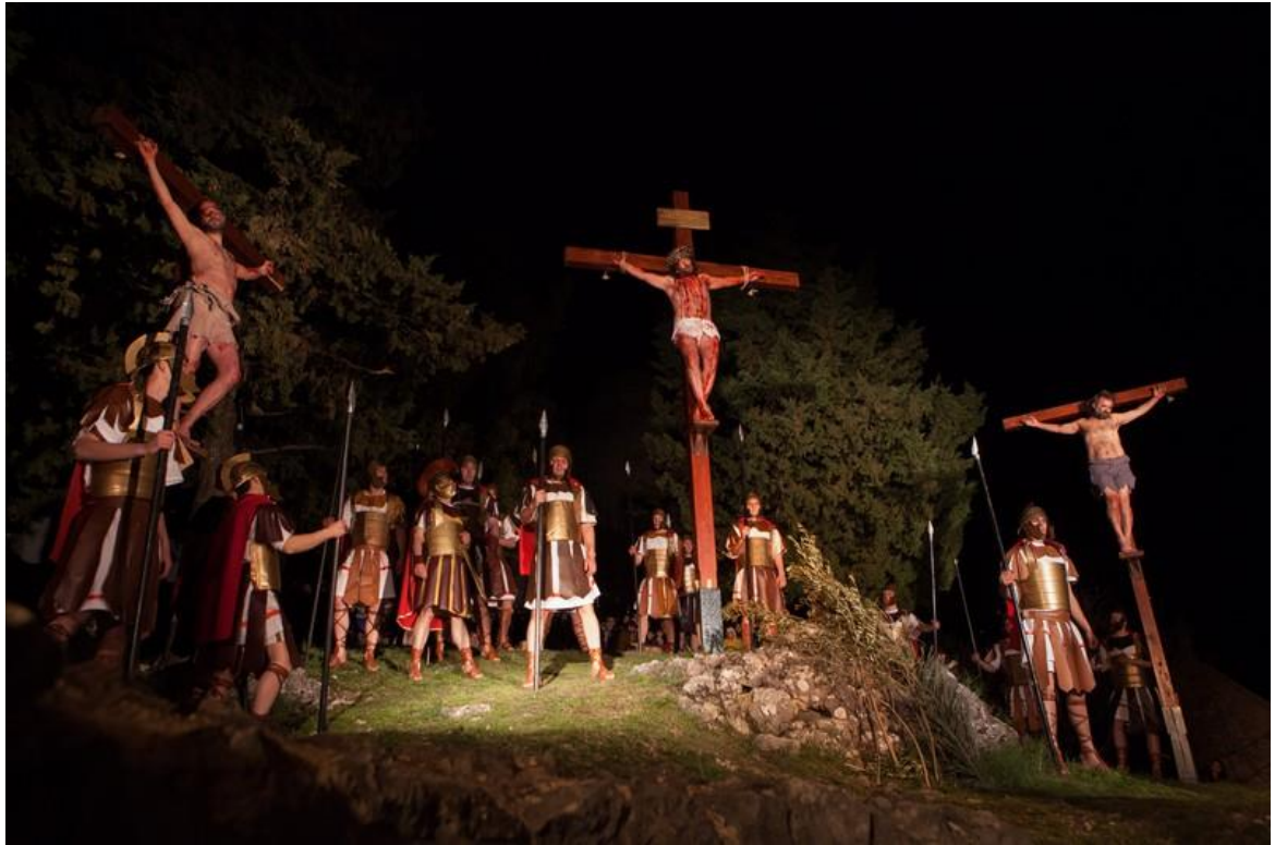
Scena raspeća na Živim slikama muke Isusove u Imotskom 2018. godine 82

Topana gdje se odvijaju potresne scene raspeća i, napokon, Isusova uskrsnuća. Ovaj događaj svake godine privlači sve više i više Imočana a i stranaca, a posljednjih nekoliko godina moguće je pratiti i prijenos uživo na internetu.