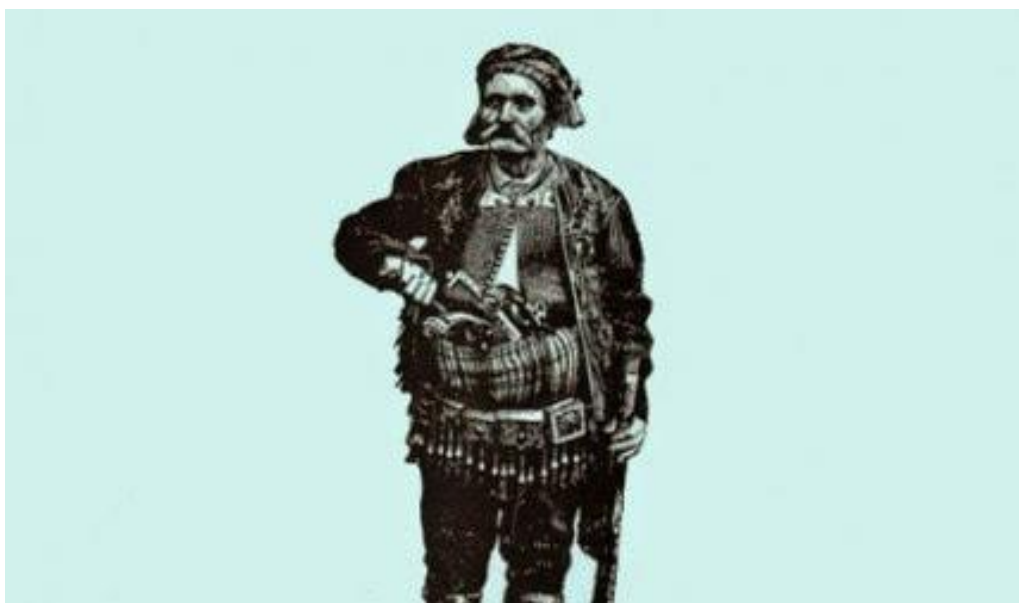
Hajduk Andrijica Šimić 19

Za Imotsku krajinu veže se i jedna posebna priča, koja je u usmenoj predaji preživjela u nekoliko različitih varijanti. Priča je to o Andrijici Šimiću, legendarnom hrvatskom hajduku koji je svojom spretnošću i snalažljivošću postao zapamćen među Hrvatima u Dalmaciji i Hercegovini. Rodio se 2. listopada 1833. godine u Alagovcu pored Gruda. Sa samo 10 godina otišao je u Mostar u službu agi Tikvini i služio ga punih 10 godina. Nepravde i zulum kojemu je svjedočio natjerali su ga da 1859. godine ode u planinu. Oružje je oteo nepoznatome begu tako što mu je sasuo šaku prašine u oči. Andrijica Šimić hajdukovao je po Rakitnu, Doljanima, Imotskom, Kupresu, Livnu, Glamoču i Vrlici. Narod ga u pričama opisuje kao branitelja sirotinje i zaštitnika potlačenih. Često je progonio i bogatije kršćane. Uhićen je nakon izdajom 1866. godine i izručen turskim vlastima. Dvije godine proveo je u tamnicama u Splitu, Imotskom, Duvnu, Livnu i Ljubuškom da bi, „prepilivši okove, 1868. pobjegao iz ljubuškog zatvora i ponovno se odmetnuo u hajduke.“ 18