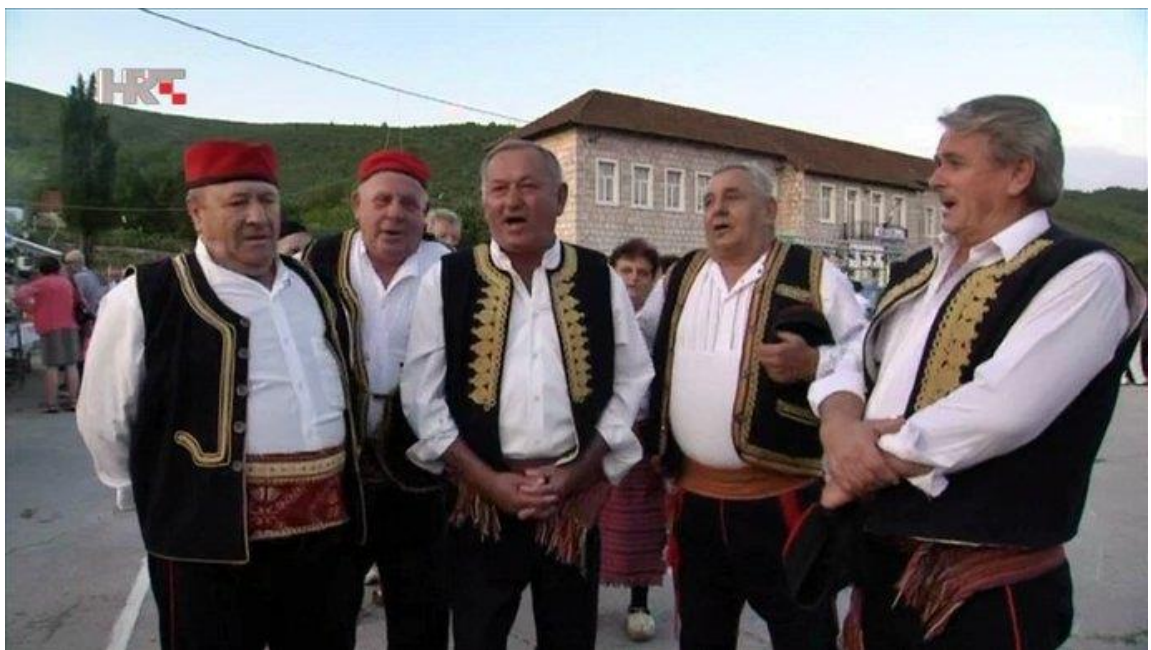
Imotski gangaši na Festivalu gange u Slivnu 56

Eto, tako vam je otkad odoste, to vam je štono reče pjesnik, 'ta sva povijest roda moga'! A moj rod ganga i ojkovica, bura u badnju - zahuči, pa oduši! Što hoćete? ... Zar se u svoje vrijeme niste i vi tako tužili i u djedovima Boga gledali?! Pa vam je i ova moja tužaljka u redu! E, kad vam je u redu, drž'te je tvrdo i ostanite gdje jeste, a ja odoh...'' 55