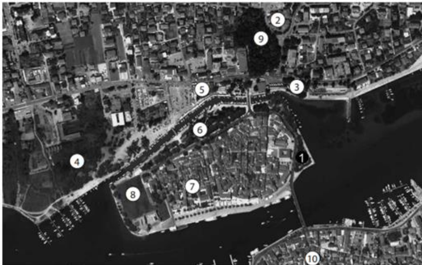
Slika 1. Satelitska snimka Trogira i neposredne okolice s naznačenim najvažnijim toponimima: 1. Žudika; 2. Dobrić; 3. Lokvice; 4. Soline; 5. Travarica; 6. Fortin; 7. Pasike; 8. Batarija; 9. Garanjinov vrtal; 10. Čiovo