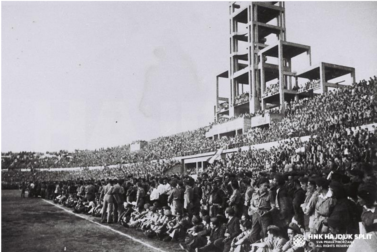
Fotografija 1. Hajduk u Bariju protiv reprezentacije Velike Britanije

Ova kratka analiza nogometnih zbivanja od nogometnih početaka u Jugoslaviji pa do kraja Drugog svjetskog rata nam daje jedan uvid kako su to 3 najvažnija nogometna centra, Beograd Zagreb i Split „disali“ te s kakvom su „duhovnom prtljagom“ u nogometnom smislu dočekali 1945., jer nogomet je ubrzo postao važan faktor u svakodnevnom životu te je kao takav postao važan politički alat kojim su političari pokazivali mišiće u nacionalnim prepucavanjima. Koliko god su komunistički političari kudili politiku Karađorđevića i općenito ideologiju prethodne Jugoslavije, postavlja se pitanje jesu li i koliko, mudrije postupili prema vrućem krumpiru kakav je zasigurno nogomet. Neki motivi koji su viđeni u Kraljevini Jugoslaviji itekako će se ponavljati u drugoj Jugoslaviji, te ih je zato bilo važno navesti. Također jedna nezanemariva činjenica o Kraljevini Jugoslaviji je ta da su njeno nogometno prvenstvo osvajali isključivo klubovi iz 3 spomenuta grada, što dovoljno govori o njenoj nerazvijenosti u gospodarskom smislu.