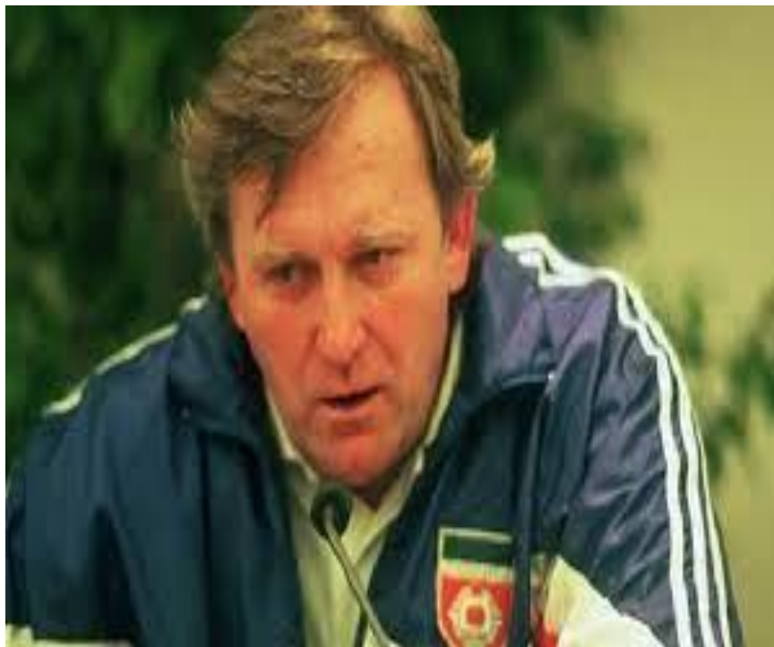
Fotografija 30. Ivica Osim na funkciji izbornika nogometne reprezentacije Jugoslavije

Osim je nastavio trenirati reprezentaciju i u kvalifikacijama za Euro 1992. 1991. je paralelno s reprezentacijom preuzeo i Partizan, ali hrvatski igrači su zadnji nastup za jugoslavensku reprezentaciju upisali u 5. mjesec 1991. Nakon što je završila sezona 1990./1991., kako je rat stvarno počeo, tako su hrvatski klubovi odbili igrati Jugoslavensku ligu u sezoni 1991./1992., a samim time i igrači nastupati za reprezentaciju. Igrači iz BiH su ostali kao i trener Osim. Sam Osim je dao ostavku s obje pozicije 23.5.1992., nakon što je već mjesec dana njegovo rodno Sarajevo bilo pod opsadom JNA. 153