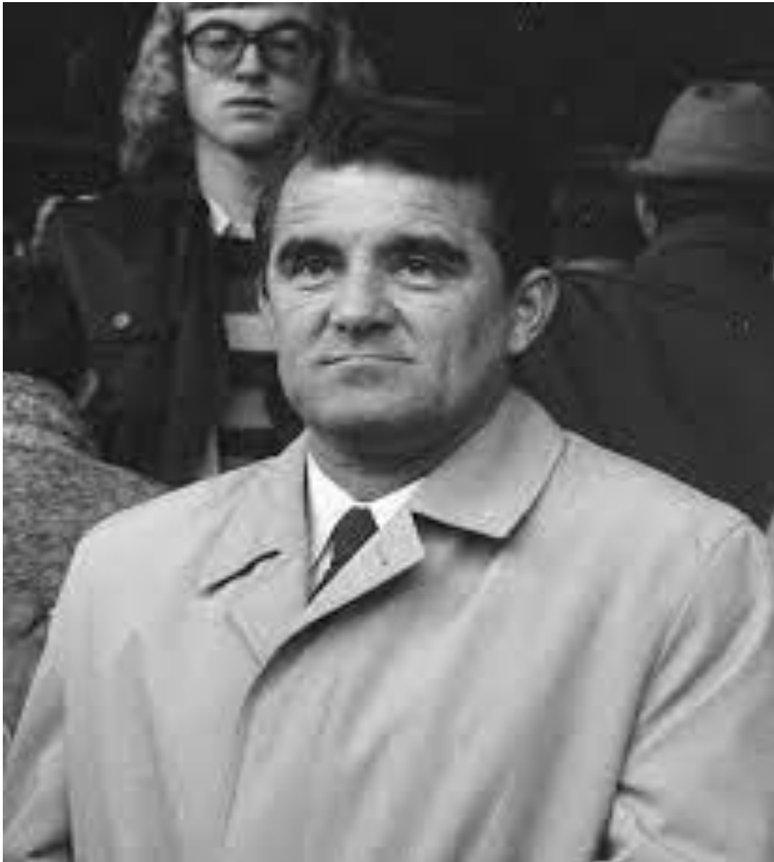
Fotografija 19. Miljan Miljanić, izbornik reprezentacije na SP 1974. i 1982., od 1986. direktor reprezentacije, nakon SP 1974. prezeo Real Madrid, kojeg je trenirao 3 godine i osvojio 2 titule prvaka kao i Kup kralja.