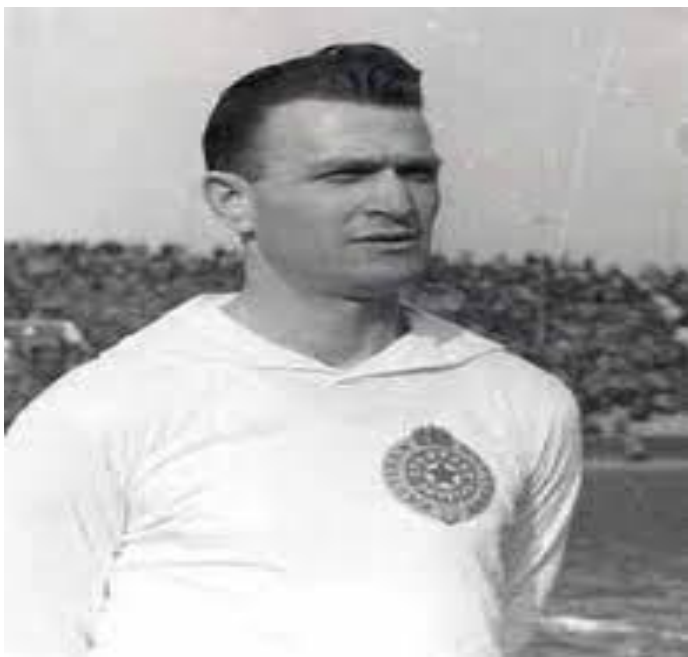
Fotografija 5. Stjepan Bobek, najbolji strijelac Partizana i jugoslavenske reprezentacije svih vremena