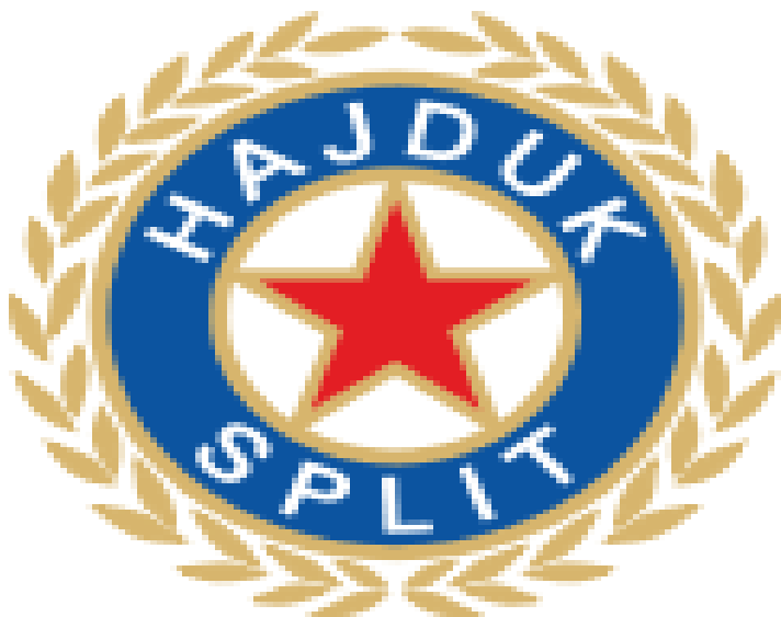
Fotografija 3. Grb HNK Hajduk