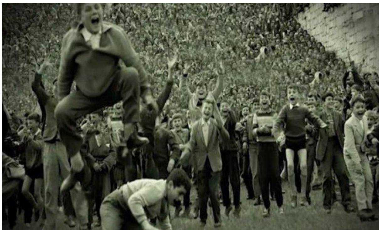
Fotografija 6. Slavlje navijača Hajduka nakon pobjede nad Crvenom Zvezdom

S druge strane je Jure Bilić objavio odgovor u splitskom listu „Slobodna Dalmacija“ da tako nesportsko, nekorektno i jednostrano pisanje ima tendenciju stvaranja sukoba među klubovima. Uskoro je nastao rat između vodstva partije na saveznoj razini s jedne, te vrha partije u Dalmaciji s druge strane. Koliko god Ante Jurjević Baja bio svemoćan u Dalmaciji, ipak je Milovan Đilas bio partijska knjižica broj 4. Partija je negativno ocijenila djelovanje Torcide, kao i vodstva Hajduka, a sigurno im nije pomogla činjenica da su u klub vratili „proustaškog elementa“ Viđaka. Tako su Ante Jurjević Baja i Jure Bilić udaljeni iz Hajduka te su dobili partijski ukor, Frane Matošić je isključen iz partije, da bi kasnije na Titovu intervenciju ipak bio vraćen. Svi koji su na neki način pomogli Torcidi, su dobili ili ukor ili su smijenjeni s dužnosti. Najgore je svakako prošao Vjenceslav Žuvela koji je osuđen na 3 godine zatvora, da bi mu ipak odlukom višeg suda kazna bila smanjena na 3 mjeseca. Torcida je zabranjena kao opasnost za partiju, ali je očito da ona nije nastala kao politička ili nacionalistička organizacija nego isključiva sportska i lokalpatriotska. Torcida je nastala uz blagoslov partije, ali je kao žrtva unutarpartijskog sukoba mišljenja i ugašena. 42