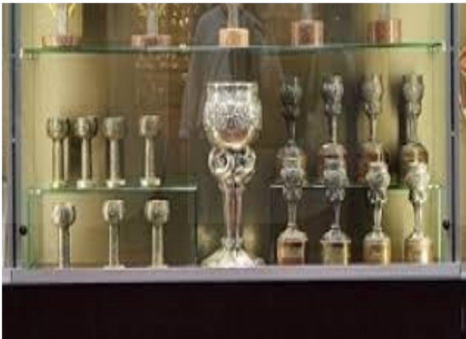
Fotografija 27. Kup Maršala Tita u trajnom vlasništvu Hajduka

Kontroverzno je bilo i zadnje finale Jugoslavenskog nogometnog kupa. 8.5.1991. Hajduk, koji je jedva izborio opstanak te sezone, je igrao finale u Beogradu protiv najjače Crvene Zvezde svih vremena, koja je uvjerljivo osvojila drugo prvenstvo zaredom. Za 3 tjedna je Crvenu Zvezdu čekalo finale Kupa prvaka te sigurno nisu željeli da im se netko ozljedi. No, protiv Hajduka su svejedno poslali najjači sastav. Hajduk je mudrom igrom potpuno neutralizirao jačeg protivnika te je iz kontre pogotkom Alena Bokšića slavio. Kapetan Hajduka Igor Štimac je poljubio pehar, uzeo ga u ruke te ustvrdio da pehar nose kući, jer se više Kup Jugoslavije neće igrati. 147