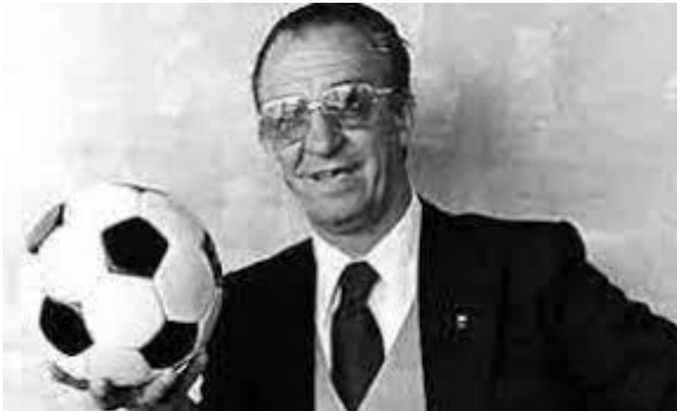
Fotografija 29. Mladen Delić, legendarni sportski komentator