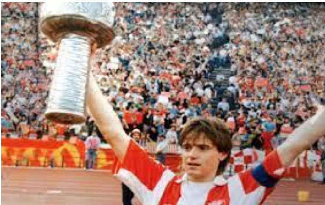
Fotografija 22. Dragan Stojković „Piksi“ , 5. „Zvezdina zvezda“