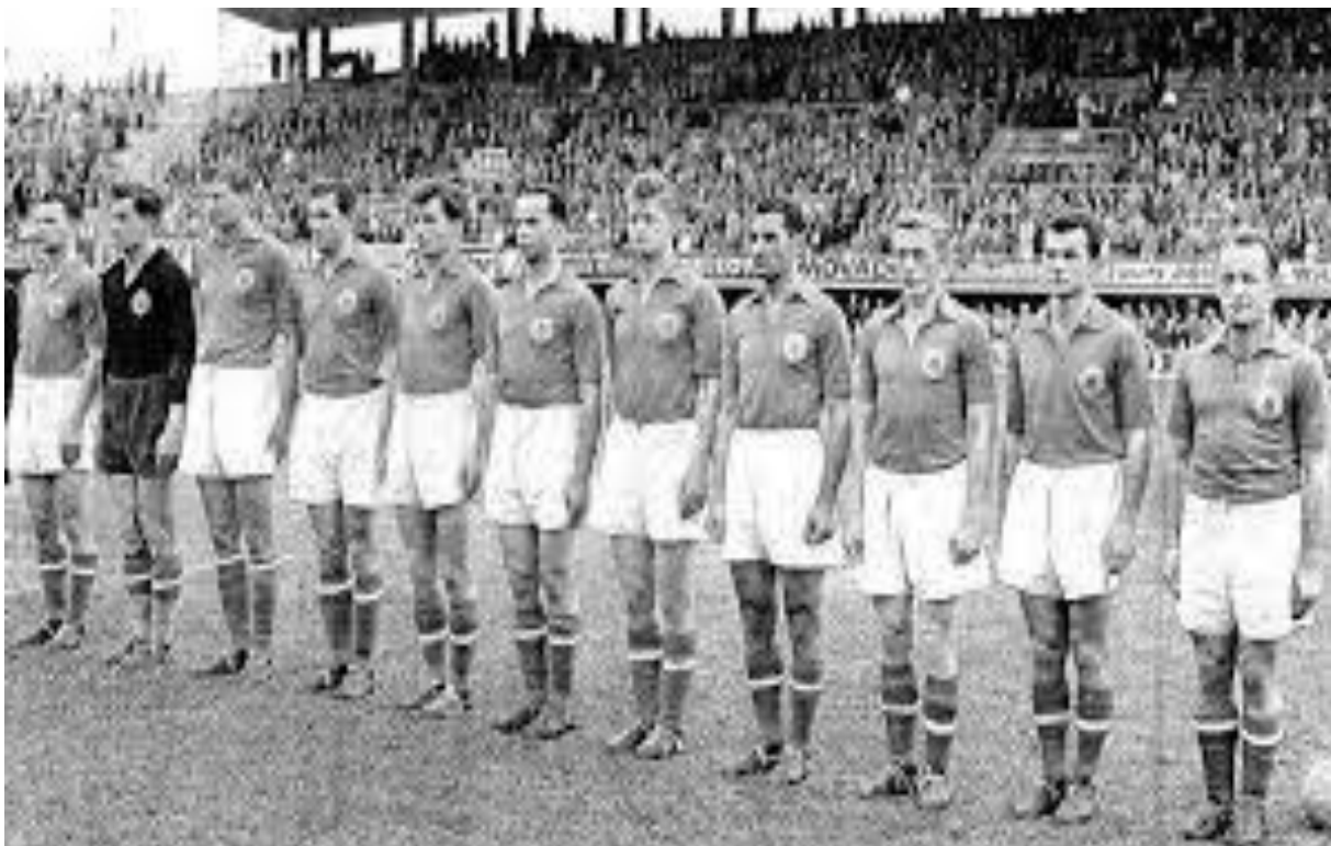
Fotografija 8. Jugoslavenski reprezentativci pred okršaj sa SSSR-om

Što se tiče same Jugoslavije, srebrna medalja na Olimpijskim igrama, kao i trijumf nad SSSR-om je iskorišten u političke svrhe te su sami nogometaši nagrađeni sa 200 američkih dolara, što je tada bio zaista velik novac. Ipak je važno naglasiti da dobar rezultat istočnih zemalja leži u činjenici da zapadne zemlje nisu mogle slati profesionalce, dok najbolji igrači istočnih zemalja navodno također nisu bili profesionalci, iako je to smiješno. U Jugoslaviji je reprezentacija bila tako dobro praćena da su svi znali napamet sastav Beara, Stanković, Crnković, Čajkovski, Horvat, Boškov, Ognjanov, Mitić, Vukas, Bobek, Zebec. 49