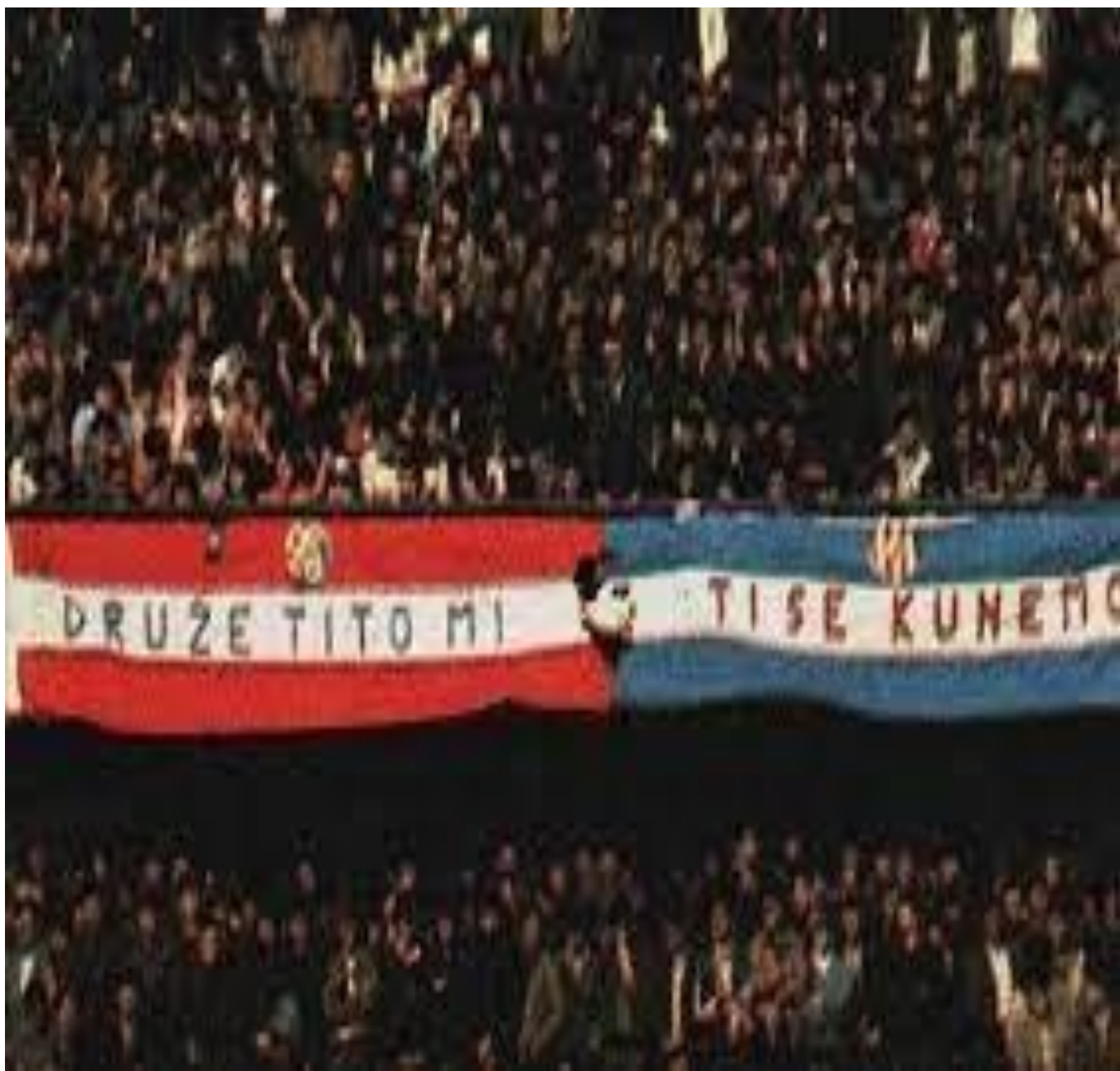
Fotografija 25. Ujedinjeni navijači Dinama i Crvene Zvezde u finalu kupa 1980.