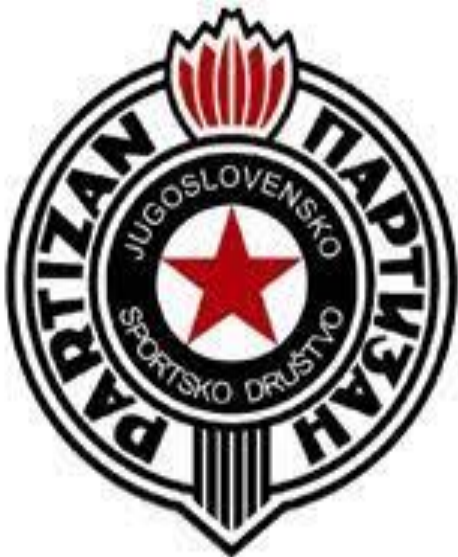
Fotografija 4. Grb JSD Partizana

Kad bismo analizirali 1950-te godine rezultatski, vidjeli bi da je recimo 1951. od 12 klubova njih 11 dolazilo iz Srbije i Hrvatske. Iz Srbije sedam, a iz Hrvatske četiri te je jedina iznimka bila Sarajevo. Kako se bližimo kraju pedesetih godina, tako dolaze u ligu klubovi iz drugih republika pa se tako iz Crne Gore etablira Budućnost iz Titograda (današnja Podgorica), a iz Makedonije Vardar iz Skopja te Rabotnički koji je doduše prvoligaški nogomet igrao samo jednu sezonu, kao i ljubljanski Odred koji će se kasnije preimenovati u Olimpiju. Iz Bosne i Hercegovine u ligu uz Sarajevo ulaze i Velež iz Mostara te Željezničar iz Sarajeva te Sloboda iz Tuzle. U Srbiji osim Beograda etablira se kao jaka ekipa Vojvodina iz Novog Sada, dok u Hrvatskoj uz nekoliko momčadi iz Zagreba uz Dinamo (Zagreb, Lokomotiva, Borac), javlja se i druga momčad iz Splita, Radnički nogometni klub Split te kao novi centar osim Zagreba i Splita se javlja i Rijeka. Najbliže prekidu dominacije velike četvorke u ligi je bila Vojvodina koja je jednom bila druga, kao i BSK koji je osvojio i dva kupa, no ipak velika četvorka relativnom lakoćom osvaja bodova protiv manjih koji im ipak nisu mogli parirati.