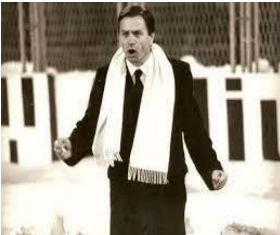
Fotografija 23. Miroslav Ćiro Blažević, „čovjek s dušom demona i licem Alana Delona“