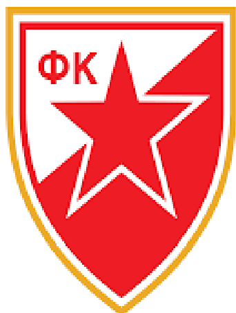
Fotografija 2. Grb FK Crvene Zvezde