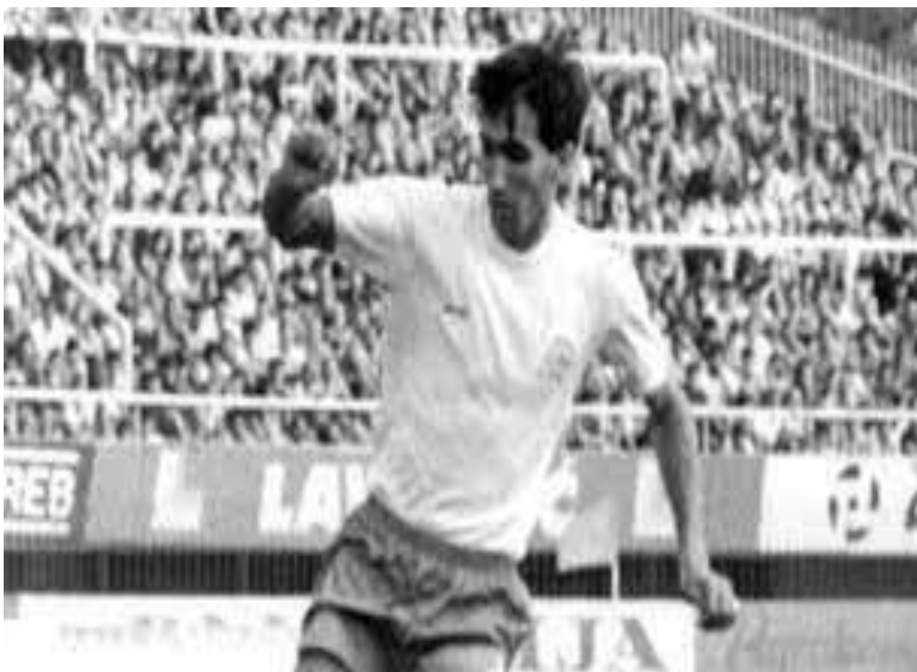
Fotografija 24. Zlatko Vujović, legendarni golgeter Hajduka