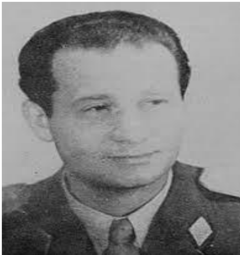
Fotografija 13. General Ivan Šibl, jedan od najboljih predsjednika Dinama svih vremena

O klupskom pogonu Hajduka se još brinulo 16 ljudi, od kojih je 7 bilo u stalnom, a 9 u honorarnom radnom odnosu. S druge strane, Dinamo je imao 5 profesionalnih trenera. Trener prve momčadi Branko Zebec je imao plaću od 150 tisuća starih dinara, trener juniora Vlado Zajec 120 tisuća starih dinara, a trener pionira Zorislav Srebić plaću od 70 tisuća starih dinara. Dinamo je čuvao podatke o premijama te su bili klupska tajna. U Dinamu je bilo zaposleno 40 radnika čime je Dinamo držao rekord među jugoslavenskim klubovima. To je svakako zasluga generala Ivana Šibla koji je bio moćni društveno-politički radnik. 64