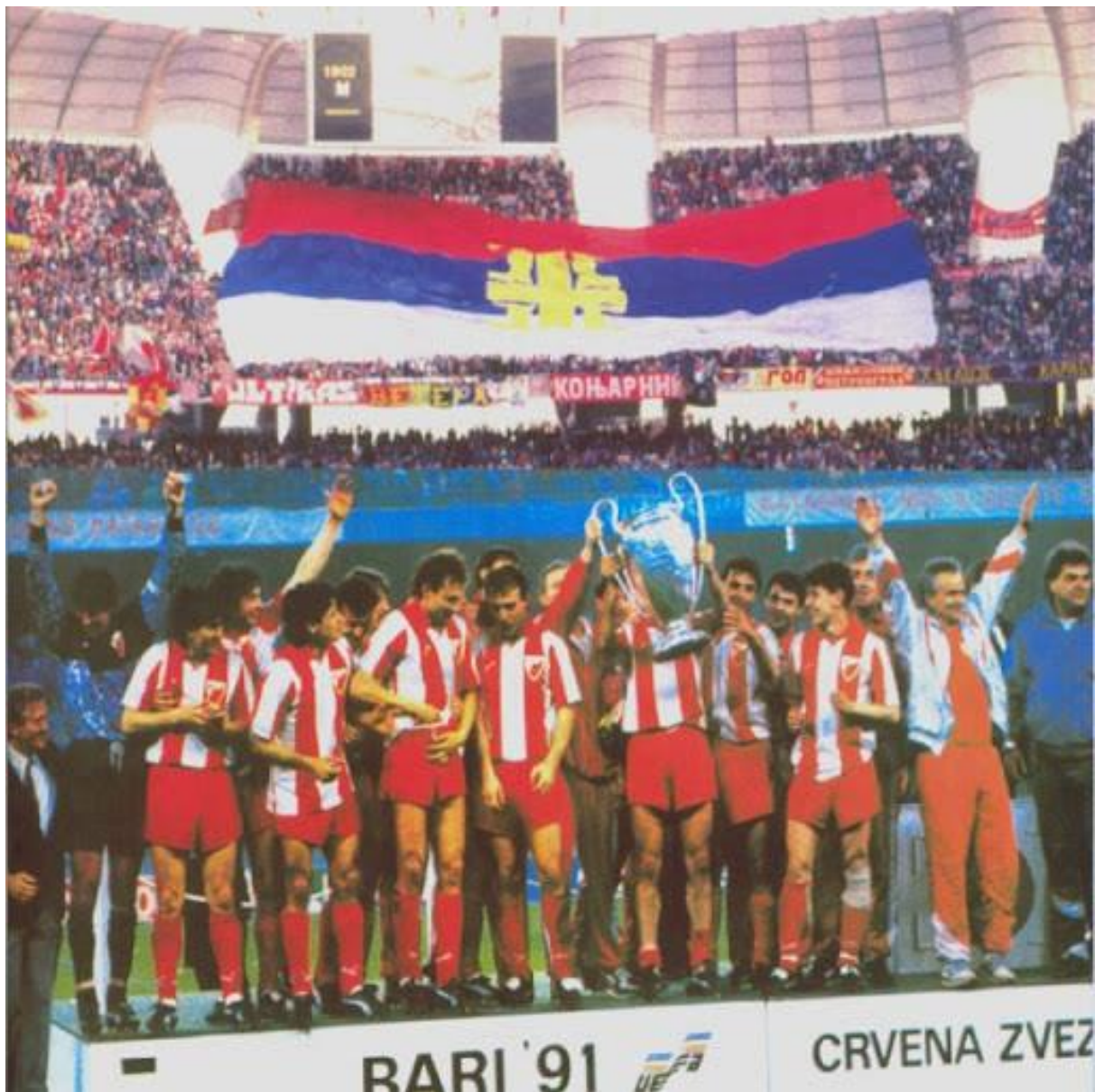
Fotografija 31. Crvena Zvezda kao simbol srpskog nacionalizma