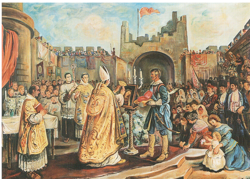
Slika 3. Krunidba Gospe 54

Obučen u bijeli plašt s bijelom mitrom počeo je pjevati himnu Veliča i izmolio molitvu iz oficija. Zatim je pokazao Priliku i na nju postavio zlatnu krunu. Obred je završen molitvom uz pjevanje Zdravo Kraljice. Brojni vjernici pratili su obred i procesiju, uz pucanje mužara i pjevanja Zdravo, morska zvijezdi. Pred crkvom nadbiskup je blagoslovio narod i sinjski kraj svetom Prilikom. 52 Zlatna kruna je veoma lijepo izrađena. Ukrašena je viticama i anđeoskim glavicama. Na njenom dnu upisano je: IN PERPETUUM CORONATA TRIUMPHAT – ANNO MDCCXV – Zauvijek okrunjena slavi – 1716. godine. 53