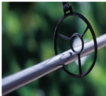
Slika 5. : Pogodak ispod središnjeg kruga, donosi jedan bod (punat) 58

Alka je željezni kolut koji se sastoji od dva koncentrična obruča. Veći obruč ima 13,17 cm promjera, a unutrašnji manji 3,51 cm. Oba su obruča spojena sa tri željezne prečke koje međuprostor dijele u tri jednaka pregratka. Željezne šipke obruča i prečki debele su 6,6 mm i imaju oštar rub sa strane s koje se gađa kopljem. 57