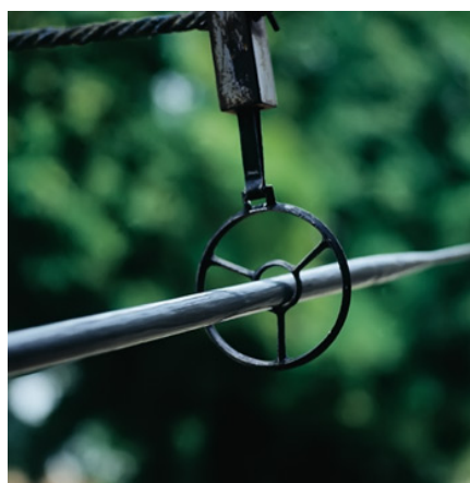
Slika 7. : Pogodak u sridu je kad koplje prođe kroz središnji krug, to alkaru donosi tri boda (punta) 60