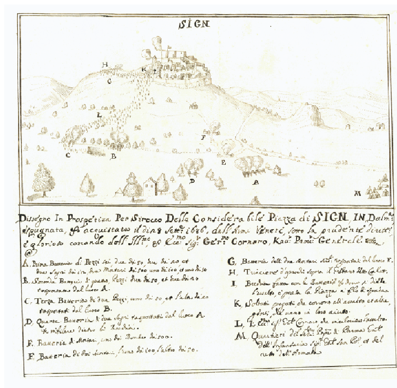
Slika 1. Prikaz osvajanja sinjskoga Grada 28. rujna godine 1686. 16

Nakon osvajanja tvrđave opći providur je neko vrijeme ostao u Sinju jer se očekivao turski protuudar. Odmah se pristupilo popravljajući zidina i kuća u tvrđavi, tako da je pod vodstvom prvog sinjskog providura Antonija Bolanija smješteno u njoj oko 150 vojnika. 15