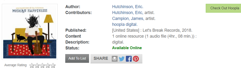
Slika 9: Sacratmento Public Library: zapis iz kataloga ( The Modern Happiness Podcasts )