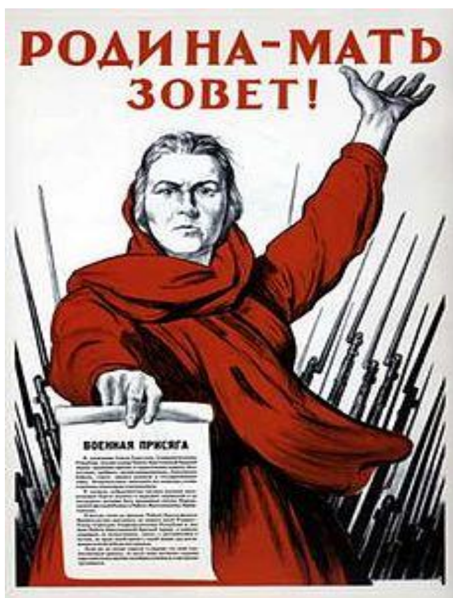
Рис. 2 Родина-мать зовет! Тоидзе, И. (1941)

В заключение следует добавить, что имеем дело с плакатом недостаточно информативного высказывания, поскольку, помимо заголовка плаката, нам не предоставляется никакой дополнительной информации, которая могла бы объяснить обстоятельства и более широкий контекст политических действий. Иными словами, женщина в руке держит военную присягу, текст которой слишком мал, чтобы предложить читателю обратить на нее внимание. По этой причине, хотя данная присяга действительно содержит дополнительный текст, объясняющий что требуется от русских солдат в этот сложный для России период, данный плакат принадлежит к группе плакатов недостаточно информативного высказывания, насыщенного символами.