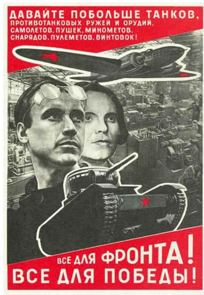
Рис. 4 Все для фронта! Все для победы! Лисицкий, Л.М. (1942)

намеренно выбрана, чтобы косвенно побудить зрителя задуматься над тем, как он способствовал благополучию своей страны.