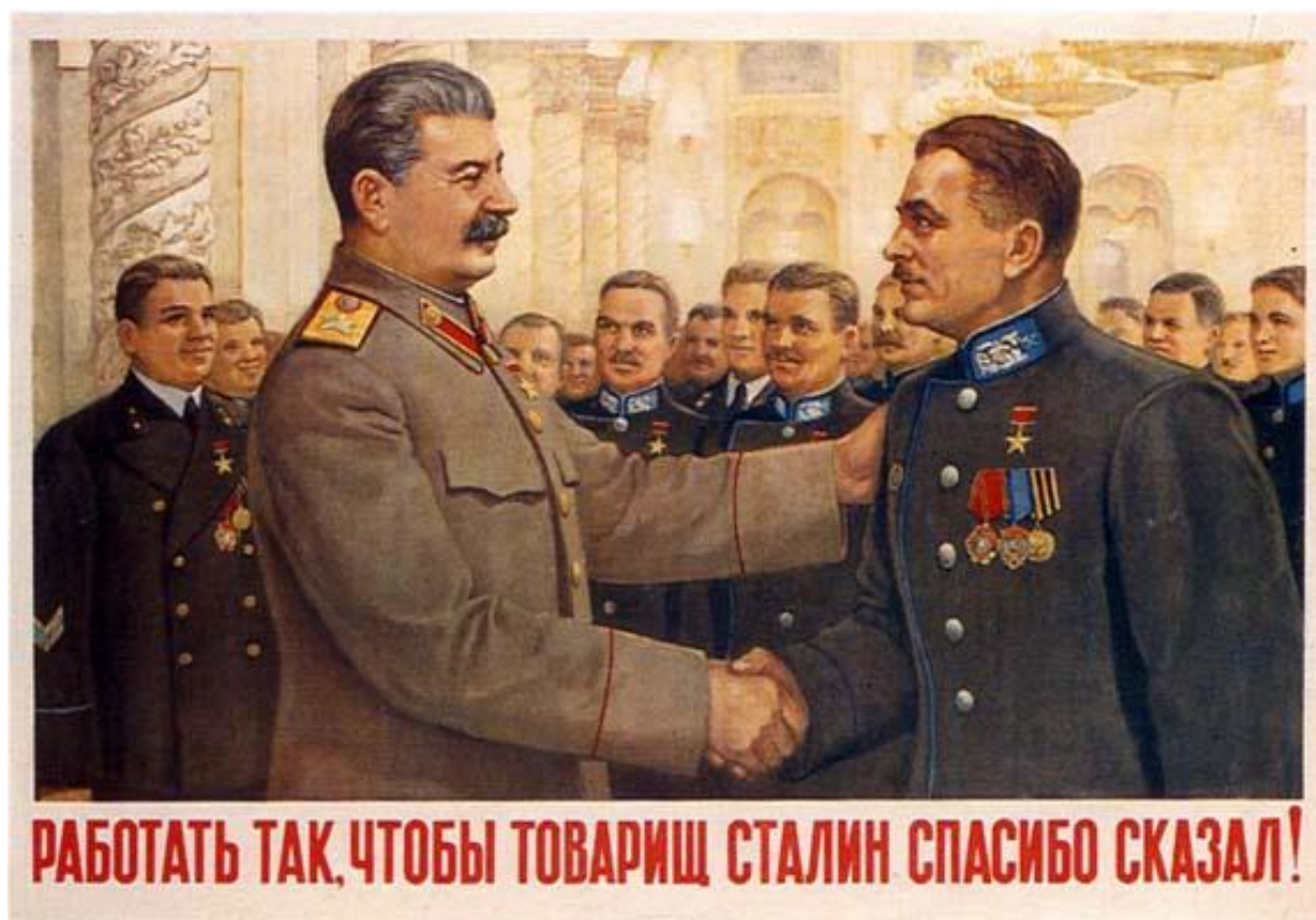
Рис. 6 Работать так, чтобы товарищ Сталин спасибо сказал! Правдин, В.Г (1949)

обстоит дело с данным плакатом; вместо «чтобы товарищ Сталин сказал спасибо» написано «чтобы товарищ Сталин спасибо сказал». Этот прием делает предложение более заметным и запоминающимся, что считается важным фактором в контексте политической пропаганды. Если порядок слов в предложении нестандартен, есть вероятность, что он «уловит» мысли наблюдателя в течение длительного периода времени.