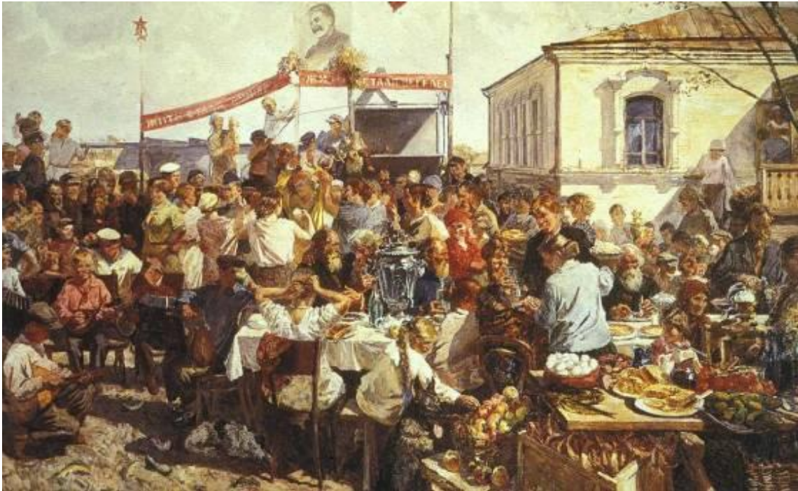
Рис. 12 Колхозный праздник. Пластов, А.А. (1937)

социализма (Терц 1957). В России основы тоталитаризма закладывались внутри авангарда, который выдвинул идею «служения искусства революции и государству». Отсюда национализация художественных фондов, средств информации, системы образования, сложение идеи партийности культуры.