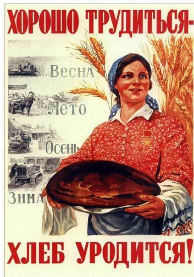
Рис. 9 Хорошо трудиться – хлеб уродиться! Соловьёв, М.М. (1947)

Как уже упоминалось в таблице в разделе 4, самые частые образы героев – «рабочие, крестьяне, молодежь, партийные лидеры и т.п.; и антигероев – капиталисты, милитаристы, а также различные шпионы и провокаторы» (Федосов 2016). Когда речь идет о героях рабочего класса в советском плакате, они послужили вдохновением для многих художников, и на эту тему есть множество плакатов. Мы выделили два: «Хорошо трудиться – хлеб уродиться!» и «Восстановим!»