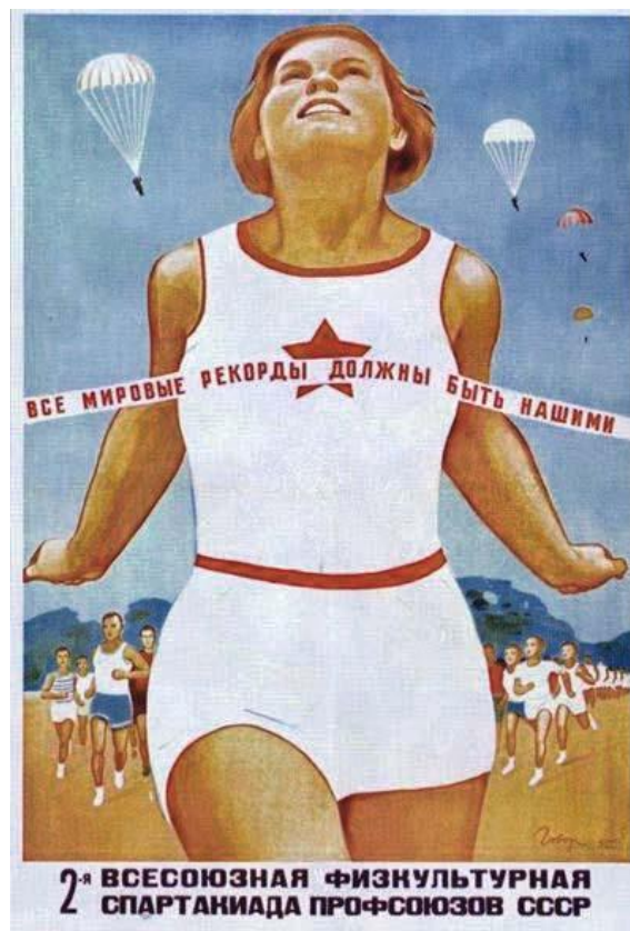
Рис. 11 Все мировые рекорды должны быть нашими! Иванович, В.Г. (1935)

В лингвистическом анализе плаката самым интересным кажется использование притяжательного местоимения «наш» здесь в творительном падеже. Иванович использовал механизм визуализации символа пятиконечной звезды, изображенного на футболке бегуни, без указания имени, на которое притяжательное местоимение относится в тексте плаката. Таким образом он связал местоимение с узнаваемым символом социалистического режима и дал понять, что местоимение фактически заменяет имя существительное «Советский Союз». Автор плаката использовал нежесткую стратегию высказывания, не прибегая к резкой или агрессивной лексике, косвенно намекая на то, что СССР заслуживает быть чемпионом всех мировых спортивных рекордов.