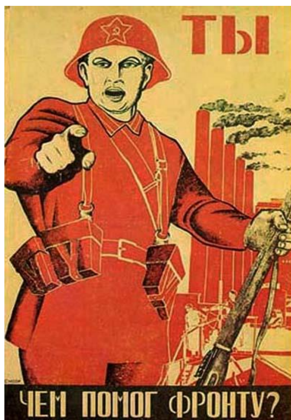
Рис. 3 Ты чем помог фронту? Стахиевич, Д. М. (1941)