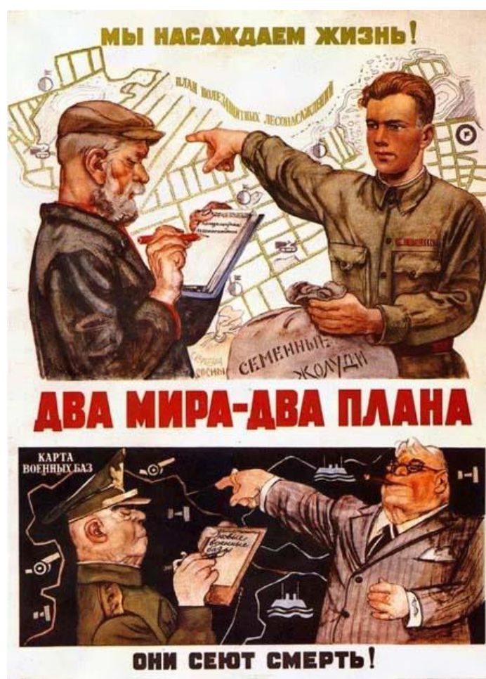
Рис. 7 Два мира – два плана. Говорков, В. (1950)

1950 году художником Виктором Говорковым. Как высказывает Фердосов (2016), «формированию патриотических чувств народов, вдохновению воинов применяли средства высмеивания врага». Этот прием значительно способствовал рождению портрета-плаката, ставшим сильнейшим орудием пропаганды. Текст плаката написан неполным/односоставным предложением, так как не содержит глагола в главном позунге. Этот тип предложения очень характерен для фразеологии и часто встречается во фразах, поговорках, фразеологизмах и т.п.