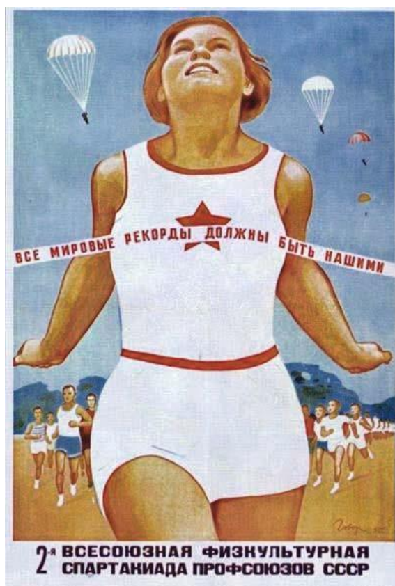
Рис. 11 Все мировые рекорды должны быть нашими! Иванович, В.Г. (1935)

В лингвистическом анализе плаката самым интересным кажется использование притяжательного местоимения «наш» здесь в творительном падеже. Иванович использовал механизм визуализации символа пятиконечной звезды, изображенного на футболке бегуни, без указания имени, на которое притяжательное местоимение относится в тексте плаката. Таким образом он связал местоимение с узнаваемым символом социалистического режима и дал понять, что местоимение фактически заменяет имя существительное «Советский Союз». Автор плаката использовал нежесткую стратегию высказывания, не прибегая к резкой или агрессивной лексике, косвенно намекая на то, что СССР заслуживает быть чемпионом всех мировых спортивных рекордов.