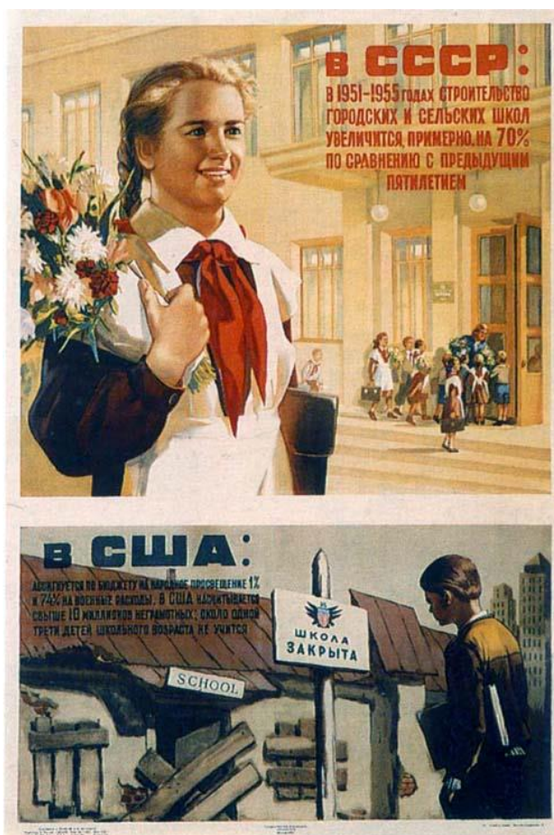
Рис. 13 Образование в СССР, в США. Корецкий, В. (1950)

США насчитывается свыше 10 миллионов неграмотных; около одной трети детей школьного возраста не учится». Советская часть плаката изображена в светлых теплых тонах и показывает веселую школьницу, идущую в школу. Американская часть наоборот изображает полуразвалившуюся мрачную и закрытую школу и школьника-мальчика, стоящего перед ней и не имеющего возможности учиться, из-за того, что 74% государственного бюджета Америки тратится на военные расходы.