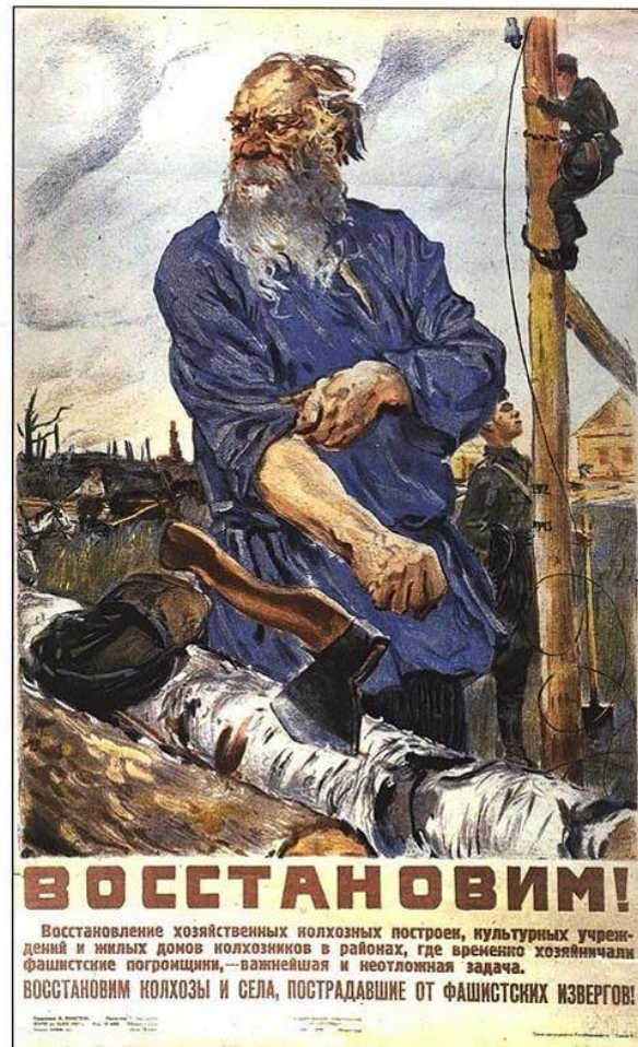
Рис. 10 Восстановим! Корецкий, В. (1947)

временно хозяйничали фашистские погромщики – важнейшая и неотложная задача. Восстановим колхозы и села, пострадавшие от фашистских извергов!».