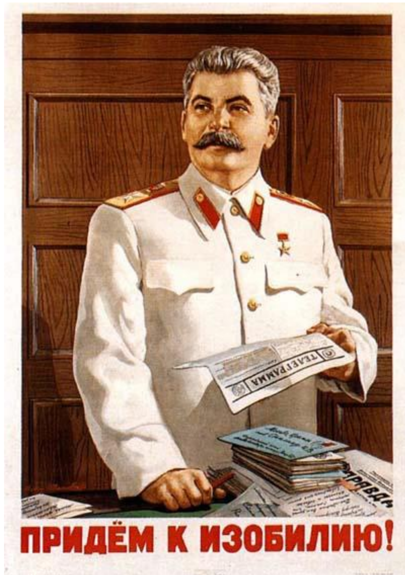
Рис. 5 Придем к изобилию! Иванов, В.С. (1949)

в контексте этого призыва объединяются люди самых различных слоев общества, военные и гражданское население, мужчины и женщины, независимо от возраста и происхождения.