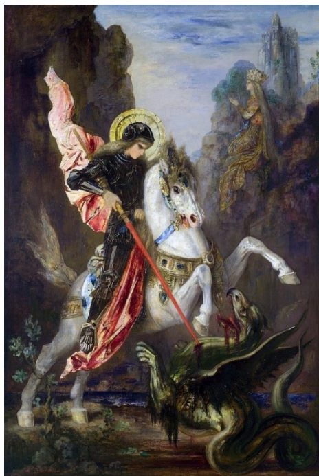
Slika 2. Sv. Juraj i zmaj, autor: Gustave Moreau

Brak se sklapa na Ivanje, trenutak u kojem Juraj postaje u narodnoj predaji Ivan kojeg ubijaju zbog bračne nevjere, a ljupka Mara postaje okrutna Morana koja umire pred kraj godine, kada priča ciklički počinje ispočetka. Dolaskom pred zlatna vrata Perunova dvora na Zemlji, prije nego će Juraj zaprositi Maru, predaje joj ključeve Velesovog mitskog svijeta Vireja „... kako bi se spajanjem dvaju principa – vlažnosti podzemlja i sunca gornjeg svijeta – dobio temelj plodnosti “ (Vukelić 2012:16).