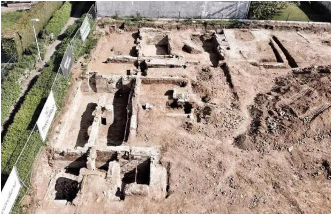
Slika 1. Dio rovova na poziciji Wijtschate

satova i hrane koju su vojnici dobivali od kuće. 28 Uz sve ovo pronađeni su i savršeno očuvani rovovi, stupovi koji su držali bodljikavu žicu te čak i cijeli njemački reflektor koji je osvjetljavao ničiju zemlju. Svaki rov, krater od bombe i topografska promjena zabilježeni su arheološki i dokumentirani su za buduće generacije. 29 No ipak, ovaj savršeni primjer iskapanja imao je i jedan problem, a to je da je jedini način za dobivanje financija bio donacijama putem crowdfunding -a. 30