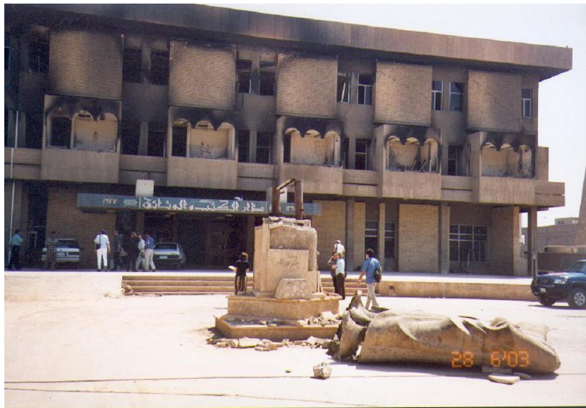
Slika 2. Nacionalna knjižnica Iraka

Po nekim procjenama uništeno je 25% knjiga iz Nacionalne knjižnice (Al-Tikriti, 2007). Uništeno je 500 000 knjiga i serijskih publikacija, uključujući 5000 rijetkih knjiga (K., 2003). Prema procjeni Báeza (2008), iz knjižnice je nestalo oko milijun knjiga. Točne procjene nestalih knjiga iz iračkih knjižnica su teško moguće zbog nepotpunih kataloga (Kam, 2004).