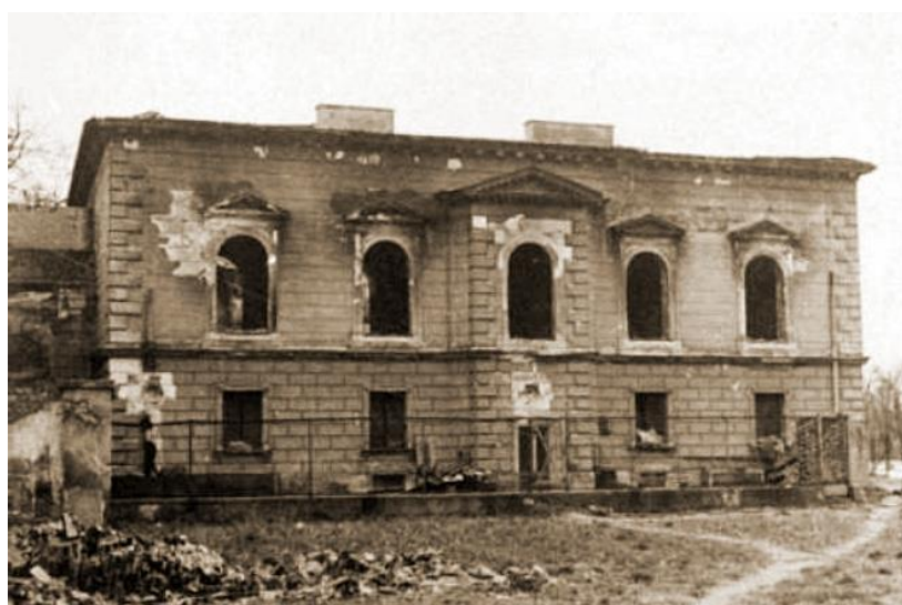
Slika 2. Knjižnica Zamoyski

Gubitci za Poljsku su bili neprocjenjivi. Tijekom rata je uništeno 70% knjiga. Od 22 500 000 svezaka koji su se prije rata nalazili u narodnim knjižnicama, samo je 7 500 000 preživjelo (Borin, 1993). Po nekim procjenama uništeno je 90% zbirki školskih i narodnih knjižnica. Sveučilišna knjižnica u Varšavi imala je gubitak od milijun knjiga, a Varšavska gradska knjižnica imala je gubitak od 300 000 knjiga koje su zapaljane u noći evakuacije (Knuth, 2006).