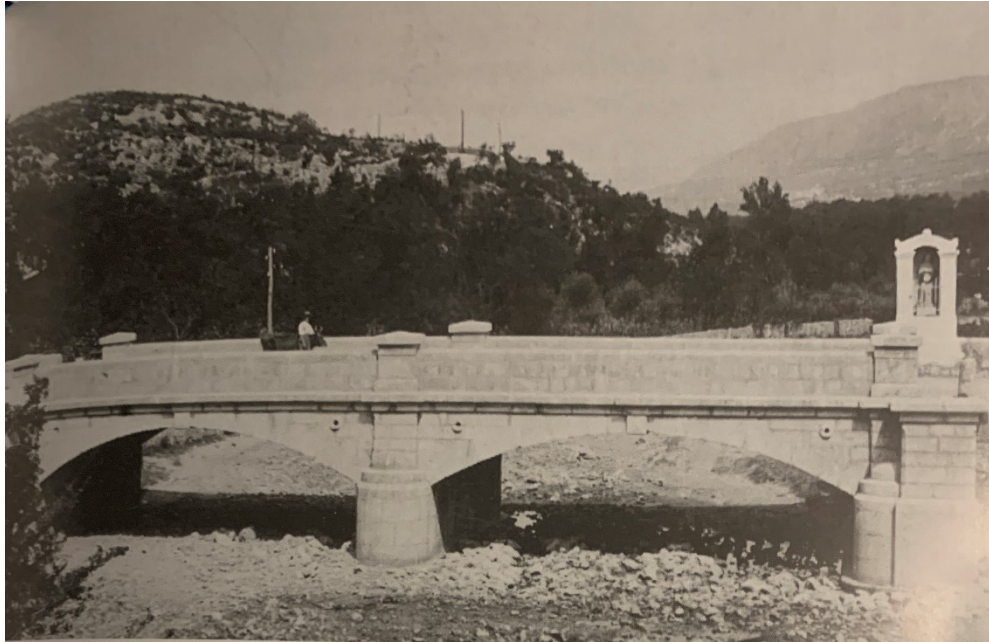
Slika 27. Neznani fotograf, Kip. sv. Ivana Nepomuka na mostu preko Ričine, prije 1943. godine