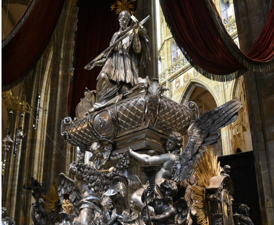
Slika 2. Joseph Emanuel Fischer von Erlach, Johann Joseph Würth, Antonio Corradini, Oltar i grobnica sv. Ivana Nepomuka, 1736., Katedrala sv. Vida, Prag

Postoje i drugi atributi koji se pojavljuju uz lik sv. Ivana Nepomuka. Jedan od čeških atributa koji je pojavljuje uz sv. Ivana Nepomuka jest most kao atribut neposredno vezan uz svečevu mučeničku smrt. Most kao atribut sv. Ivana Nepomuka javlja se prvenstveno u slikarstvu a rjeđe u drvenoj skulpturi. 72 U javnim skulpturama on izostaje jer se javne skulpture sv. Ivana Nepomuka najčešće postavljaju na most ili u blizinu mosta te „tako postaju atribut posuđen iz stvarnosti“. 73 Rijetko se pojavljuju atributi lopoča koji simbolizira utapanje 74 te odrezanog jezika kao simbola ispovjedne tajne koju sv. Ivan Nepomuk nije htio odati. 75 Kao Ivanov atribut spominje se i sidro. 76