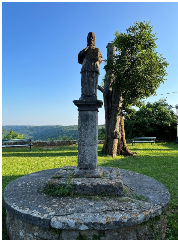
Slika 4. Neznani autor, Kip sv. Ivana Nepomuka, 1805. godina

Kip sv. Ivana Nepomuka datira se u 1805. godinu prema kronogramu uklesanom na prednjoj strani postamenta. Postament na kojem stoji skulptura započinje i završava impostima. Sve četiri strane postamenta ukrašene su jednostavnim urezanim pravokutnim okvirom. Gornji kutovi okvira konkavno su uvučeni (odsječeni). Okvir je iznutra grublje i izraženije teksture nego vanjski dio postamenta koji se nalazi izvan okvira te koji je gladak. S prednje strane na postamentu se nalazi vitičasti okvir ovalnog oblika u kojem piše: IN HONOREM? / IOANNIS? / NEPOMUCENI / PIETATE / BENEFACTORUM / ANNO / MDCCCXV. Dio natpisa je nečitljiv, ali prijevod teksta koji je vidljiv i može se pročitati, uz pretpostavljanje ostatka teksta, glasio bi sljedeće: U ČAST / IVANA / NEPOMUKA / POBOŽNOŠĆU / DOBROČINITELJA / GODINE / 1805.