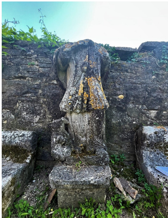
Slika 7. Neznani kipar, Kip sv. Ivana Nepomuka, Pazin

Uz desnu nogu sveca nalazi se mali anđeo u lošem stanju. Anđeo je izlizan i oštećen do neprepoznatljivosti, pa se može identificirati zahvaljujući tome što je riječ o jednom od češćih ikonografskih motiva prikazanih uz skulpturu sv. Ivana Nepomuka. Također, mali anđeo koji se pojavljuje uz nogu sv. Ivana Nepomuka čest je motiv na području unutrašnjosti Istre i kao takav može se vidjeti na primjerima u Gračišću i Pićnu.