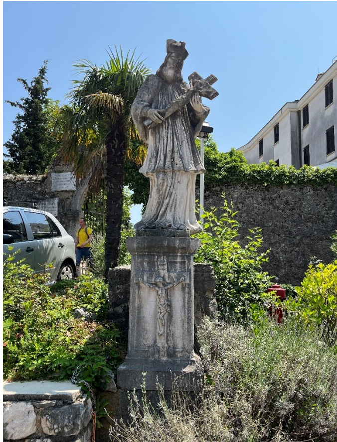
Slika 24. Neznani kipar, Kip sv. Ivana Nepomuka, 1735. godina

u visini rebara, vidljiva je udubina ovalnog oblika koja se ističe među gustim, okomitim naborima svečeve rokete. Udubljenje je djelomično zakriveno raspelom pa je manje primjetno.