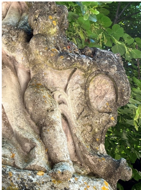
Slika 10. Neznani kipar, Mali anđeo uz nogu sv. Ivana Nepomuka, 1741. godina

Skulptura sv. Ivana Nepomuka sačuvana je u dosta dobrom stanju što omogućava dobro razabiranje pojedinih dijelova, iako je očito da je skulptura već dugo izložena vremenskim (ne)prilikama. Svečev je lik obrađen sa svih strana podjednako vješto, voluminozno i detaljno te to potvrđuje da je skulptura izvorno bila namjenjena javnom prostoru u kojem će se kip moći promatrati iz brojnih različitih kutova.