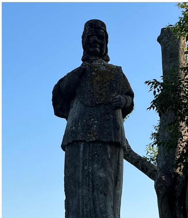
Slika 6. Naknadno isklesana glava sveca