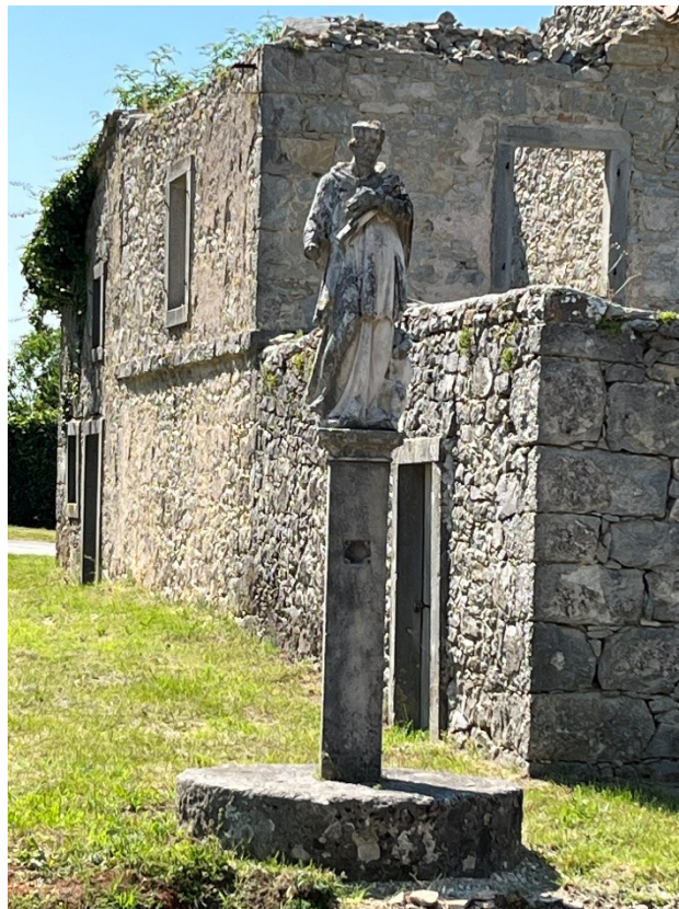
Slika 9. Neznani kipar (radionica Antonija Michelazzija?), Kip sv. Ivana Nepomuka, 1778. godina

Svečev kip odlikuje vješto klesana odjeća, stav i detalji, te uvjerljiva deskripcija lica sv. Ivana Nepomuka. Usto, o dobro razvijenim vještinama kipara koji ga je isklesao govori i skladan dojam cjeline koji skulptura ostavlja na promatrača.