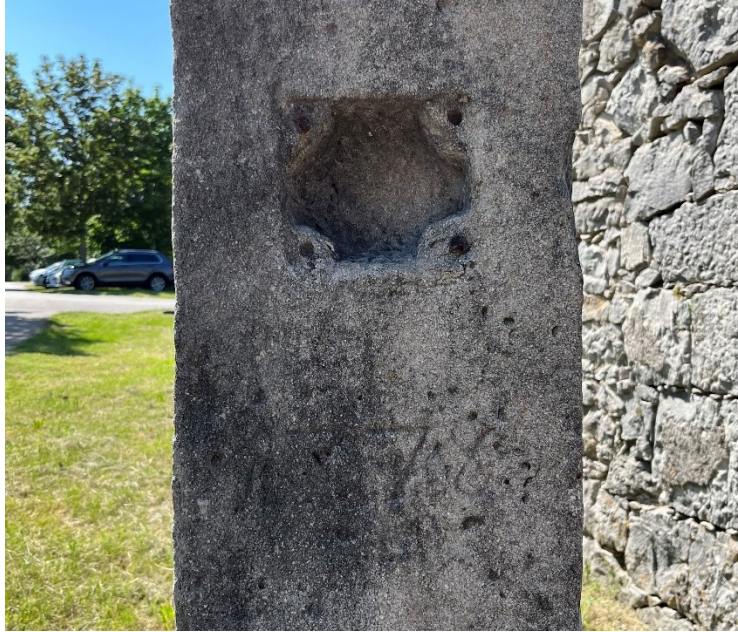
Slika 8. Postament skulpture s uklesanom godinom i malenom nišom

Skulptura sv. Ivana Nepomuka postavljena je na visoki postament koji završava impostom. Postament je usađen u veće kameno postolje kružnog oblika. Na postamentu je sa prednje strane uklesana godina kojom se skulptura datira. Iznad godine nalazi se maleno pravokutno udubljenje u kojem se nešto moglo pohraniti. Niša u kutovima ima rupe koje ukazuju ranije postojanje šarki koje su omogućavale da se mala niša zatvori.