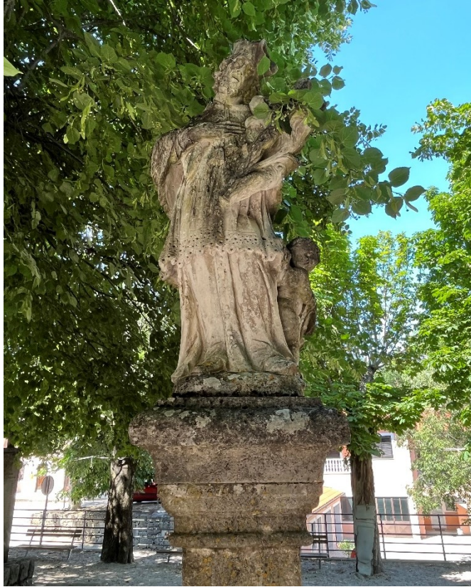
Slika 11. Neznani kipar, Kip sv. Ivana Nepomuka, 1741. godina