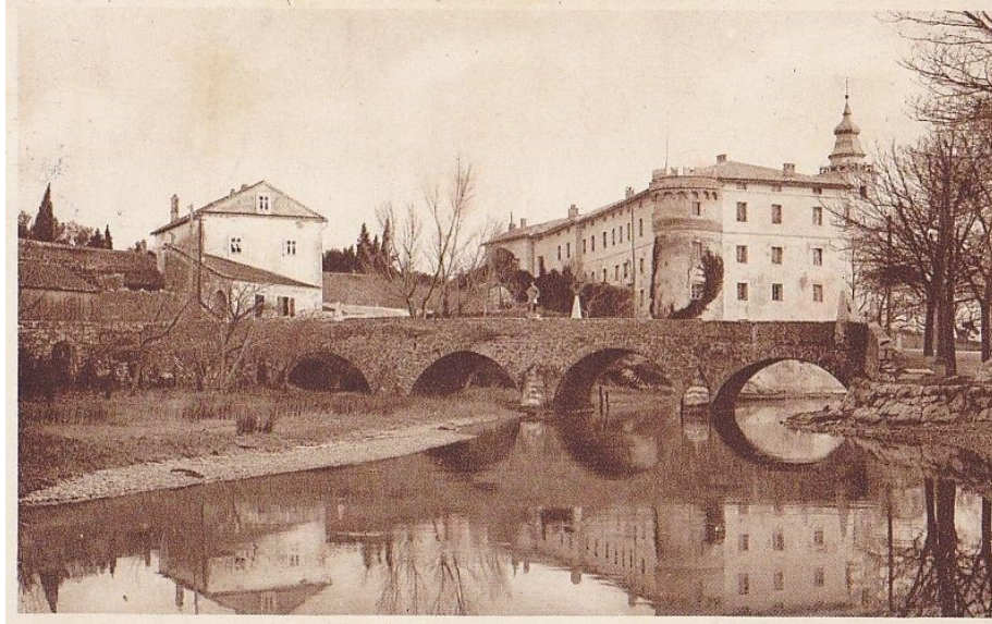
Slika 21. Most preko Dubračine s vidljivim kipom sv. Ivana Nepomuka i kamenim piramidama, kraj XIX./početak XX. stoljeća

S vremenom most iz XIX. stoljeća nije mogao više podnijeti sve veći promet, te je 1938. godine izgrađen novi, veći trolučni most. 175 Prilikom povlačenja njemačkih okupacijskih snaga 16. travnja 1945. godine novi je most srušen, a nakon završetka Drugog svjetskog rata, most je ponovno izgrađen te i danas stoji na istom mjestu. 176