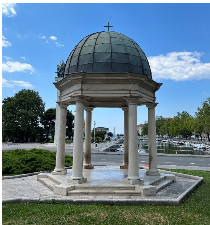
Slika 14. Kopija kapele sv. Ivana Nepomuka danas