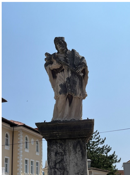
Slika 19. Neznani kipar, Kip sv. Ivana Nepomuka, prije 1804. godine

jednostavniji uzorak čipke, no kvalitetno su isklesani te su izbušeni kako bi se dao dojam većeg volumena. Usto, jasno su vidljivi zahvaljujući dobrom stanju u kojem se skulptura nalazi. Krajevi rukava rokete također su ukrašeni dekorativnim čipkastim porubom. S prednje i stražnje strane lika sv. Ivana Nepomuka moceta imitira teksturu krzna hermelina. Svetac oko vrata nosi ogrlicu s okruglim privjeskom. Raspelo u rukama svetac pridržava s obje ruke, a lijevom rukom uz sebe prislanja i palminu granu. Na desnoj ruci kipu nedostaje mali prst. Lice sv. Ivana Nepomuka je bradato, a svetac ne gleda u raspelo već prema naprijed, u daljinu. Kip je previsoko smješten da bi se reklo da gleda u promatrača. Izraz lica mu nije spokojan, već se čini zamišljen, a zbog lagano otvorenih usta možda i zabrinut ili uznemiren. Stražnja strana kipa je plosnatija, te na donjoj polovici obrada nije kao s drugih strana već je malo grublja. Na gornjem dijelu leđa pri ramenima sv. Ivan Nepomuk ima tri rupe koje su mogle služiti da se skulptura pričvrsti uz zid ili na neku oblogu. Stoga bi se njima mogla poduprijeti tvrdnja Ive Marochina da je kip nekada bio smješten u crkvi sv. Margarete na oltaru.