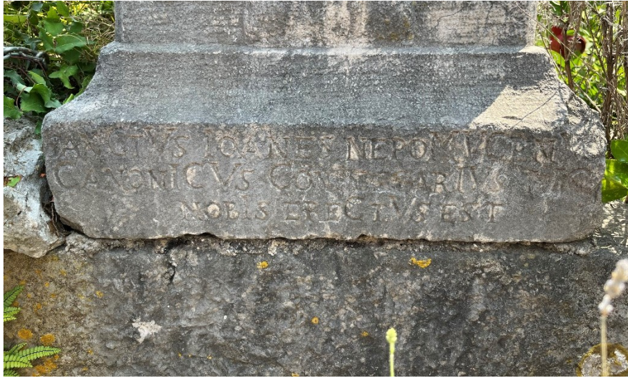
Slika 22. Natpis na postamentu