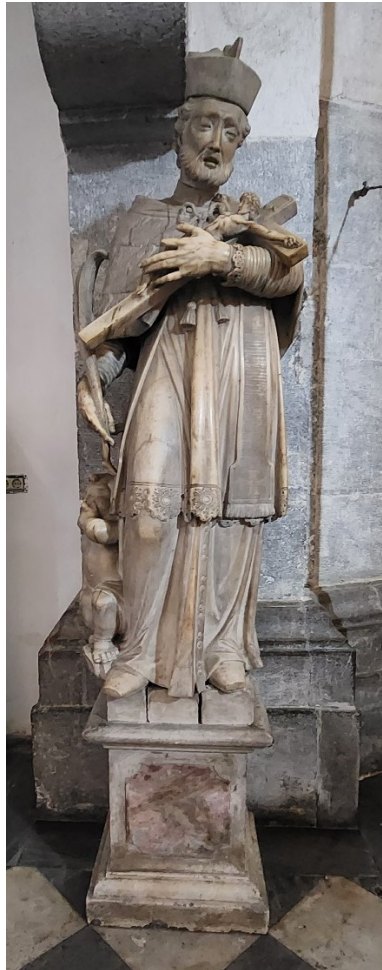
Slika 17. Neznani kipar, Kip sv. Ivana Nepomuka, crkva Uznesenja Blažene Djevice Marije, Rijeka

Iako se u izvorima navodi da je na postamentu kipa iz kapele stajao uklesani natpis s datacijom i imenom čovjeka koji je financirao izradu skulpture, na postamentu na kojem ovaj kip stoji nema nikakvih natpisa, dok se trsatski kip ne nalazi na izvornom postamentu nego na postamentu novije izrade, najvjerojatnije napravljenome kada je kip sv. Ivana Nepomuka postavljen na Trsat.