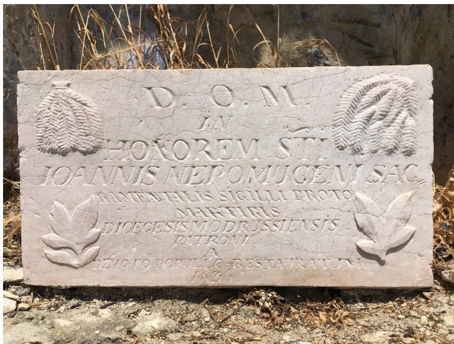
Slika 26. Kameni blok s mosta s natpisom posvećenim sv. Ivanu Nepomuku

Na kamenom bloku uz tekst prikazana su i četiri lista, dva palmina lista gore, a dolje dva lista neke druge biljke, moguće stiliziranog akanta. Kameni je blok bio dio tog javnog spomenika te je vjerojatno imao funkciju postolja za kip budući da su most i nova kapelica u koju je premješten sagrađeni tek 1863. godine.