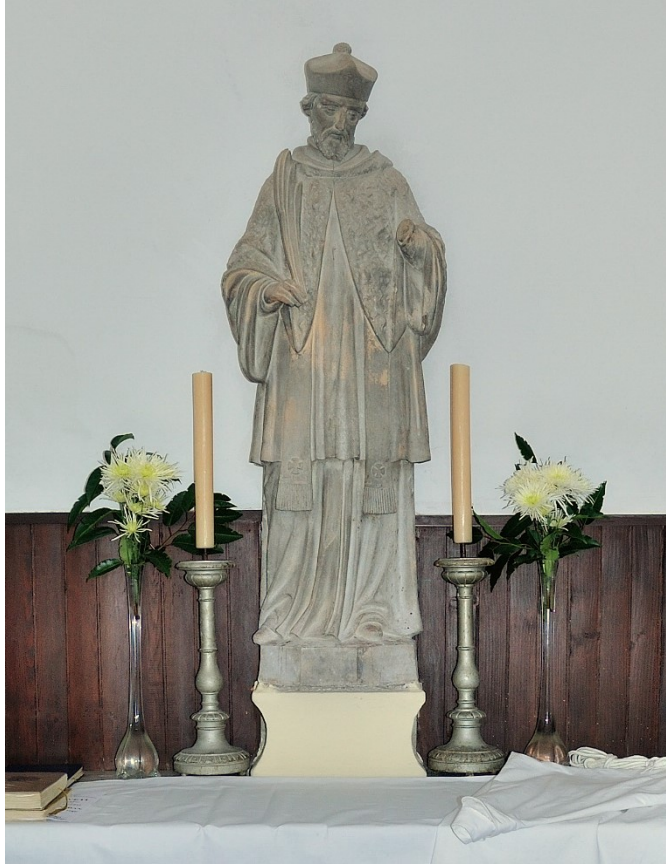
Slika 25. Neznani kipar, Kip sv. Ivana Nepomuka u grobljanskoj kapeli, 1930. godina