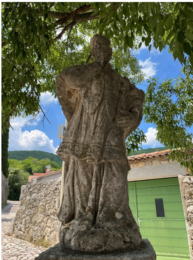
Slika 12. Neznani kipar, Kip sv. Ivana Nepomuka, 1717. godina

Skulptura sv. Ivana Nepomuka dobro je očuvana ali je primjetno da je dulje vrijeme provela vani na raznim vremenskim (ne)prilikama. No, većina detalja je dobro očuvana i oni omogućuju jasnu i jednostavnu identifikaciju prikazanog sveca. Ovaj prikaz sv. Ivana Nepomuka kontemplativna je figura, ali ostvaruje vezu s promatračem, jer ga intimno podučava u vjerskom zanosu, poput tridentskih pedagoga koji to čine zorno i – što je najupečatljivije – vlastitim primjerom.