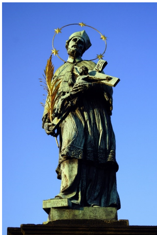
Slika 1. Jan Brokoff, Kip sv. Ivana Nepomuka, 1683., Karlov most, Prag