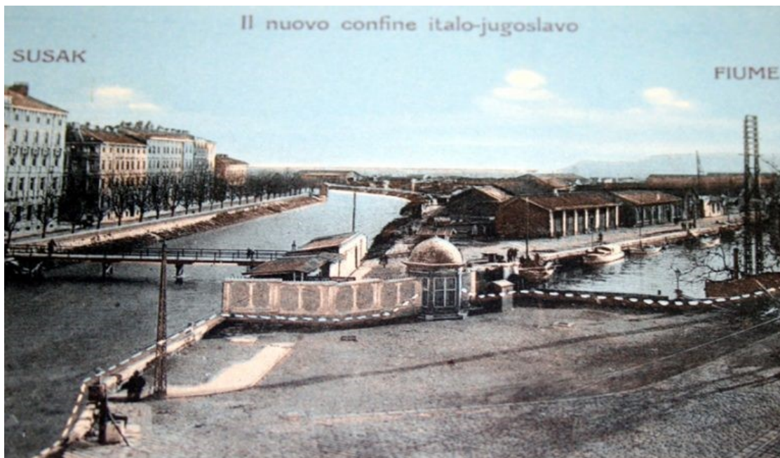
Slika 13. Granica Sušak – Rijeka, 1925. godina