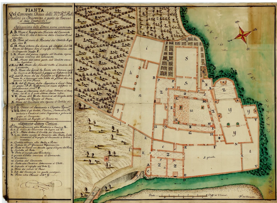
Slika 20. Felice Stefano de Verneda, Tlocrt crikveničkog samostana, 1756. godina

Izvorni kameni kip sv. Ivana Nepomuka isprva je bio postavljen nedaleko od mosta preko Dubračine, 166 a u prvoj polovici XIX. stoljeća skulptura se premjestila na sredinu novo izgrađenog mosta. 167