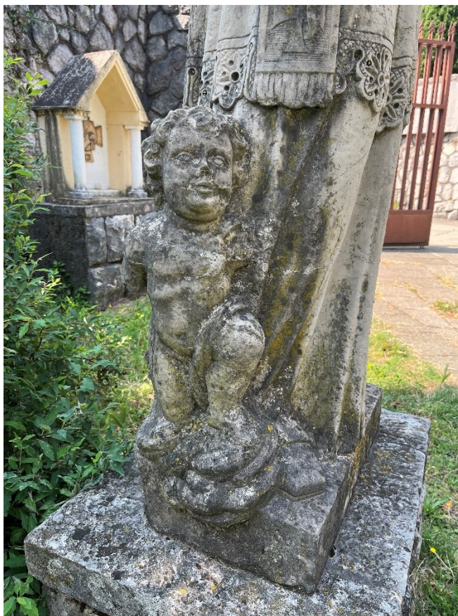
Slika 16. Neznani kipar, Andeo uz nogu sv. Ivana Nepomuka, Trsat