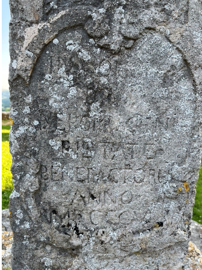
Slika 5. Uklesani natpis na prednjoj strani postamenta kipa sv. Ivana Nepomuka

Lik sveca odjeven je u svoju uobičajenu odoru baroknog ispovjednika. Preko reverende s pucetima, sv. Ivan Nepomuk nosi roketu koja je na donjim rubovima i krajevima rukava ukrašena dekorativnim porubom geometrijskog uzorka. Na vrhu svetac ima mocetu koja uzorkom i teksturom jasno naznačuje da oponaša hermelinovo krzno. U lijevoj ruci svetac drži palminu granu, a desna šaka nije sačuvana. Pretpostavljam da je sv. Ivan Nepomuk u desnoj ruci držao ikonografski motiv koji ga najčešće prati: raspelo kojega danas nema. Nabori draperije su vrlo blago izraženi.