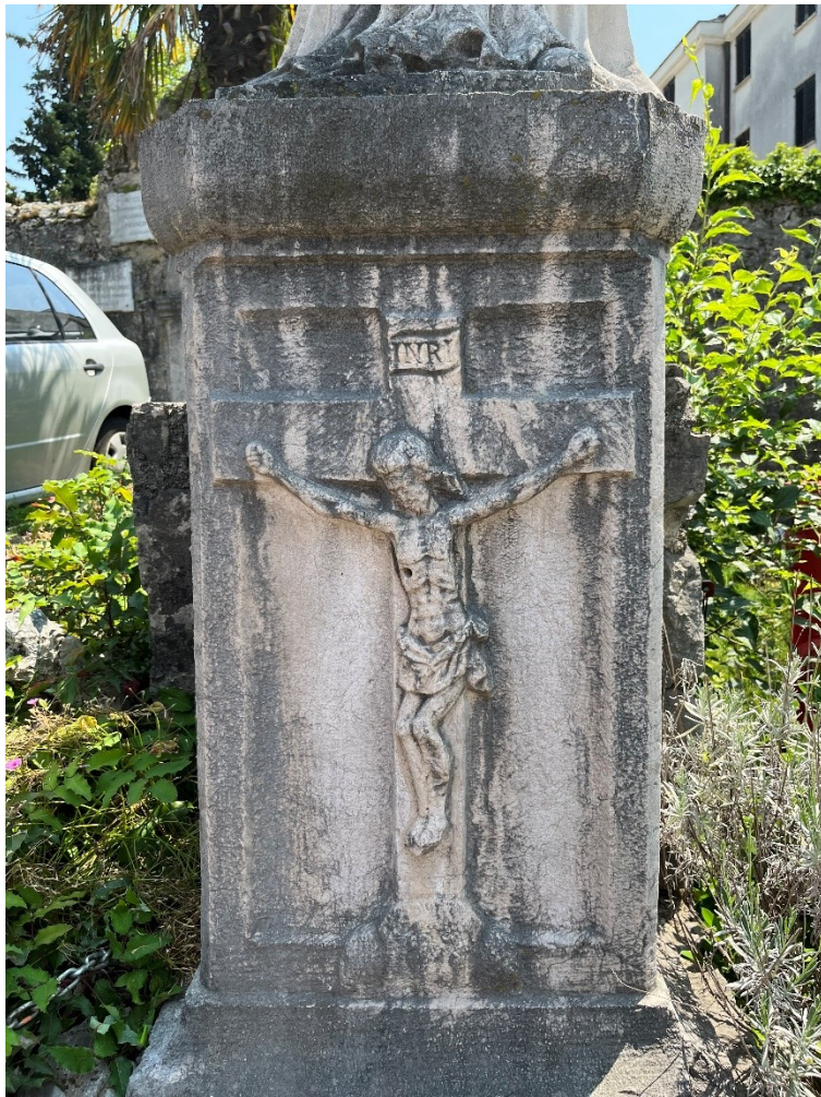
Slika 23. Reljef raspetoga Krista na postamentu