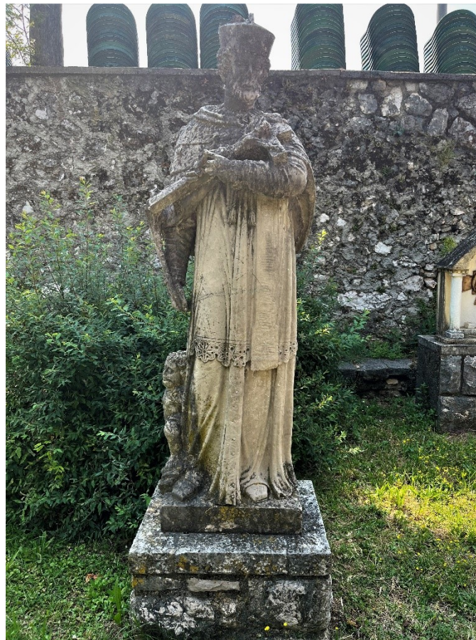
Slika 15. Neznani kipar, Kip sv. Ivana Nepomuka, Trsat

Sveukupna izrada kipa i detalji obrade govore o vještini kipara koji je izradio skulpturu sv. Ivana Nepomuka. Čipka na rubovima rokete posebno je detaljno izvedena. Riječ je o minuciozno isklesanom porubu sa preciznim i kompliciranim uzorkom: cvijet od šest latica na podlozi romboidnog uzorka smješten je u sredini okvira koji na dnu završava sa tri zaobljena vrha. Između latica svakog cvijeta i u njegovom središtu te između svakog okvira poruba rokete izbušena je rupa svrdlom radi stvaranja dodatnog dojma volumena na inače plošnom porubu. Osim čipke, nabori te detalji na stoli i na raspelu također jasno ilustriraju umijeće autora skulpture koja se nalazi na Trsatu.