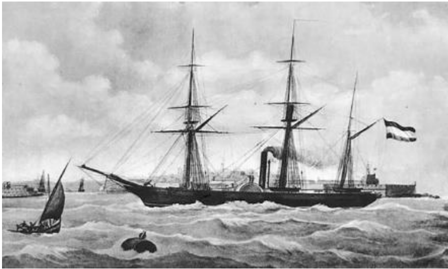
Slika 9 - prikaz broda Kanko Maru

ali je 1855. godine poklonjen Japanu kao simbol dobrih odnosa te je preimenovan u Kanko Maru . Parobrod je poklonjen Japanu u periodu japanskog otvaranja prema zapadnim zemljama u svrhu očuvanja nizozemsko-japanskih odnosa jer su i sami Nizozemci shvatili da će otvaranjem granica imati jaku konkurenciju na japanskom području. Brod je služio za obuku mornara do kraja Meiji revolucije nakon koje je prešao u službu japanske imperijalne mornarice i u konačnici je maknut iz uporabe 1876. godine. (usp. Klos i Derksen 2016: 49-55)