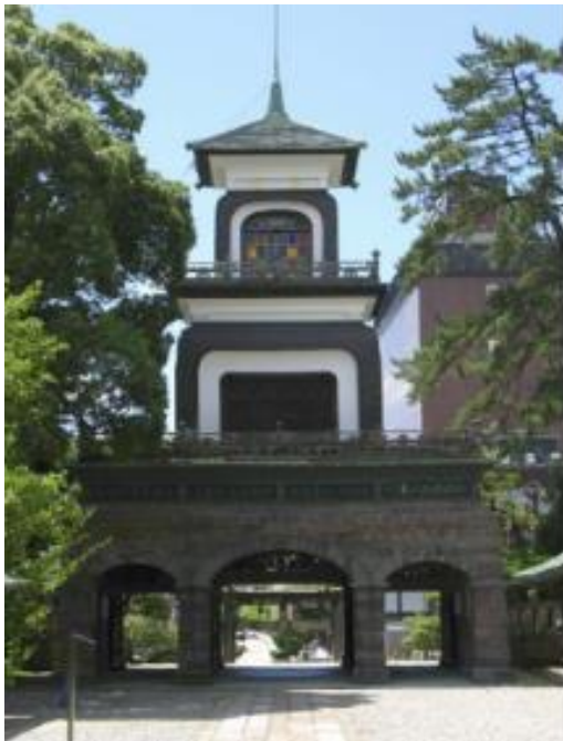
Slika 10 - vrata svetišta Oyama

japanskog i europskog stila, a dizajnirao ih je nizozemski arhitekt H. Holtman, a vrata su ukrašena posebnim nizozemskim vitrajem 50 te su služila kao svjetionik japanskim brodovima i smatra se da je to prvi poznati svjetionik u Japanu (usp. ibid. : 57- 63).