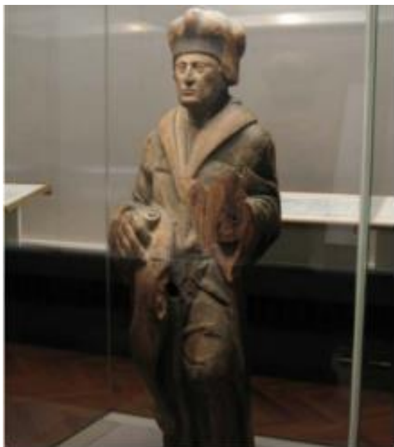
Slika 5 - drvena skulptura Erasmusa

Ostavština ovog vremenskog razdoblja izuzetno je oskudna i većinski se odnosi na spomen preživjelih mornara s broda Liefde u obliku imena ulica, lokacija, spomenika ili samo kroz spomen imena u raznoj arhivskoj dokumentaciji. U kategoriji arhitektonske ostavštine nažalost zasad nije pronađeno ništa iz ovog razdoblja. Od pomorske ostavštine također nije ostalo mnogo materijalne baštine s obzirom na to da je sam brod Liefde bio izgubljen u tajfunu Uraga i ostaci nisu pronađeni, a ideje projekata i programa za istraživanje i pronalazak broda i njegovih ostataka još uvijek su samo u razradi bez konkretnih akcija. Od spomenute dokumentacije koja bilježi imena i pojedine događaje ovog razdoblja, u muzeju se od materijalnih predmeta nalazi samo drvena skulptura koja je bila dio broda Liefde , ali nije zabilježeno kada i zašto je sama skulptura bila s broda. Kroz provjeru s nizozemskim stručnjacima, potvrđeno je da skulptura predstavlja Erasmusa, poznatog nizozemskog učenjaka i humanista, a skulptura se danas čuva u Nacionalnom muzeju u Tokiju (usp. ibid. : 17-19).