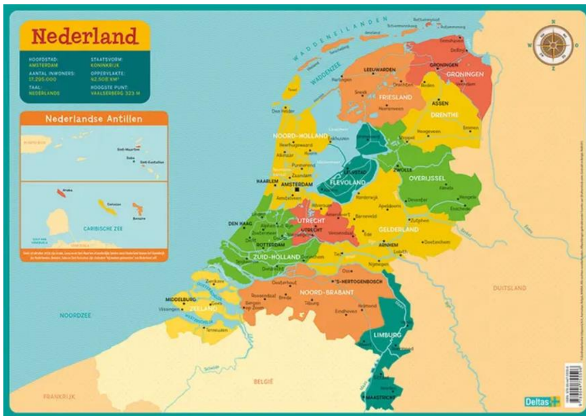
Slika 1 - Karta Nizozemske s provincijama i susjednim zemljama

Na 41 543 km 2 , Nizozemska, prema popisu iz 2023. godine, ima oko 17 975 000 stanovnika, što je otprilike 432.7 stanovnika po metru kvadratnom i čini ovu zemlju poprilično gusto naseljenom. Službene religije nema, a službeni jezik je nizozemski, a od 20. lipnja 2013. status službenog jezika u Nizozemskoj dobio je i frizijjski (usp. Britannica- Netherlands 2 ).