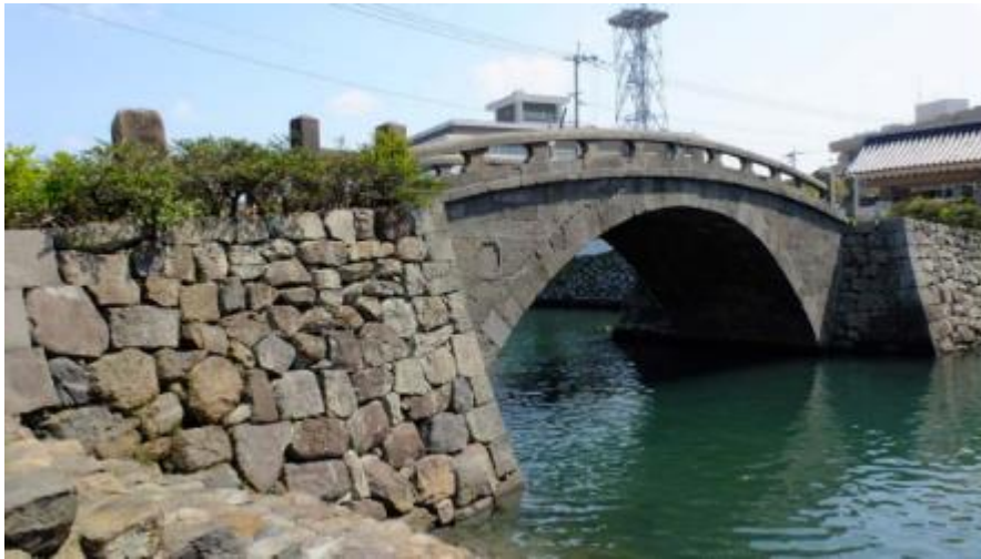
Slika 7 - Saiwai bashi/Oranda bashi

nizozemsko brodsko pristanište. Kameni most Saiwai bashi (jap. 幸橋 45 ), Most sreće, još poznat i kao Nizozemski most, odnosno, Oranda bashi (jap. オランダ橋) prvi je kameni most u Japanu koji je izgrađen građevinskim tehnikama koje su došle iz Europe te se pretpostavlja da je most djelomično izgrađen kamenom koji je uzet iz srušenih nizozemskih kamenih skladišta, ali to nije u potpunosti potvrđeno kao istinito (usp. ibid: 25-27).