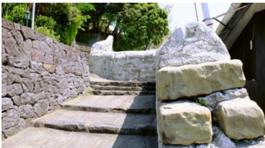
Slika 6 - Oranda hei

Kao što je spomenuto u dijelu pregleda povijesti nizozemsko-japanske trgovine, Nizozemci u ovom razdoblju grade spremišta i druge građevine prateći razvoj trgovinskih odnosa s Japanom. Iz tog razloga, nije iznenađujuće da iz ovog perioda, za razliku od prethodnog, postoje arhitektonski ostaci koji su očuvani i nalaze se iznad ili u zemlji, a većina arhitekturne ostavštine nalazi se na sjevernom dijelu zaljeva Hirado. Jedan od njih je Oranda hei (jap. オランダ塀 40 塀 41 ), u prijevodu Nizozemski zid, kamena je konstrukcija približne dužine 30 i visine 2 metra koja je jednim dijelom odvojena i dio nekadašnje nizozemske rezidencije u Hiradou (usp. ibid: 24).