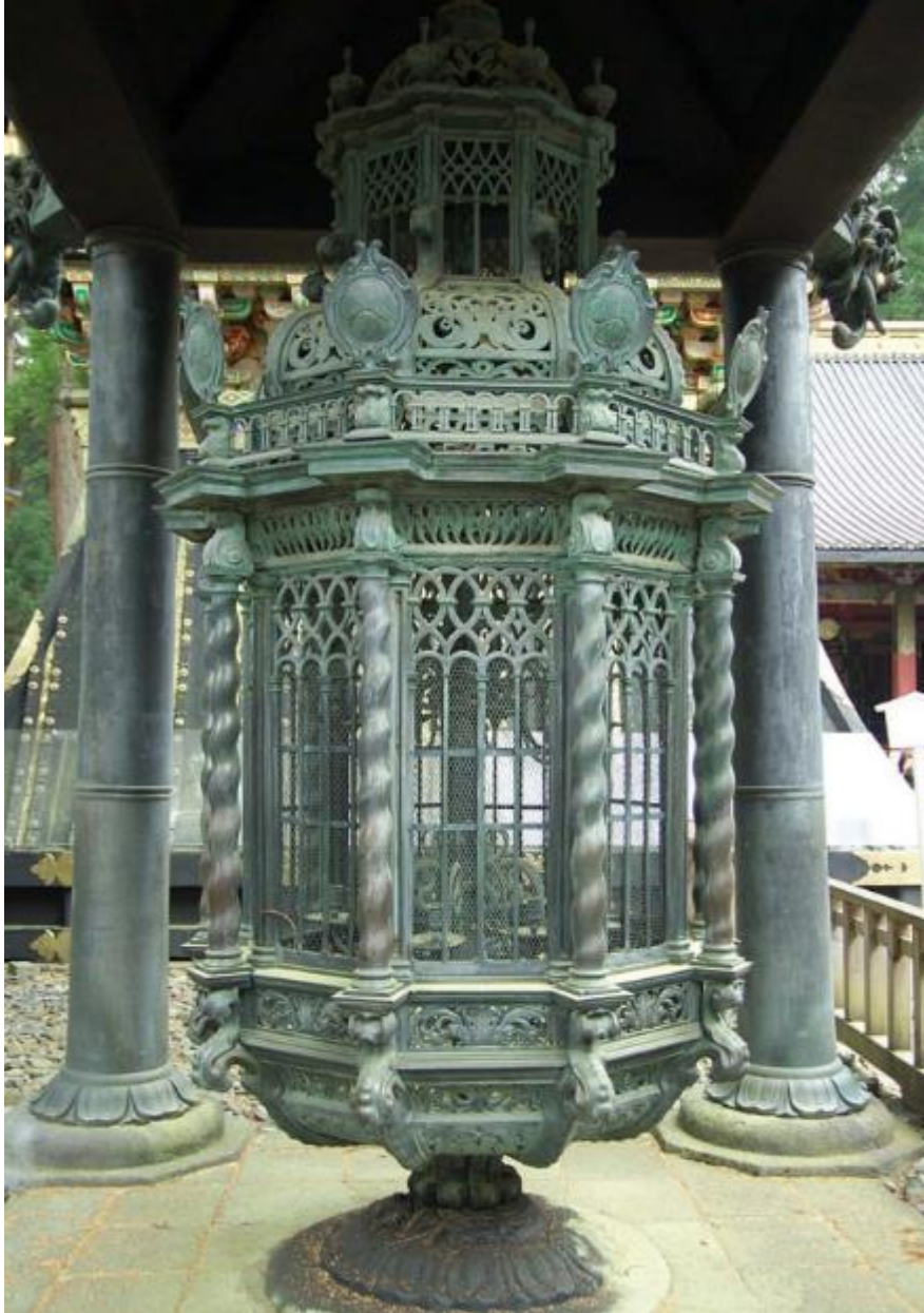
Slika 8 - brončani kandelabar

Nagasaki. Također, razni manji predmeti, umjetnine i dokumenti ovog razdoblja čuvaju se u muzejima i restauracijskim institucijama, pa je u navedenima moguće pronaći porculanskog posuđa, namještaj, ručno oružje, svijećnjake, umjetničke slike, rječnike i druge predmete ovog razdoblja (usp. ibid : 37-45).