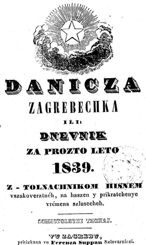
Slika 5. Naslova stranica Danice iz 1839.