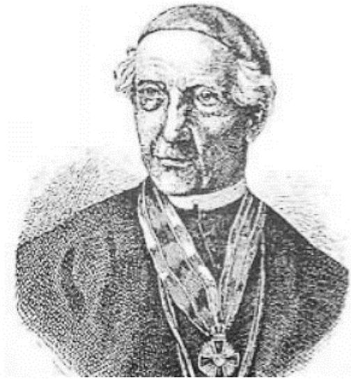
Slika 6. Portret Ignaca Kristijanovića

svećenik u zagrebačkome sjemeništu. Od 1834. službovao je kao župnik u mjestu Kapela kraj Bjelovara, a službu župnika, poslije i podarhiđakona, obavljao je punih sedamnaest godina. Godine 1851. postaje kanonik, a 1852. vraća se iz Kapele u Zagreb. Čazmanskim je arhiđakonom imenovan 1858. godine, 1863. kanonik-lektorom, a 1868. naslovnim omiškim biskupom. Kristijanović je u Zagrebu radio kao ravnatelj škola, predsjednik ženidbenoga suda, dekan, cenzor i drugo zbog čega je njegov književni rad slabio. Ignac Kristijanović umro je u rodnome Zagrebu 16. svibnja 1884. godine (Šojat 1962: 69-71).