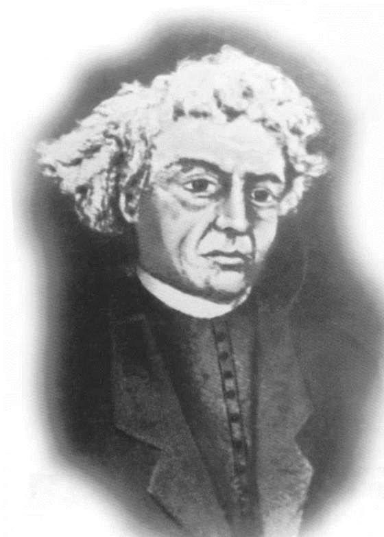
Slika 1. Portret Tomaša Mikloušića

Svećenik i književnik Tomaš Mikloušić rođen je 24. listopada 1767. u Jastrebarskom od oca Josipa i majke Katarine Antonije (Jembrih 2012: 11). U Zagrebu je pohađao gornjogradsku Arhigimnaziju, a zatim i studij filozofije na zagrebačkoj akademiji (Cesarec 2008: 50). Od 1787. do 1790. studira teologiju u Pešti, a potom se vraća u Zagreb gdje radi kao vjeroučitelj na pučkim školama. U Zagrebu je 1791. godine zaređen za svećenika, nakon čega službuje kao kapelan u župi Pleševica pod Okićem. Od 1795. radi kao profesor gramatike na zagrebačkoj Arhigimnaziji, a od 1799. kao profesor poetike. Godine 1805., nakon desetljeća rada u školi, službuje kao župnik u župi Pušća, a potom i u Stenjevcu gdje ostaje punih dvadeset i šest godina, sve do 1831. Od 1831., vjerojatno po vlastitoj želji, službuje u župi sv. Nikole u rodnome Jastrebarskom gdje i umire 7. siječnja 1833. godine (Jembrih 2012: 12). Danas se više ne zna gdje mu je grob, a dvije ulice, jedna u rodnome Jastrebarskom, a druga u Zagrebu, nose njegovo ime (usp. Cesarec 2008: bilj. 53).