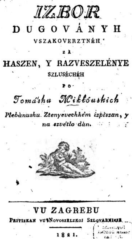
Slika 2. Naslovna stranica Izbora

„Ne znam, kak vre od nature Preljubljená Domovina Vsem vu Serdcu slast zrokuje, I na ljubav vse nagiba.“