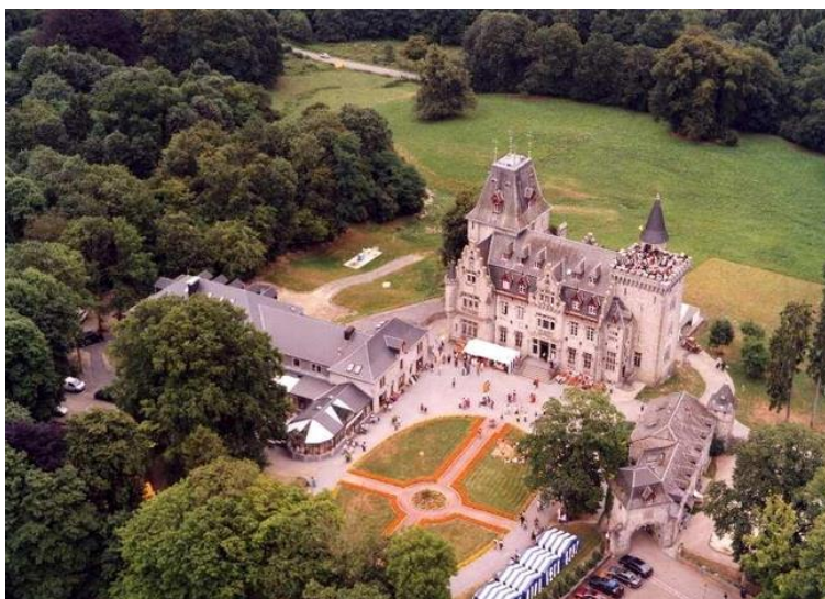
Slika 18. Radhadesh (s desne strane se nalazi druga galerija MOSA-e u prvom dijelu kompleksa)

MOSA je nastavila svoje širenje kada je 2015. godine otvorila ogranak na toskanskim brežuljcima u Villi Vrindavan, nedaleko od Firence. U prizemlju tog Muzeja nalazi se izložba slika umjetnika Jnananjane koja prikazuje razne događaje i epizode iz čuvenog indijskog epa