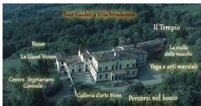
Slika 19. Villa Vrindavan, prikaz kompleksa

Mahabharate te ona ima karakter stalnog postava. Na katu se nalaze galerije koje prikazuju zabave Gospodina Rame te, nadalje, odabrane umjetničke slike ISKCON-a i prostoriju posvećenu A.C. Bhaktivedanta Swamiju Srila Prabhupadi, začetniku i osnivaču ISKCON-a. MOSA u Italiji također posjeduje i galeriju za povremene izložbe u bivšoj kapeli Ville Vrindavan. 54 MOSA također organizira i predstavlja svoje izložbe u raznim dijelovima svijeta, kao što je Nacionalna akademija umjetnosti u New Delhiju (ili Lalit Kala Academy ). 55