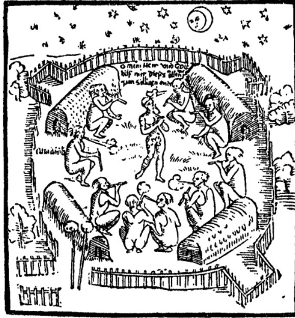
Slika 3. Smrt i izlječenje (Mjesec se ljuti na njih zbog krivog postupanja prema Stadenu)

Staden opisuje također kako su u selu Tickquarippe (Ticoaripe), nedaleko od njegovog, pripremali pojesti jednog zatočenika. U takvim situacijama, uvijek se pripremalo piće caium 8 , koje se radilo od raznog korijenja. Nakon što bi Indijanci konzumirali to piće, ubili bi zatočenika. Dalje u tekstu Staden opisuje kako su tretirali zatočenike nakon borbe s vojskom naroda Brikioka, od kojih je Staden znao mnoge. Nakon što su ih doveli u selo, one koji su bili jako ozlijeđeni su odmah ispekli na ražnju i pojeli, dijeleći meso međusobno. Među njima je bilo i par mameluco 9 vojnika, robovi vojnici koji su imali domorodačko podrijetlo, bar sa strane jednog od roditelja. Staden je pokušao nagovoriti kralja da ne pojede robove vojnike, što je on odbio rekavši kako su si sami krivi jer su se pridružili njihovim neprijateljima u borbi. Sve su ih sakupili na jednom mjestu i pojeli, no prije toga zatočenici su provocirali svoje otmičare, govoriti kako su oni ti koji će uspjeti osigurati osvetu za sve svoje rođake. (Staden, 1557; 87-91)