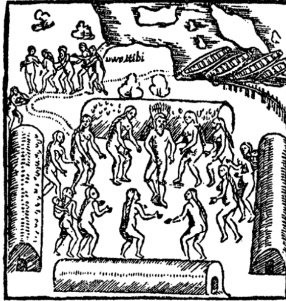
Slika 2. Ples sa Stadenom