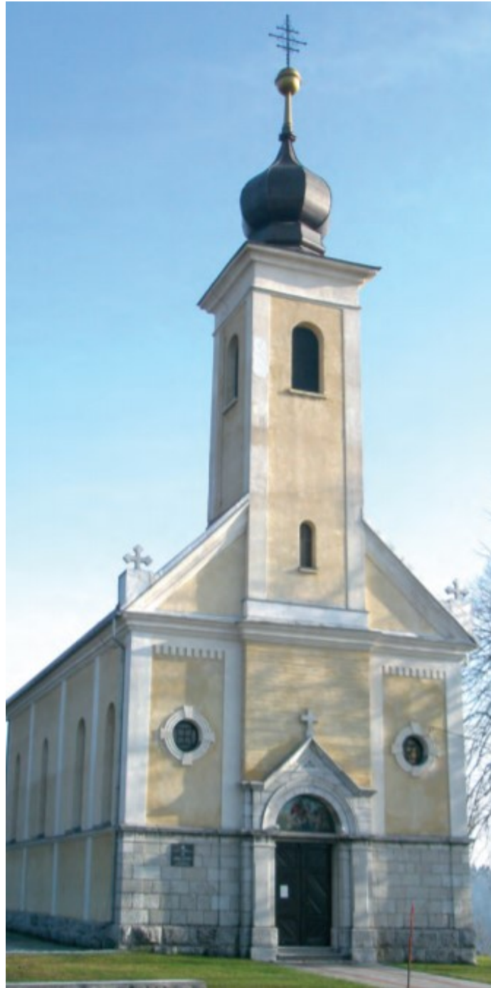
Slika 7. Pravoslavni parohijalni hram Svetog Velikomučenika Georija, Moravice, autor: Filip Škiljan

prenijeti na svoju djecu, pri čemu, uglavnom nesvjesno, uvijek iznova oživljavaju pretkršćanske elemente u njima.