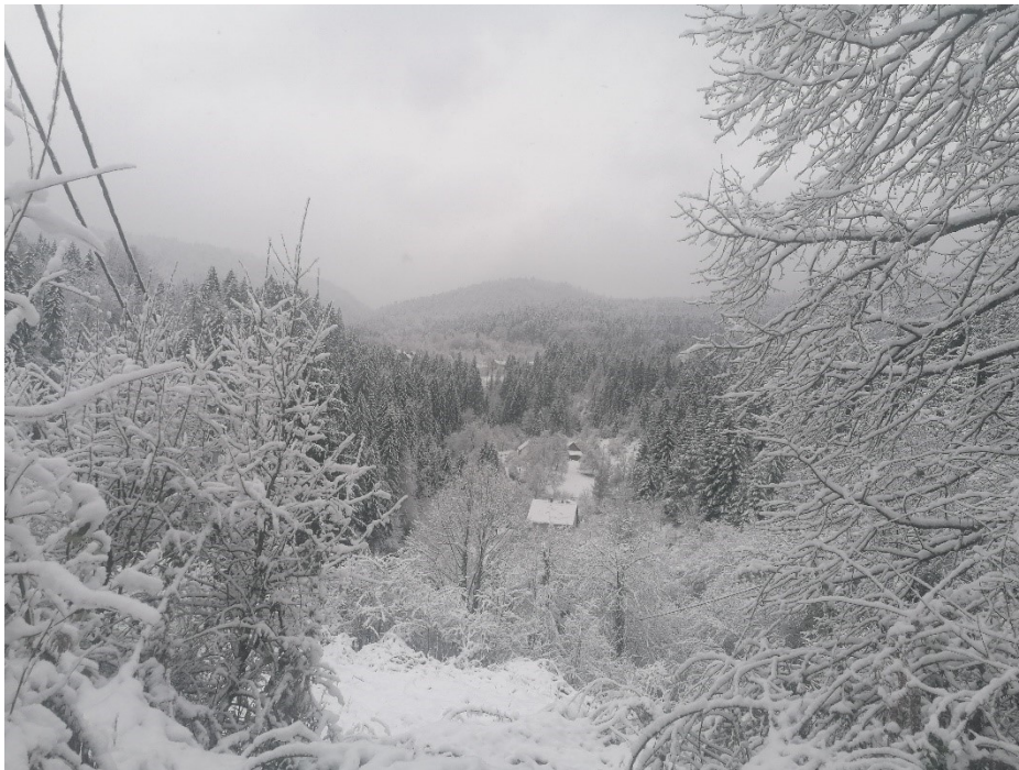
Slika 4. Moravice

U nastavku rada slijedi pregled godišnjih običaja na širem hrvatskom području te onih koji se i danas izvode među stanovnicima Moravica, kao i analiza i usporedba katoličkih i pravoslavnih običaja, koji podrijetlo nalaze u mitskom svjetonazoru drevnih Slavena.