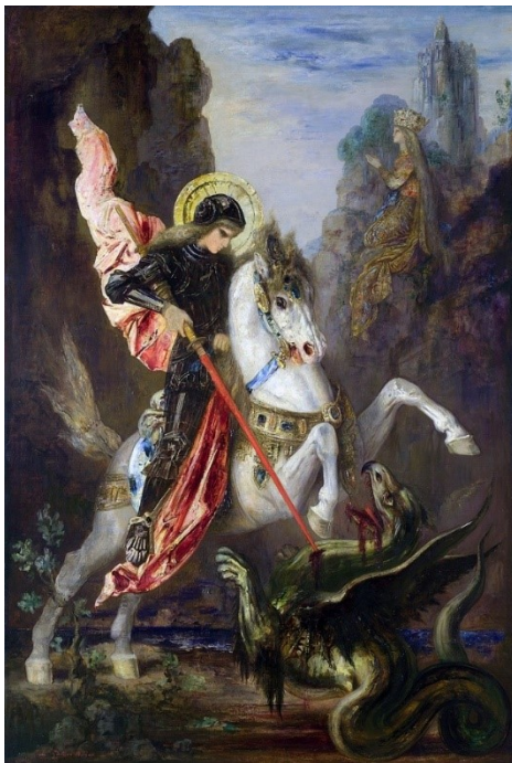
Slika 2. Sv. Juraj i zmaj, autor: Gustave Moreau

Brak se sklapa na Ivanje, trenutak u kojem Juraj postaje u narodnoj predaji Ivan kojeg ubijaju zbog bračne nevjere, a ljupka Mara postaje okrutna Morana koja umire pred kraj godine, kada priča ciklički počinje ispočetka. Dolaskom pred zlatna vrata Perunova dvora na Zemlji, prije nego će Juraj zaprositi Maru, predaje joj ključeve Velesovog mitskog svijeta Vireja „... kako bi se spajanjem dvaju principa – vlažnosti podzemlja i sunca gornjeg svijeta – dobio temelj plodnosti “ (Vukelić 2012:16).