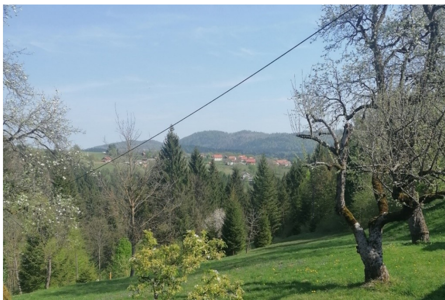
Slika 3. Moravice

Gorski kotar, sastavni dio Primorsko-goranske županije, planinski je kraj koji je u starom vijeku često bio izbjegavan zbog teško prolazne šumovite gore tog područja. Budući da je smješten između panonskog i primorskog dijela Hrvatske, pod raznovrsnim se kulturnim, civilizacijskim i geografskim utjecajima oblikovao u identitet koji je do današnjih dana prepoznatljiv kao identitet Gorskog kotara (Batina 2005:185). Taj je nepristupačan i neprohodan kraj bio prostorno i politički marginaliziran do 18. stoljeća, kada dolazi do prvih značajnih promjena. Izgradnjom željezničke pruge 1875. godine te magistralnih cesta Jozefine, Karoline i Lujzijane, Gorski kotar postaje poveznica između kontinentalnog dijela Hrvatske i sjevernog Jadrana, s istaknutim središtima Srednje Europe (ibid. 187). S obzirom na specifičnost krajolika, u Gorskom kotaru prevladavaju raspršena naselja, dok se glavni gospodarski tokovi i najveća koncentracija stanovnika nalazi u središnjem dijelu, gdje su smještena i najveća naselja: Fužine, Lokve, Skrad, Delnice i Vrbovsko (ibid. 188).