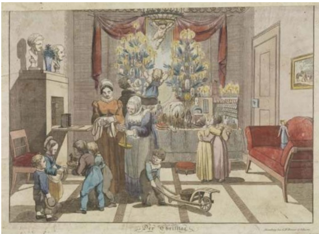
Slika 5. Der Christtag , Fundus: Germanisches Nationalmuseum, Nürnberg

U hrvatskoj kulturi, od samog početka kršćanskog života, Božić je prihvaćen kao najveseliji i najrasprostranjeniji kršćanski blagdan te najomiljeniji religijski datum u narodnoj običajnosti (ibid. 6). U knjizi Dunje Rihtman Auguštin Božić je definiran kao dan kada se slavi rođenje Isusa, Sina Božjeg te predstavlja dan mira i veselja. Kršćanski mir, kako predlaže Bonaventura Duda, odnosi se na boljitak, napredak i blagostanje svijeta, dok je Isus „svijeta razveseljitelj“ (Rihmtan Auguštin 1992:7).