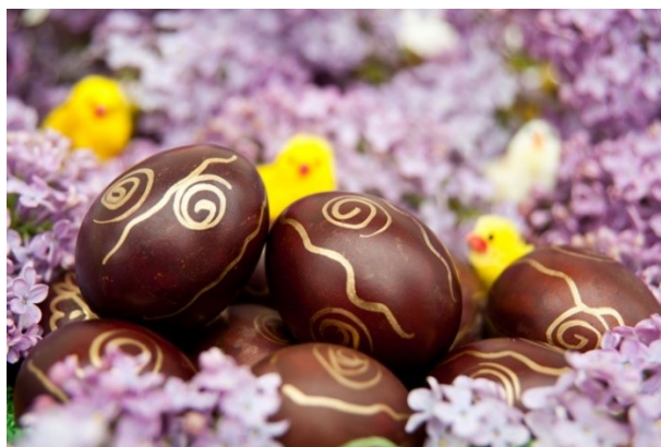
Slika 9. Uskrsna jaja: vječni simbol novog života, autorica: Roberta F.

U katoličkoj se vjeri bojanje jaja odvija na Veliku subotu, dok pravoslavci taj običaj izvode na Veliki petak. Kupovne boje koje danas prevladavaju zamijenile su tradicionalno bojanje jaja prirodnim pigmentima, napravljenim od trava, cvijeća i kore drveća. Običaj se ipak djelomično zadržao do danas te dio stanovništva Moravica još uvijek koristi ljuske luka, kore cikle i listove koprive kako bi dobili prirodne nijanse smeđe, crvene i zelene boje. Pravoslavni vjernici koji odlaze u crkvu na Uskrs dobivaju po jedno jaje koje čuvaju u kući do idućeg Uskrsa. Također, običaj darivanja, odnosno razmjenjivanja jaja rasprostranjen je među vjernicima obje vjeroispovijesti koje se, prema Marcelu Maussu „... temelji na nerazdvojuju jedinstvu osobe i darovne stvari. U daru je sadržan dio osobe koja ga poklanja, te on stvara neku vrstu materijalno-duhovne veze između darovatelja, povezujući ih na specifičan duhovni način“ (ibid. 146).