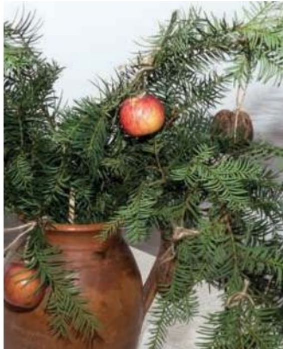
Slika 6. Božićna grana, autor: N. Koydl

Božićno drveće jedna je od najpoznatijih i najpopularnijih tradicija koja se povezuje s proslavom Božića. Povijesni podaci upućuju na razvoj današnjeg suvremenog drvca iz majeva , također božićnih drva postavljenim u javnim prostorima oko kojih su se već u šesnaestom stoljeću ljudi veselili i zabavljali. Na početku devetnaestog stoljeća božićno drveće se polako seli iz javnih prostora u domove te njegovo kićenje i ukrašavanje ima značajnu ulogu i u suvremenoj hrvatskoj kulturi. 11 Ukrase iz prirodnih materijala, poput pozlaćenih oraha, jabuka ili lješnjaka, papirnatih lančića i košara, postupno su zamijenili komercijalni ukrasi. Božićno drveće u suvremeno doba ukrašava se modernim ukrasima, aktivnost koja zaokuplja cjelokupnu obitelj na Badnje večer.