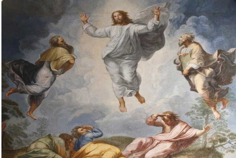
Slika 8. Uskrsnuće Kristovo, autor: Raffaello Santi da Urbino

„Uskrsni se sklop običaja može analizirati kao obred prijelaza (usp. Čapo Žmegač 1993). U mnogim religijskim vjerovanjima prisutna je ideja da umiranje na ovom svijetu znači život odnosno rođenje na drugome svijetu. U kršćanstvu to potvrđuju smrt i uskrsnuće Isusa Krista. Kako je rekao hrvatski teolog Bonaventura Duda, Uskrs je pobjeda života nad smrću, a vjera u Isusovo rođenje ujedno je i nada u uskrsnuće svih ljudi (Duda 1992). U Uskrsu se, dakle, sjećanjem na Isusovo uskrsnuće, slavi obećanje novog života ljudi na drugom svijetu. Stoga uskrsni običaji sadrže obrede prijelaza kojima se korizmenom pripravom napušta staro stanje – stanje života uskrsnoga i poslijeuskrsnoga razdoblja u kojemu je Otkupiteljevom smrću na križu ljudima obećano ponovo rođenje“ (Čapo Žmegač 1997:20).