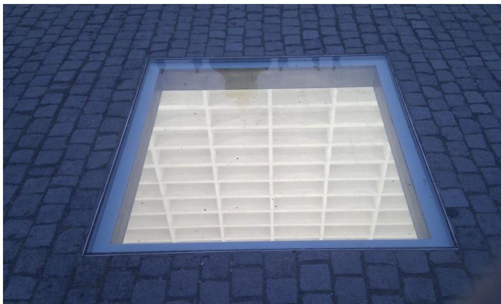
Slika 5. Spomenik na Opernplatzu u Berlinu

Spomenik je napravljen u dva dijela – nadzemni je dio kvadratna staklena ploča, u kojoj se reflektira nebo nad Berlinom, a podzemni dio je prostor koji se sastoji od četrnaest slojeva praznih, bijelih polica sa kapacitetom za 20000 knjiga. Taj broj je simboličan jer je toliko knjiga spaljeno 1933.godine na bivšem Opernplatzu. 81