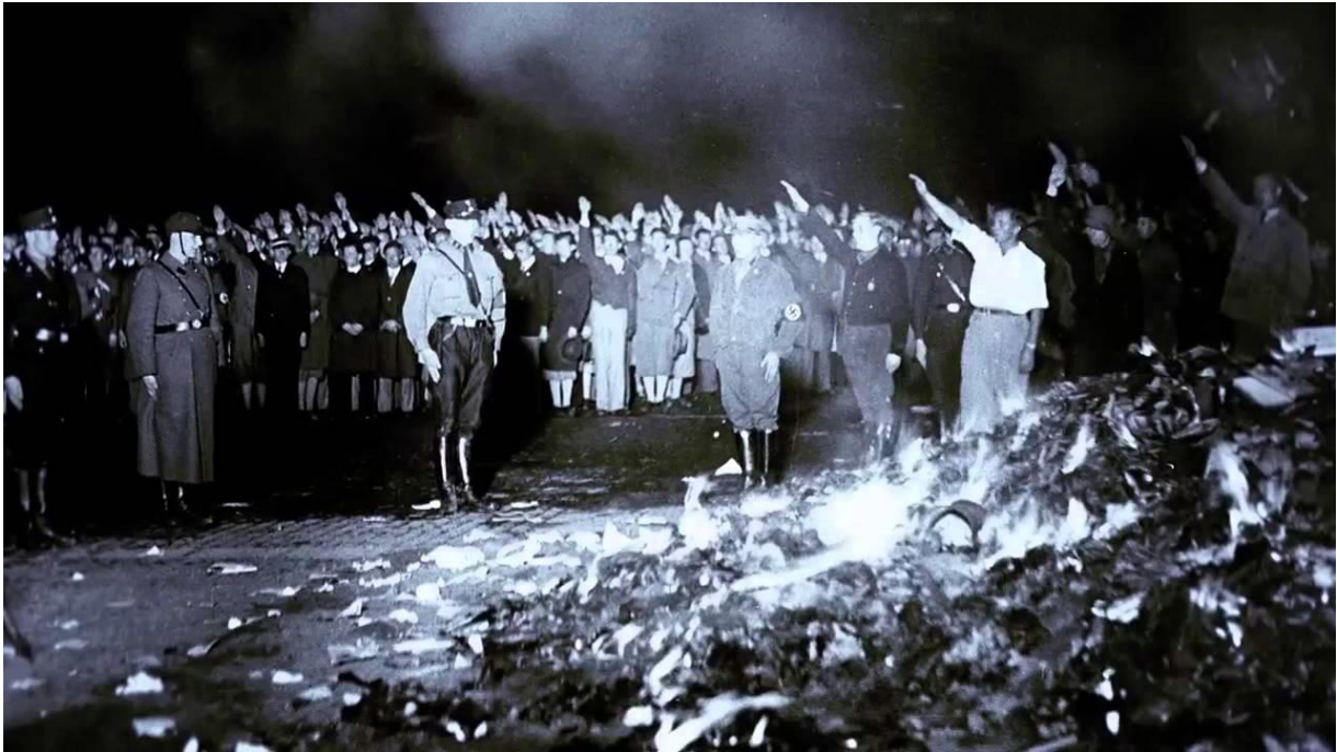
Slika 3. Spaljivanje knjiga u Berlinu 1933. godine