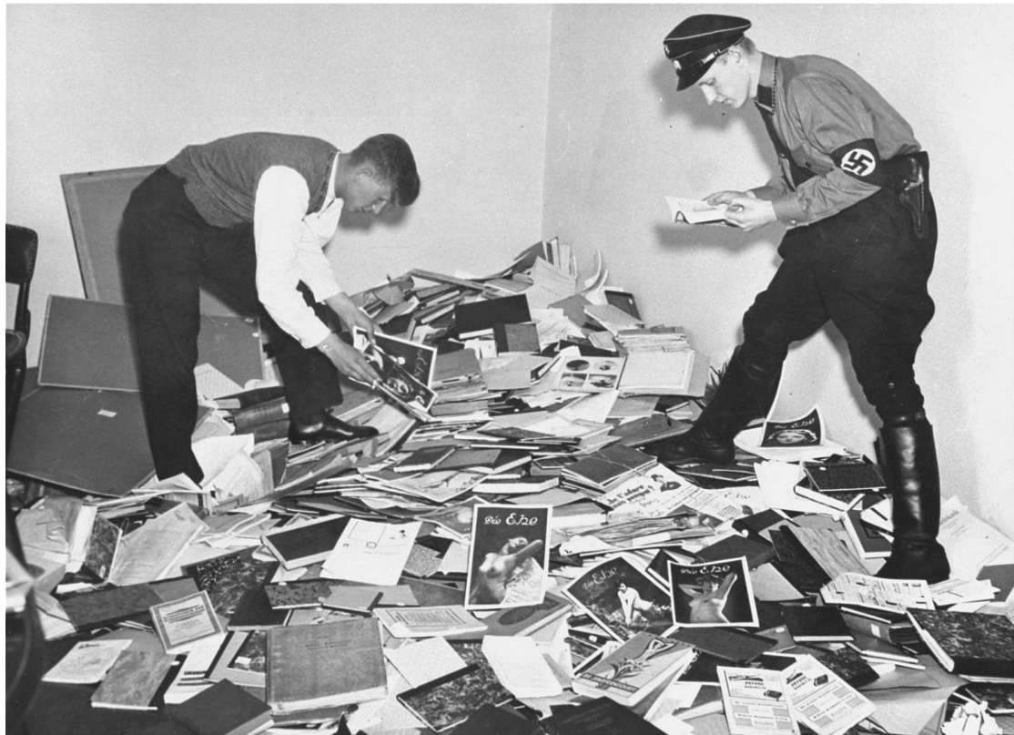
Slika 1. Njemački studenti i paravojna organizacija SA pljačkaju knjižnicu Instituta za seksualne nauke u Berlinu (Preuzeto s:

pružala bračno savjetovanje. Tokom tri sata studenti su proljevali tintu na tepihe, razbijali ili uništavali uokvirene slike, staklo, porculan, mramorne posude, svjetla i ukrase. Uzimali su sa sobom knjige, časopise, fotografije, anatomske modele, pa čak i skulpturu Hirschfeldove glave. Nakon studenata, u 15h došli su SA-ovci te zaplijenili 10000 knjiga iz knjižnice Instituta. Nekoliko dana kasnije, skulptura Hirschfeldove glave se nosila na stupu kroz paradu s bakljama, prije negoli su je bacili na lomaču zajedno s knjigama iz Instituta. 32