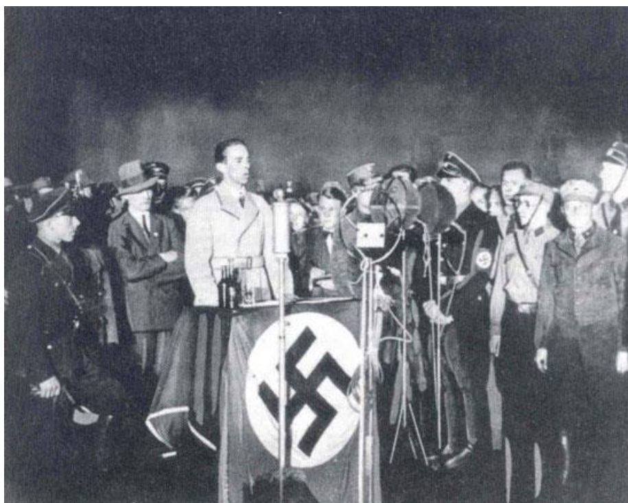
Slika 4. Joseph Goebbels drži govor prilikom spaljivanja knjiga na Opernplatzu u Berlinu

Dominantna tema u Goebbelsovom govoru je bila brisanje povijesti, a također je bila bitna i ideja radikalne čistoće, religijske čistoće i kulturne čistoće koja je provedena kroz simboliku čišćenja, gdje je knjiga ujedno i nositelj i simbol zaraze. Goebbels je uz spominjanje brisanja povijesti, govorio i o židovskim "asfalt-književnicima" te njihovom smeću i prljavštini koja puni knjižnice, a upravo su smeće i prljavština ono što uzrokuje bolesti. 54