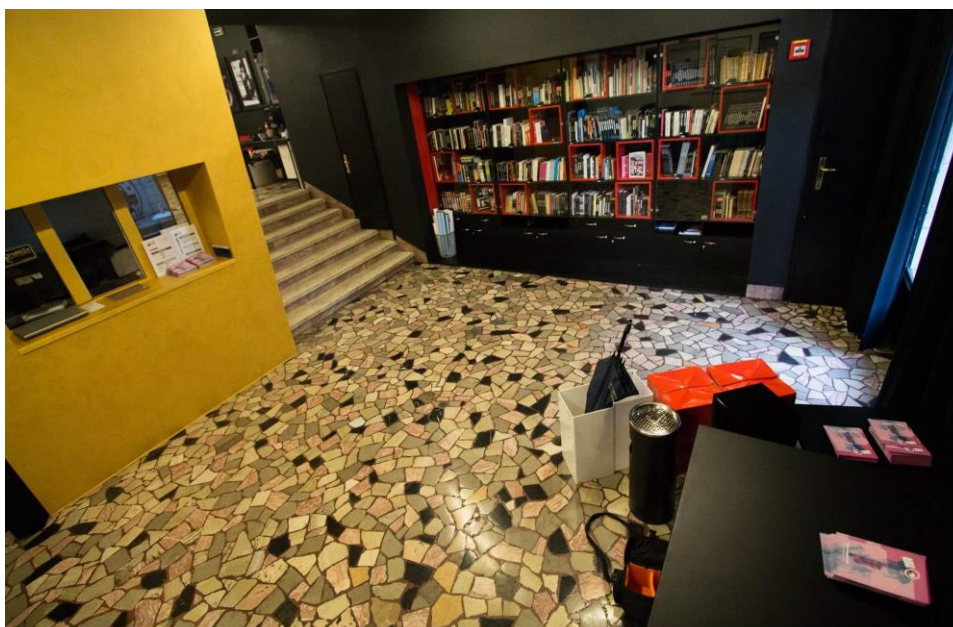
Fotografija 2: Atrij Kina - unutrašnjost Knjižnice