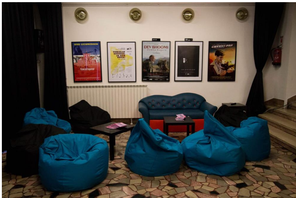
Fotografija 6: Prostor za radionice, panele, promocije i sl.