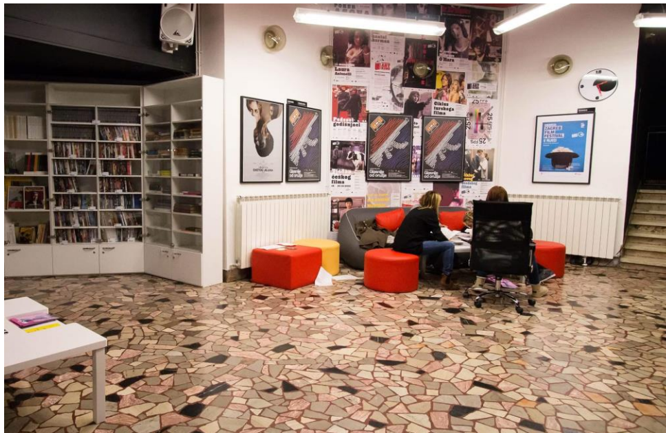
Fotografija 5. Čitaonica i prostor za opuštanje