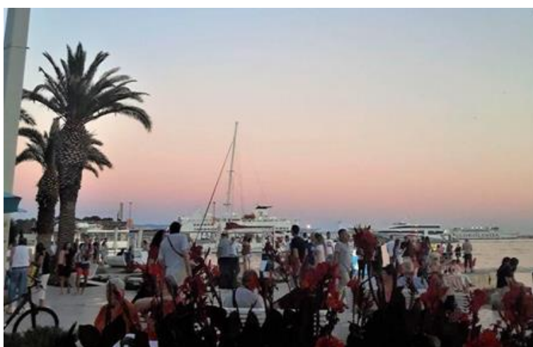
Sl. 20. Riva (zeleni dio uz more), 6. 8. 2019.