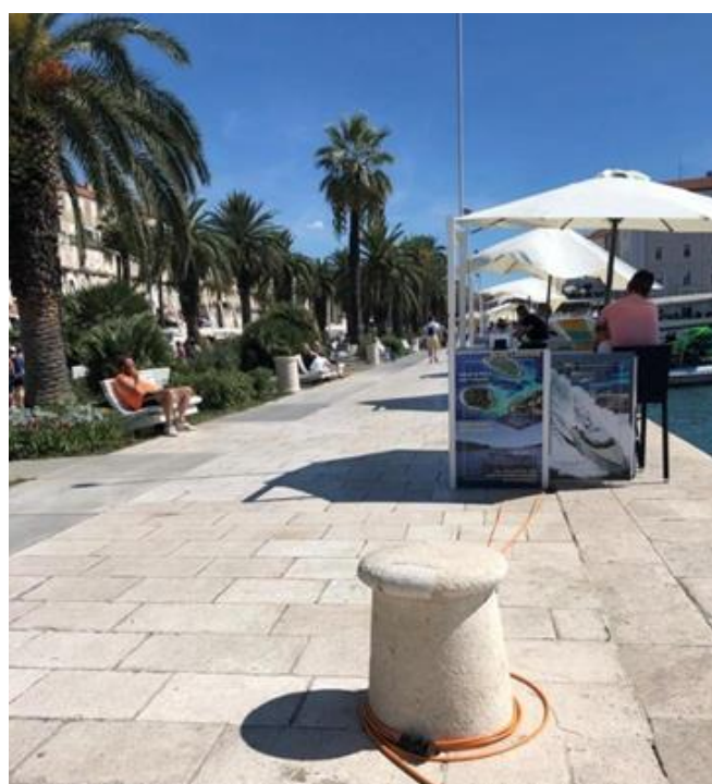
Sl. 8. Riva (zeleni dio uz more), 2. 7. 2019.