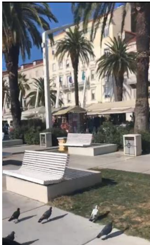
Sl. 12. Riva (zeleni dio uz more), 15. 7. 2019.