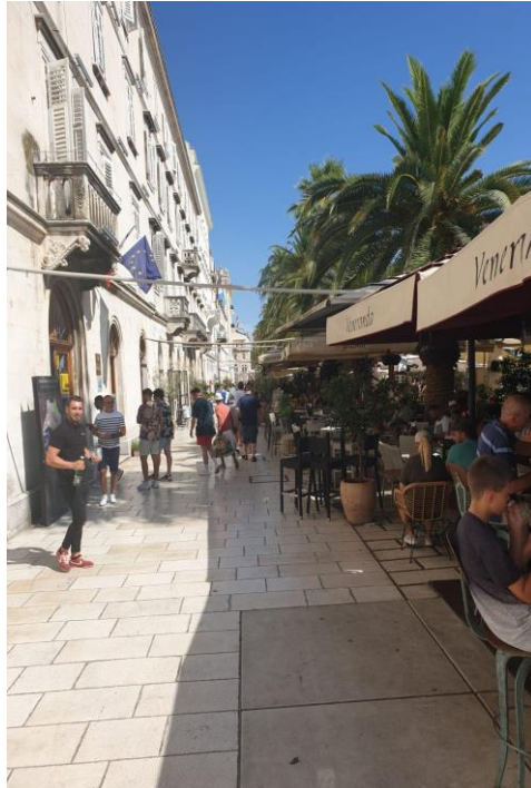
Sl. 11. Riva (5), 12. 7. 2019.