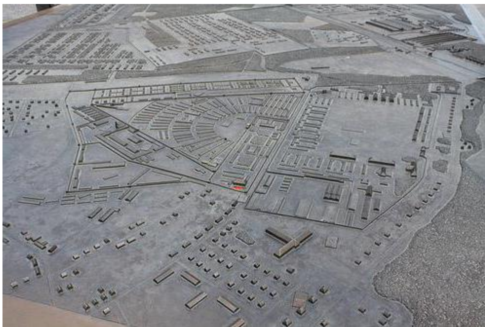
Slika 9. Tlocrt koncentracijskog logora Sachsenhausen

Sovjetskog logora. Nije bilo moguće izvesti klasično iskopavanje te su jame ispražnjene pomoću bagera. Nakon pražnjena nalazi iz jama bili su podijeljeni u nekoliko kategorija: gradnja, odjeća, higijenske potrepštine, kućni predmeti, militarija, novac i ostalo. Dataciju za pojedine predmete vrlo je lako provesti zbog predmeta koji su lako prepoznatljivi po natpisima drugih jezičnih skupina ili godina. Tijekom smještanja predmeta u navedene kategorije arheolozi su došli do zaključka da se predmeti mogu podijeliti u dvije glavne skupine, po sjećanju na osobe. Pod sjećanjem na osobe smatra se da je moguće spojiti kvalitetu i namjenu korištenja predmeta sa statusom i značenjem osobe. Predmeti koji su bili vrlo jednostavni, poput običnih žlica niske kvalitete, rukotvorina zatvorenika i dječjih igračaka mogu se povezati s nemoći, ugnjetavanjem i poniženjem nastradalih osoba, dok se predmeti poput kaciga, raskošno ukrašenih noževa i militarije mogu povezati s nadmoći počinitelja.