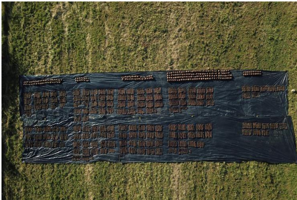
Slika 15. Ekshumirani ostatci 814 osoba tijekom istraživanja provedenih 2020. godine

je ekshumirano 814 osoba. Tijekom istraživanja 2020. godine pokušale su se utvrditi i lokacije ostalih jama, koje bi po izjavama očevidaca trebale biti u blizini, no pri iskapanju četiri probne sonde nisu pronađene nikakve naznake ostalih jama. 68