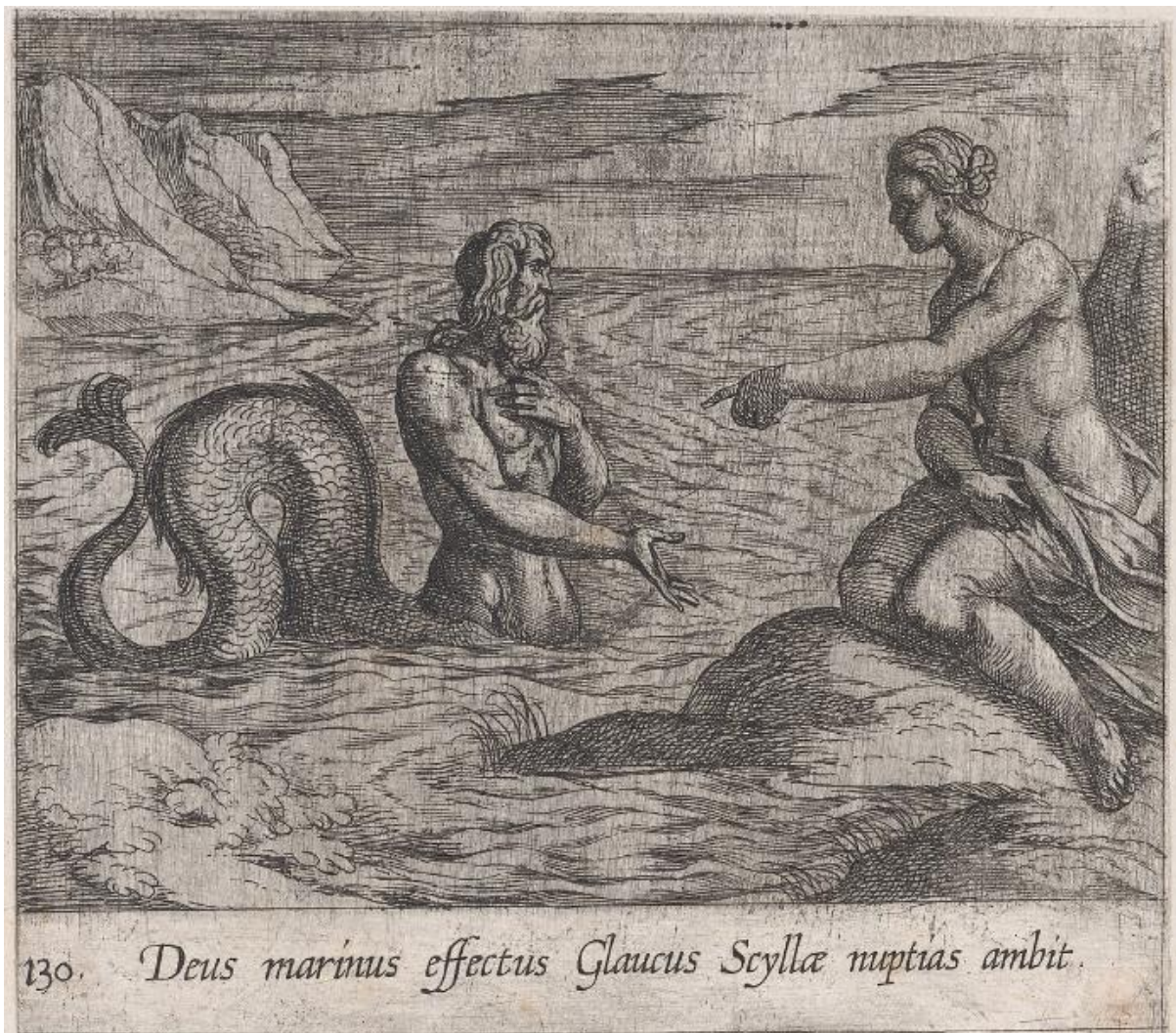
SLIKA 27. Antonio Tempesta, Glauk i Scila , bakrorez, 1606., The Metropolitan Museum of Art

grafici Tempesta najviše bavi figurama, što se vidi na Glaukovoju desnoj ruci s fino naglašenim mišićima nadlaktice i podlaktice. Na njegovom su licu vidljive bore i podočnjaci (SL. 28), a kosa je izvučena u pramenovima vijugavih linija. Glaukov torzo definiran je igrom svjetla i sjene, gdje svaki mišić ima prazan, neobrađeni dio plohe koji se razbija postepenom sjenom šrafiranja. Njegov rep izveden je na tipičan Tempestin način, gdje je konturnim i strukturnim linijama izveden glavni oblik, koji se onda preko tih linija šrafira. Scilino tijelo također je mišićavo, naglašenim prijelazima oblina. Njeno je pak lice u sjeni, no to nije spriječilo Tempestu da definira njene pune obraze i visoke jagodice (SL. 29).