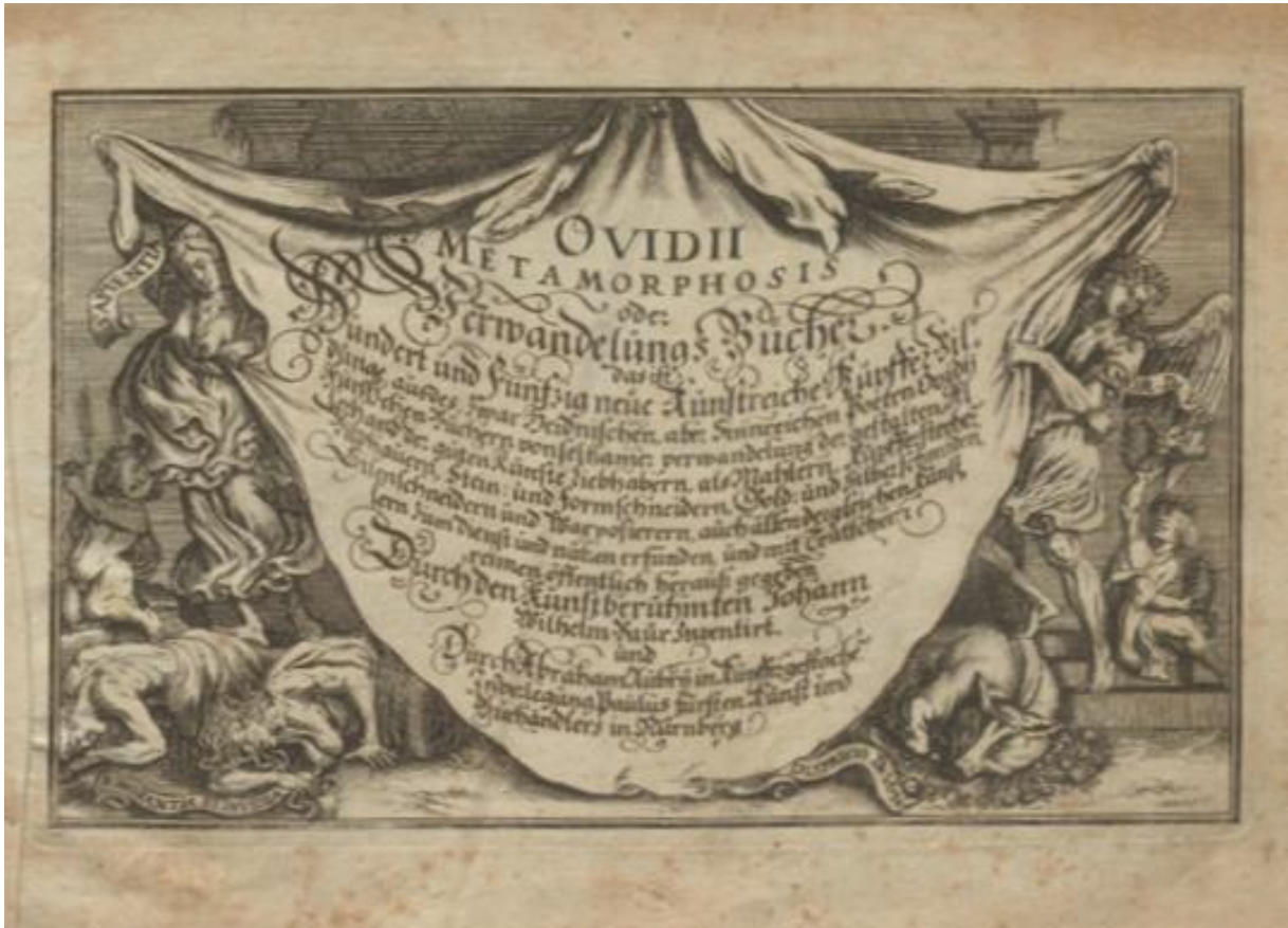
SLIKA 10. Abraham Aubry (prema Bauru), gravirana naslovnica Ovidijevih Metamorfoza , primjerak u Sveučilišnoj knjižnici Erlangen-Nürnberg

Nakon gravirane naslovnice slijedi tiskana naslovnica s latinskim tekstom (SL.11):