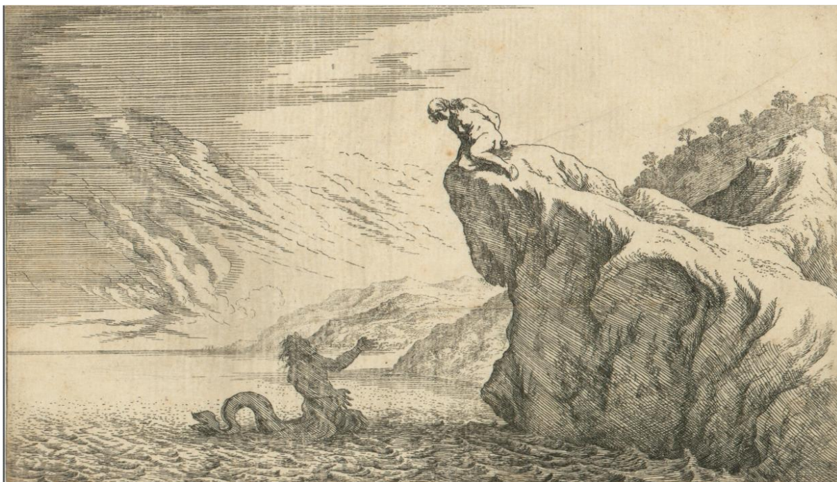
SLIKA 30. Johann Wilhelm Baur, Glauk i Scila , bakropis, 1641.?, Grafička zbirka Nacionalne i sveučilišne knjižnice u Zagrebu

Oba umjetnika pak prikazuju Scilu na sunčanoj obali, a ne u sjenovitom zaklonu. Tempesta, čija je scena ranija, htio je ipak prikazati Glaukov prilazak nimfi na suncu, kako bi se bolje uklopio u iduću scenu. Taj je koncept pak, Baur prihvatio i u svom stilu dalje razradio. Tempesta prikazuje likove u mirnijem dijalogu, s bližim fizičkim pozicijama i gestikulacijama koje sugeriraju razgovor. Kod Baura je njihova fizička razlika daleko veća te se Glaukovi frenetični pokreti ruku oštro sukobljavaju sa Scilom koja izgleda kao da bez riječi pogledava prema njemu. Baurovo odbijanje Glauka stoga bi dojmom bilo bliže konceptu koji Ovidije donosi, no Tempesta Scila ipak bolje prenosi sam razlog tog odbijanja.