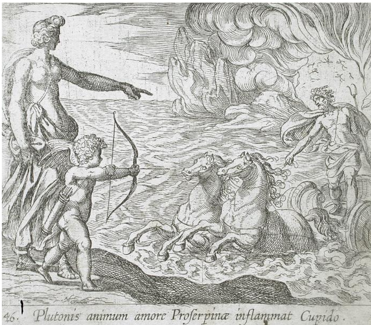
SLIKA 22. Antonio Tempesta, Kupid strijelom gađa Plutona , bakrorez, 1606., The Metropolitan Museum of Art

za koji možemo pretpostaviti da su svojevrsna vrata Podzemlja s obzirom da su tankim linijama izvedeni maleni antropomorfni oblici koje predstavljaju ljudske duše. Oko prolaza se izdižu masivni valovi morske pjene ili pare koja je uzrokovana izlazom boga. Za razliku od Solisovog divljeg mora, Tempestino se uzburkava tek ispod kočije i konja. Venera upire prstom prema Kupidovoj meti – Plutonovom srcu. Lagan i brz Tempestin potez najvidljiviji je na izvedbi konjskih griva i repova, gdje se tanke vijuge kovrčaju u konjskom zaletu. Na grafici se dobro vidi Tempestina izvedba ljudskog tijela te je posebno zanimljiv Kupidov lik. Dječak je elongiran, s lagano mišićavim rukama koje napinju luk i strijelu. Sitne zakrivljene linije kreiraju sjene koje stoga daju privid zakrivljenosti tijela. Jaka sjena evidentna je na Venerinom licu koje je usko šrafirano strogim ravnim linijama. Cjelokupna scena odiše vrućinom i parom koja je stvorena otvaranjem Podzemlja, odnosno izlazom Plutona.