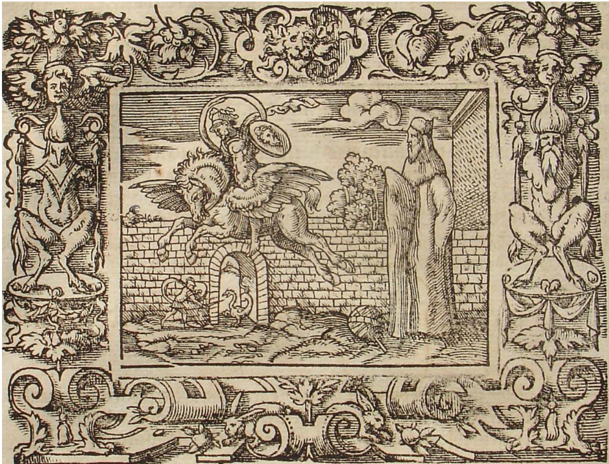
SLIKA 18. Virgil Solis, Atlasova preobrazba u planinu , drvorez, iz: P. OVIDII METAMORPHOSIS, izdavač Sigmund Feyerabendt, Frankfurt, 1581.

Antonio Tempesta, Atlasova preobrazba u planinu , 1606., bakropis, dimenzije 107 x 121 mm (SL. 19). Bez signature. Grafika horizontalnog usmjerenja obrubljena je jednostavnim linijskim okvirom te ispod slikovnog prikaza teče numerirani tekst u kurzivu: 43. Atlas ob inhospitalitatem in montem sui nominis koji opisuje da Atlas postaje planina svog imena zbog vlastite negostoljubivosti. Akteri se nalaze u zraku te su velike visine mjesta radnje definirane nagovještajem planina u pozadini te nisko spuštenim horizontom iznad kojeg se raspršuju oblaci. Perzej se ponovno nalazi na krilatom konju te drži štit s likom Meduzine glave usmjeren prema Atlasu na desno. Atlasovo tijelo je već duboko u preobrazbi, donji dio tijela je već okamenjen dok je gornji još uvijek dinamičan u izrazu mukotrpnog bježanja od vlastite sudbine. Atlasovo lice je ispunjeno nevjericom, dok je Perzejevo prazno, stoično. Tempestin prostor je širok i atmosferski; pozadinske planine i oblaci izvedeni su pojedinačnim crtanjem bakropisnom iglom, što odaje dojam dalekih udaljenosti. Perzej i krilati konj, su kao i kod Solisa najfinije izvedeni. Šrafiranje okomitim linijama i raznim zakrivljenim smjerovima stvara ne samo obrise