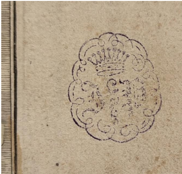
SLIKA 13. Abraham Aubry, Aetas Argentea , verzija iz Grafičke zbirke Nacionalne i sveučilišne knjižnice u Zagrebu, detalj.

S obzirom da zagrebački album počinje scenom koja je numerirana brojem 4, a završava scenom broj 148, jasno je da predmet nije 'cjelovit'. Aubryjevo izdanje Metamorfoza iz Sveučilišne knjižnice Erlangen-Nürnberg nakon dvije naslovnice počinje prikazom naziva RERVUM DISTINCTIO u kojem Ovidije opisuje nastanak svijeta. Slijedi ploča pod brojem dva naziva ANIMANTIBUS HABITENDI LOCUS ASSIGNATUR , iza koje slijedi treća AETAS AUREA , nakon koje dolazi četvrta ploča AETAS ARGENTEA koja se podudara sa zagrebačkim prvim listom u albumu.