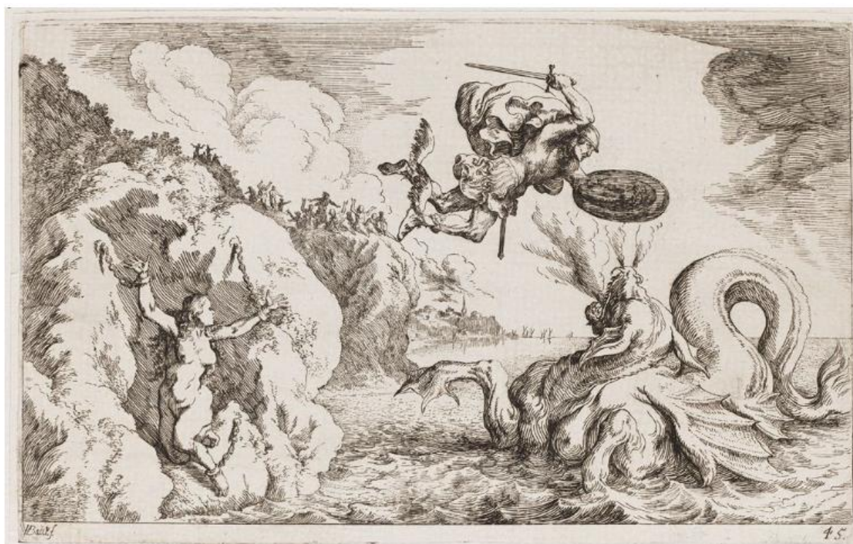
SLIKA 9. Johann Wilhelm Baur, Perzej spašava Andromedu , 1641., bakropis, Harvard Arts Museums/Fogg Museum.