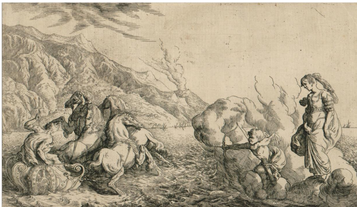
SLIKA 23. Johann Wilhelm Baur, Kupid strijelom gađa Plutona , bakropis, 1641.?, Grafička zbirka Nacionalne i sveučilišne knjižnice u Zagrebu

Johann Wilhelm Baur, Kupid strijelom gađa Plutona , 1641.(?), bakropis, dimenzije 125 x 205 mm (SL. 23). Grafika je suprotno orijentirana od grafike u albumu Abrahama Aubrya. Bakropis je bez okvira. Pluton je kod Baura u kvadrizi i bogato ornamentiranoj kočiji s volutama i raznim aplikacijama. Njegovo tijelo je zakrenuto prema lijevo te je promatraču okrenut leđima. Konji su rastreseni, moguće zbog konstantne erupcije Etne koja je definirana u pozadini s malenim crticama. Venera i Kupid su sad postavljeni na oblaku s desne strane, gdje Venera drži svoje haljine objema rukama te se pognutom glavom i otvorenim ustima sugerira njeno nagovaranje Kupida da ispusti strijelu. Kupidovo lice je napeto i fokusirano na zadatak. Baur na ovom primjeru ima gotovo slikarski pristup. Nakon stupnjevanja jačine sjena pomoću manjih ili duljih crtica te njihovom gustoćom, Baur sad stupnjeva i dubinu zariva bakropisne igle u matricu. To se da primijetiti na grupaciji Plutona i kvadrige; kočija je definirana laganim potezima koji su ostvarili blijedu sivkastu boju na grafici, dok su sjene konja izvedene dubokim zarivima čime je ostvarena duboka crnina linije. Na takav način su prijelazi svjetlosti i sjene izrazito suptilni, bez gomilanja gustih linija i uskog šrafiranja, već slikarski, uz pomoć stupnjevanja tona.