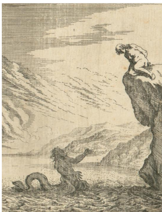
SLIKA 2. Johann Willhelm Baur, Glauk i Scila , detalj, 1641.?, bakropis, Grafička zbirka Nacionalne i sveučilišne knjižnice u Zagrebu

Unutar okvira definiranog elementima manirističke dekoracije u prvom prostornom pojasu se nalaze Glauk i Scila s ispisanim imenima. Glauk se izdiže iz mora prilikom čega se vidi njegov riblji rep te je pogledom usmjeren prema Scili koja silazi s kamena i dijeli pogled s njim. Iza njih se prema dubini prostora razvijaju scene iz ostatka Knjige XIV. Detalj Baurova prikaza Glauka i Scile (SL. 2) je u odnosu na Francovo rješenje monumentalniji, ali i jednostavniji. Glauk je kod Baura također smješten u more s vidljivim repom, s pogledom prema Scili koja je u ovom slučaju na visokoj kamenoj gromadi te je za razliku od Francove uspravne te odjevene Scile, Baurova posjednuta i naga.