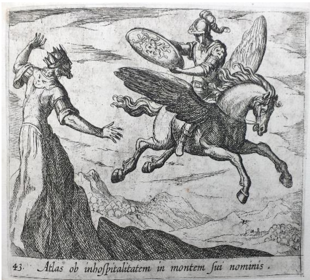
SLIKA 19. Antonio Tempesta, Atlasova preobrazba u planinu , bakrorez, 1606., The British Museum

konjskih mišića na prednjem dijelu konjskoga tijela, već i dinamičnost njegova poleta u zraku. Donji dio desnog krila izveden je prvo finim potezima koji definiraju pojedinačna krila, dok su potom rezane guste ravne paralelne linije kako bi se ostvarila sjena pod krilom. Perzejevo lice je isto tako definirano tankim konturnim linijama, dok je sjena koja mu pada na gornji dio lica zbog kacige izvedena ponovno gustim paralelnim linijama. Način na koji pada svjetlo na lik Atlasa oštro je definiran te zbog toga doprinosi osjećaju dramatičnosti situacije. Bijeli, neobrađeni dijelovi njegovog tijela, u kontrastu su sa sjenovitim dijelovima koji su gusto šrafirani okomitim ravnim linijama. Najvidljivije je to na njegovoj glavi, gdje je stražnji dio glave obasjan svjetlošću i s time definiran samo konturnim linijama, dok je lice rezano ravnim linijama. Takvim postupkom je Tempesta postigao ne samo kontrast svjetla i sjene, nego i osjećaj tmurnosti koje pada na lice osobe koja proživljava strašnu preobrazbu.