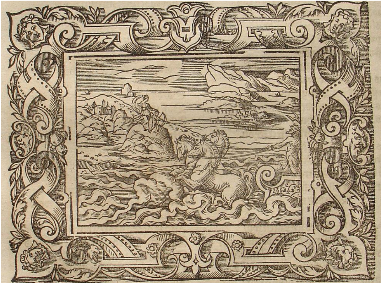
SLIKA 21. Virgil Solis, Kupid strijelom gađa Plutona , drvorez, iz: P. OVIDII METAMORPHOSIS, izdavač Sigmund Feyerabendt, Frankfurt, 1581.

djelomično, no njen prednji dio nosi volutu identičnu volutama s okvira, što je zanimljiv primjer povezivanja vanjske i unutarnje dekoracije grafike. Pluton je prikazan nag te je sjena na njegovim leđima izvedena pomoću kratkih crtica. Venera i Kupid su prikazani izrazito sitni, no strateški izvedenim linijama njihovih malenih figura može se uočiti Venerino naređivanje Kupidu da potajice gađa boga Podzemlja. Solis na ovom drvorezu vrsno definira atmosferu scene dugim, ravnim paralelnim linijama koje su tako oštra suprotnost divljem moru iz kojeg Pluton izlazi.