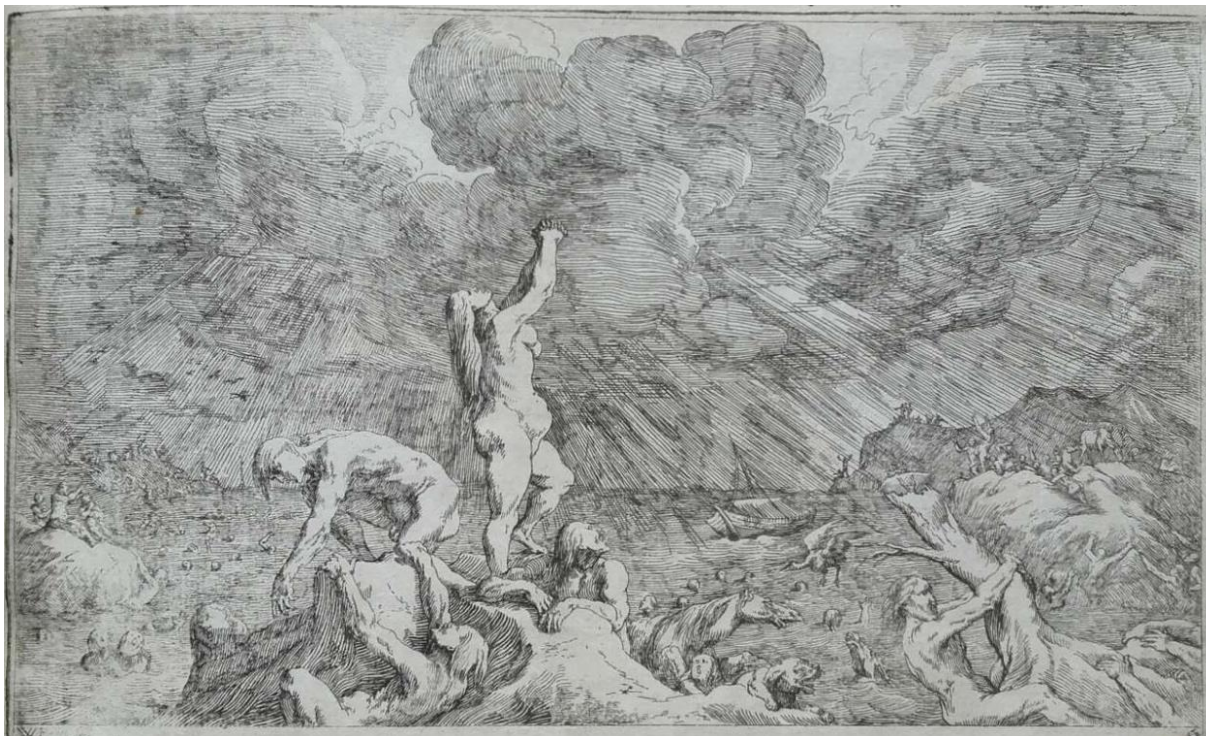
SLIKA 14. Johann Wilhelm Baur, Poplava , British Museum.