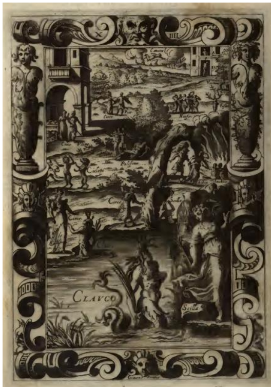
SLIKA 1. Giacomo Franco, naslovnica Knjige XIV., bakropis, iz: Giovanni Andrea dell'Anguillara, Le Metamorfosi di Ovidio , Venecija: Giunti, 1584.

Autor prijevoda koji je Franco koristio prilikom ilustriranja teksta je Giovanni Andrea dell'Anguillara (Sutri, 1517. – Sutri, 1570.), čiji su najznačajniji prijevodi upravo Ovidija te Vergilija 44 Kompletan dell'Anguillarov prijevod Ovidijevih Metamorfoza objavljen je 1561. godine. 45 Franco je 1584. godine načinio petnaest grafičkih prikaza okomitog formata dimenzija 157 x 95 mm te je prvu scenu iz knjige postavljao u prvi prostorni pojas ilustracije naslovnog lista. Na naslovnici za Knjigu XIV tako je najbliže promatraču smještena postavljena scena Glauk i Scila , prva narativna scena četrnaeste knjige (SL. 1). 46