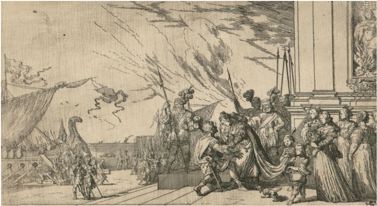
SLIKA 34. Johann Wilhelm Baur, Didona dočekuje Eneju , bakropis, 1641.?, Grafička zbirka Nacionalne i sveučilišne knjižnice u Zagrebu.