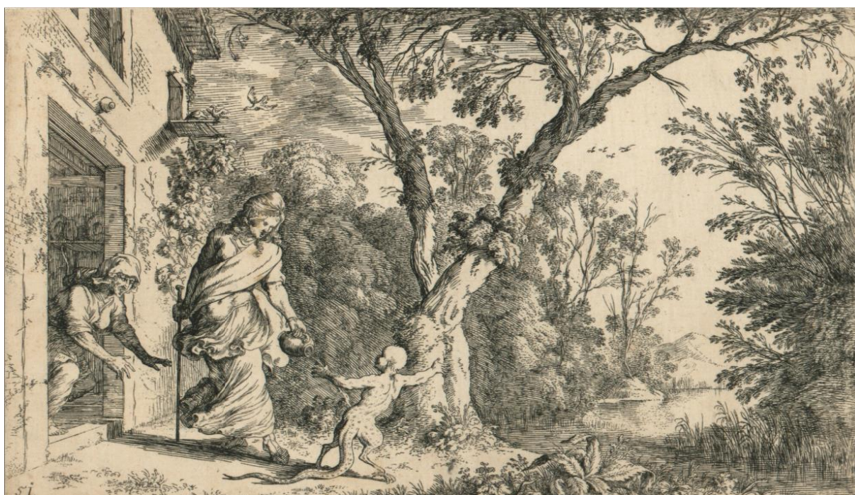
SLIKA 26. Johann Wilhelm Baur, Cerera i uvredljivi dječak , bakropis, 1641.?, Grafička zbirka Nacionalne i sveučilišne knjižnice u Zagrebu

je izgrađena od cigle. Prostor u koji je scena smještena nema seoski dojam, već onaj šumski, gdje je staričina kuća smještena uz more. Akteri su grupirani na lijevu stranu kompozicije, dok je Baur na desnoj strani razvio čitav krajolik pun različitih stabala, grmlja i raslinja, kao i veliko stablo koje se račva u formi obrnute piramide koje odvaja te dvije strane kompozicije. Baur, za razliku od Solisa i Tempeste, prikazuje Cereru s vrčem koji joj je starica dala da se napije tijekom dugog puta. Prikazan je trenutak u kojem je dječak već uvrijedio božicu te ona proljeva napitak na donji dio njegova tijela koji se transformira u guštera. Cererino tijelo je zakrenuto kao da je sekundu prije dječak izjavio uvredljiv komentar, na koji se ona odmah okrenula s vrčem. Starica je prikazana u šokiranoj reakciji hitanja za unesrećenim dječakom, no čin je već gotov. Na takav je način Baur ostvario napetu dinamiku u kojoj je prikazan sekundarni trenutak ove pretvorbe. Razina minuciozne izvedbe krajolika je iznimno visoka; bezbroj zareza iglom kreiraju najmanje žilice lišća i raslinja. Na ovom prikazu dobro je vidljiv utjecaj Nicolasa Poussina i Claude Lorraina na Baurovu izvedbu; tom pomno izrađenom krajoliku pridana je gotovo veća pažnja nego samim likovima. Za komparaciju se može uzeti oblikovanje Cererino lice, koje je izvedeno pomoću nekoliko linija koje samo definiraju oči, usta i nos, dok je biljka u donjem rubu prvog plana ispunjena crticama i točkicama.