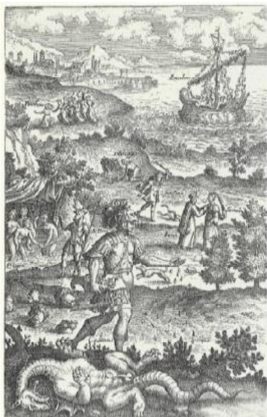
SLIKA 3. Matthäeus Merian, Naslovnica. Knjige III. Metamorfoza , 1619., bakropis, detalj. Preuzeto iz: Stachel, Eva. Johann Wilhelm Baur – Seine Illustrationsserie zu den Metamorphosen des Ovid, Universität Wien: diplomski rad, 2013., str. 111.

Usporedbom naslovnice treće knjige Metamorfoza Matthäusa Meriana (SL. 3) s naslovnicom Giacoma Franca (SL. 4) prema kojoj je nastala, primjećuju se razlike u detaljima. Najviše se primijeti različita izvedba neba, odnosno oblaka, koji su kod Franca punašni i zgusnuti u sredini, dok su kod Meriana raštrkaniji te istaknuti paralelnim linijama neba. Iako je kompozicija jednaka, različitosti se vide na obradi tekstura i detalja grafike.