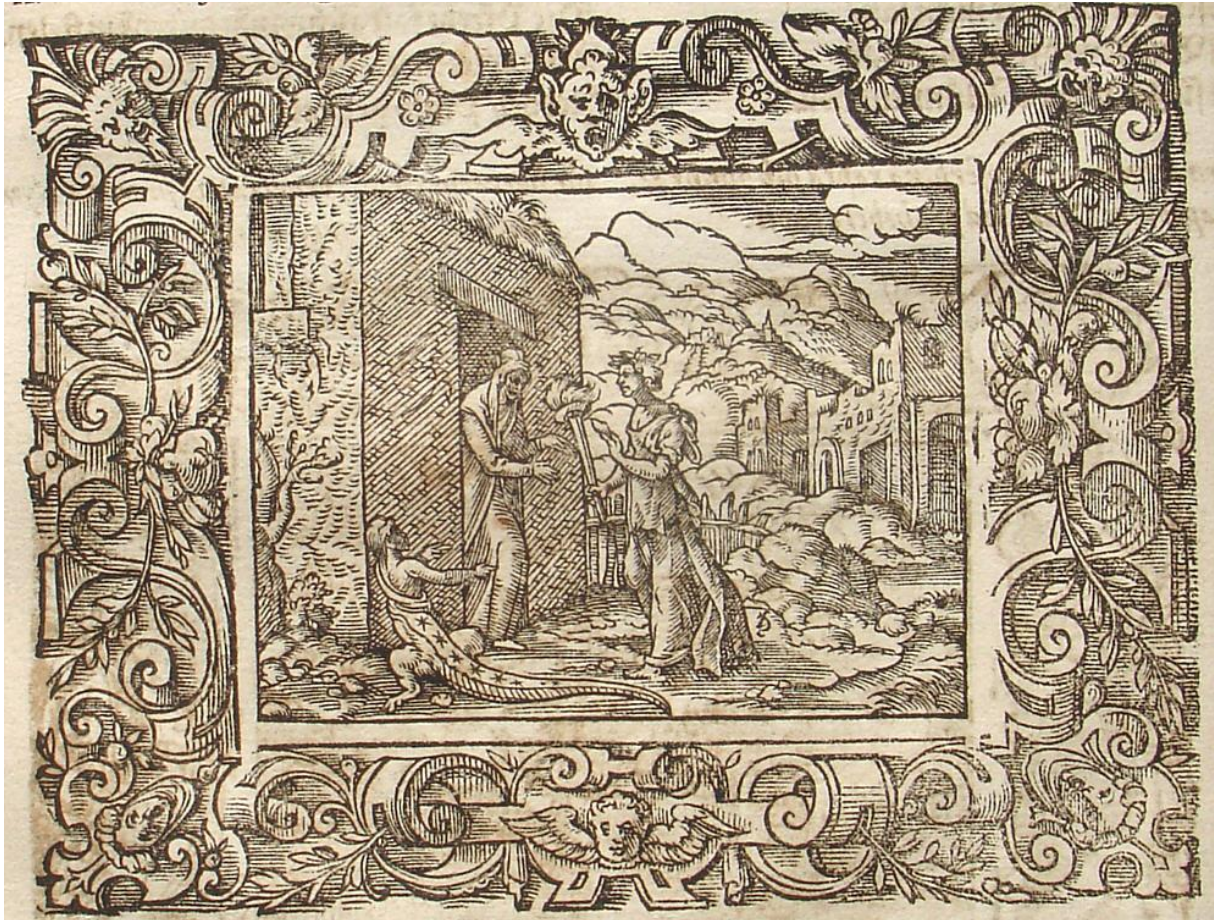
SLIKA 24. Virgil Solis, Cupid strijelom gađa Plutona , drvorez, iz: P. OVIDII METAMORPHOSIS, izdavač Sigmund Feyerabendt, Frankfurt, 1581.

odnos sugerira da je božica tek prišla starici, dok je dječak u donjem lijevom kutu već napola preobražen. Izgleda da Solis ponovno koristi simultano prikazivanje. Iako naizgled sva tri lika izgledaju kao dio istovremene grupacije, vremenski tijek radnje nije kronološki. Solis na ovom primjeru uvjerljivo definira dubinu prostora s perspektivnim skraćenjima; od velikog kubusa kuće u prvom planu, polukružni se puteljak uvija prema dalekim brdima, kao da prenosi Cererin dugi put. Brda u daljini su izvedena jednostrukim debelim linijama te su sjenčana s desne strane pomoću kratkih paralelnih crtica.