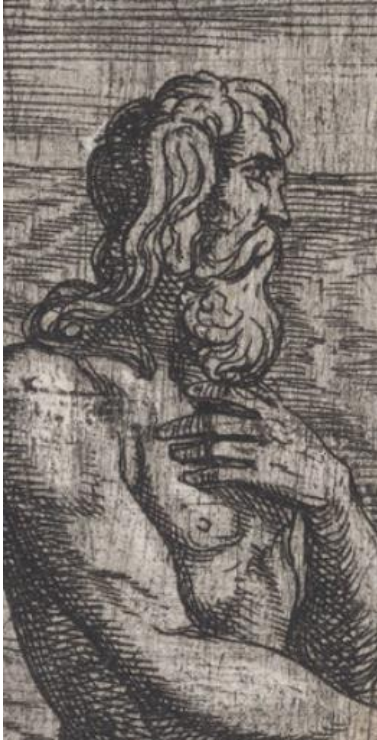
SLIKA 28. Antonio Tempesta, Glauk i Scila , bakrorez, 1606., The Metropolitan Museum of Art, detalj