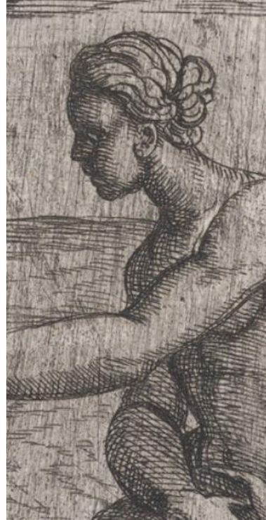
SLIKA 29. Antonio Tempesta, Glauk i Scila , bakrorez, 1606., The Metropolitan Museum of Art, detalj