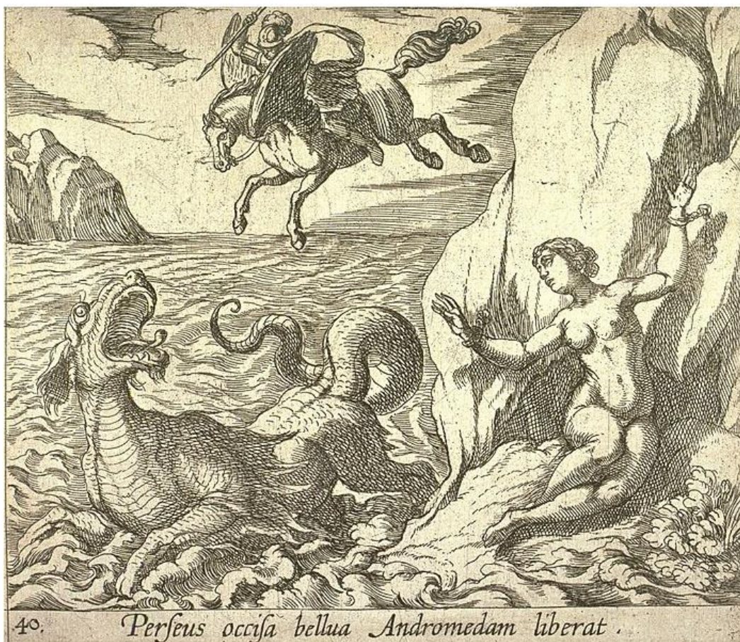
SLIKA 8. Antonio Tempesta, Perzej spašava Andromedu , 1606., bakrorez, The Metropolitan Museum of Art.