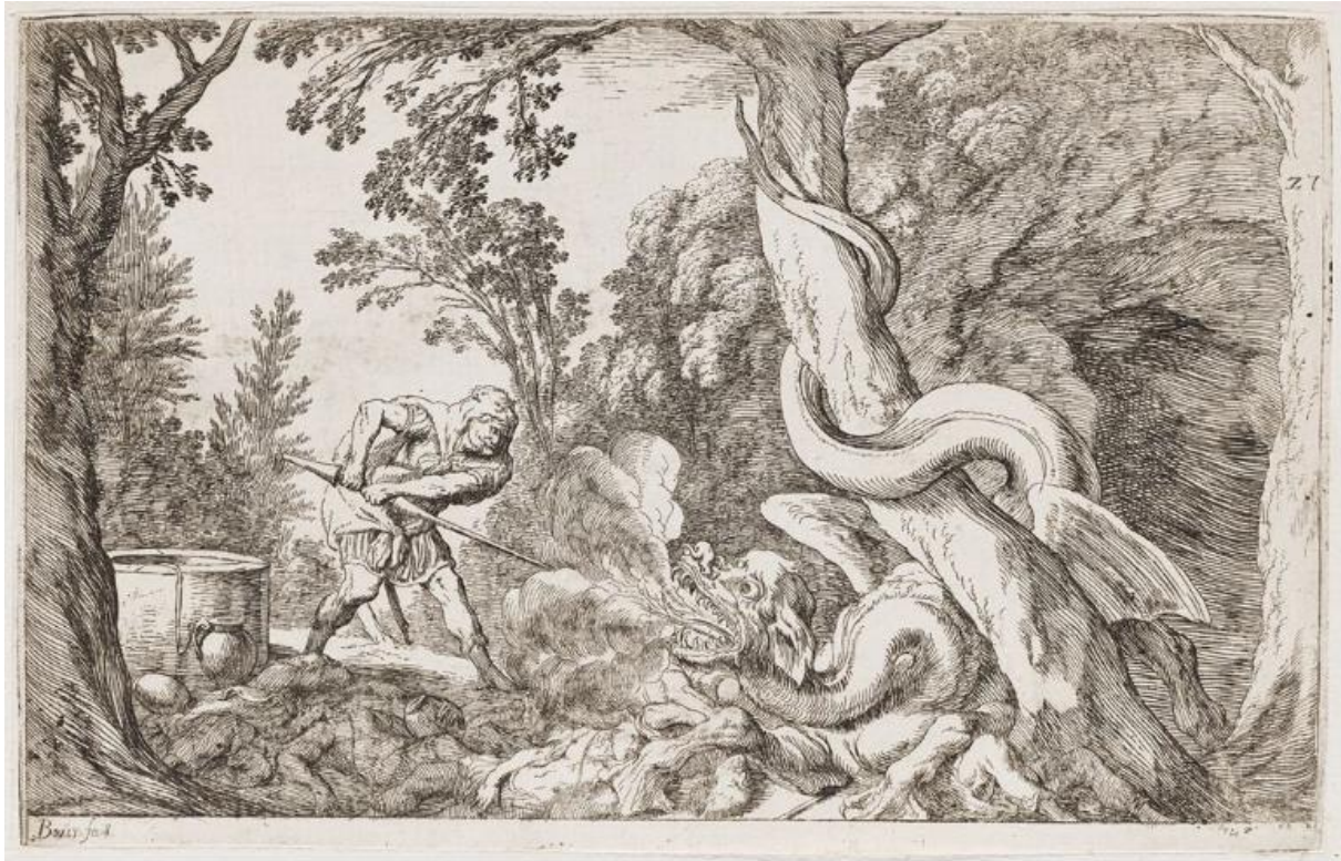
SLIKA 5. Johann Wilhelm Baur, Kadmo ubija zmaja , c. 1639.?, bakropis, Harvard Art Museums/Fogg Museum

Dok Franco, pa tako i Merian, prikazuju Kadmu koji hoda iznad tijela već ubijenog čudovišta, Baur u bakrorezu Kadmo ubija zmaja (SL. 5) prikazuje živog zmaja. Njegov se rep omotava oko stabla dok bljuje vatru prema Kadmu koji na njega nasrće kopljem.