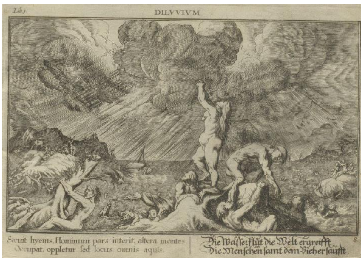
SLIKA 15. Abraham Aubry, Poplava , Sveučilišna knjižnica Erlangen-Nürnberg.