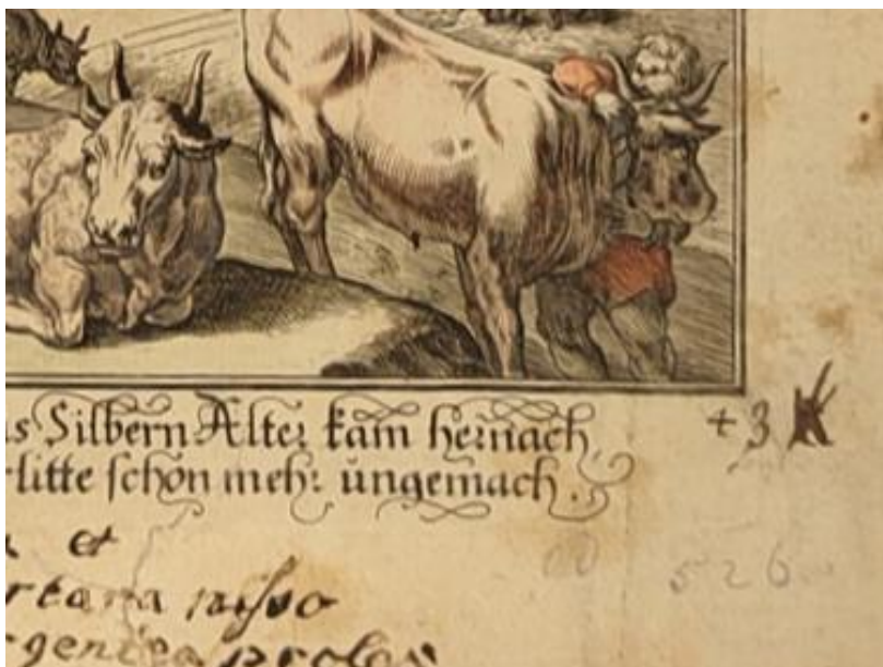
SLIKA 12. Abraham Aubry, Aetas Argentea , verzija iz Grafičke zbirke Nacionalne i sveučilišne knjižnice u Zagrebu, detalj.

Verzija iz NSK nažalost nema naslovnice, no iz prethodnih primjera se da zaključiti da prije grafika u Aubryjevom izdanju Metamorfoza uvijek idu dvije naslovnice. Tomu u prilog ide i činjenica da je prijašnji vlasnik albuma iz NSK na prvom listu u albumu pokraj brojke 4 albuma dopisao broj 3 (SL. 12), uzimajući u obzir postojanje prethodne dvije naslovne stranice.