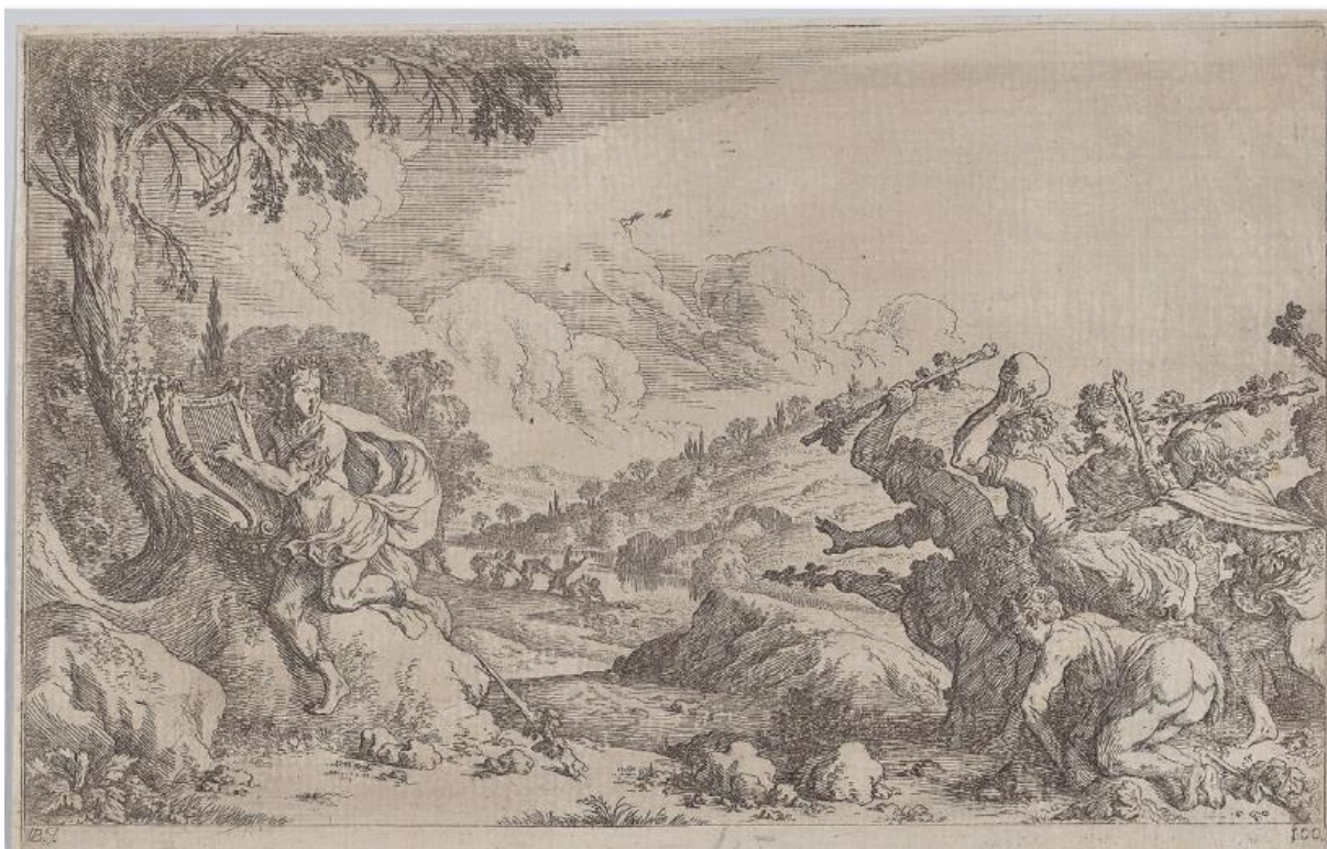
SLIKA 7. Johann Wilhelm Baur, Orfejeva smrt , 1641., bakropis, The Metropolitan Museum of Art.