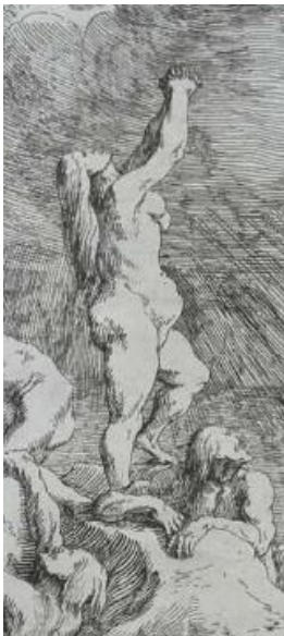
SLIKA 16. Johann Wilhelm Baur, Poplava , British Museum, detalj.

Prva razlika koja se primjećuje je ona u tonalitetu. Baurova ruka je puno lakša i slobodnija od Aubryjeve te su prijelazi između crne i bijele puno blaži. Kod Baura je za to odgovorno fokusiranje na strukturne linije, dok su to kod Aubryja konturne. Vidljivo je to na oblikovanju središnje ženske figure (SL. 16 i SL. 17.): forma njenog tijela je identična na obje grafike, no Baur koristi više paralelnih linija kojima definira njene obline te čak sjenča i zrak oko njenog trbuha, dok je Aubryjev postupak da prvo zareže oblinu koju potom sjenča te dodatno ne sjenča prostor oko njenog tijela. Njena kosa je također drugačije izvedena: dok se kod Baura radi i paralelnim vertikalnim linijama, Aubry kreira konkretne pramenove koje potom sjenča. Oblaci i nebo su uvijek posebna priča kod svakog grafičara, koliko god se radilo o reprodukciji, no Aubry čak izrazito konzistentno kopira Baura. Ipak, ne može se odreći potrebe da prvo zareže konturu koju onda sjenča, dok je to kod Baura sve fluidno izvedeno pomoću laganih poteza iglom.