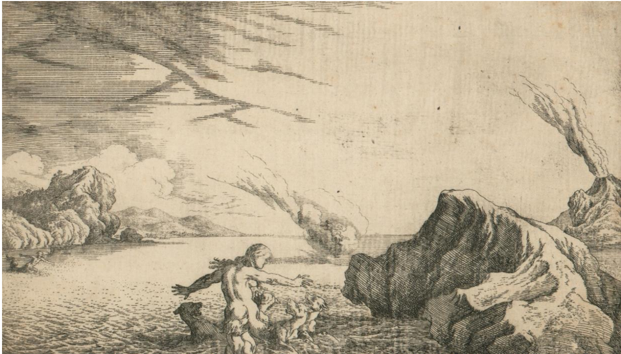
SLIKA 33. Johann Wilhelm Baur, Scilina preobrazba , bakropis, 1641.?, Grafička zbirka Nacionalne i sveučilišne knjižnice u Zagrebu

se nazire figura Kirke koja bježi s mjesta zločina nakon što je otrovala more. Uz desni rub kadra u dalekoj eruptira Etna, kao da u samoći parira Scilinoj nesreći.