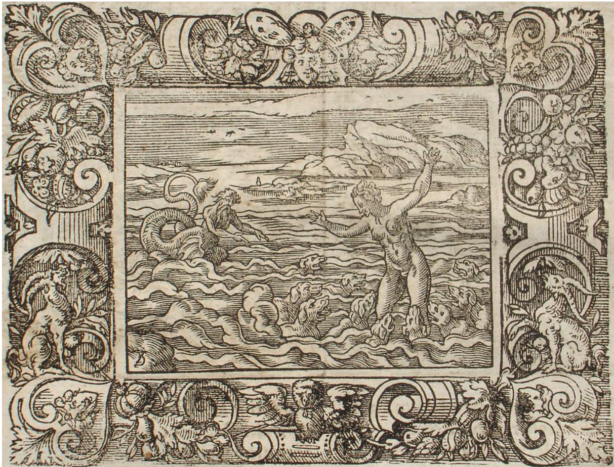
SLIKA 31. Virgil Solis, Scilina preobrazba , drvorez, iz: P. OVIDII METAMORPHOSIS, izdavač Sigmund Feyerabendt, Frankfurt, 1581.

Antonio Tempesta, Scilina preobrazba , 1606., bakropis, dimenzije 105 x 120 mm (SL. 32). Bez signature. Grafika je obrubljena jednostavnim linijskim okvirom te ispod slikovnog prikaza teče numerirani tekst u kurzivu: 131. Scylla Circes veneficijs in mostrum marinum kojim se objašnjava da je Kirka odgovorna za Scilinu pretvorbu u morsko čudovište. Tempesta koristi isti ikonografski obrazac kao Solis, gdje je Scila prikazana do koljena u moru sa psima koji joj se približavaju te Glaukom u pozadini koji pliva prema njoj. Scila je kod Tempeste prikazana poprilično mirna, u usporedbi sa Solisovom Scilom. Psi oko njenih nogu uzburkavaju valove i bijesno laju prema njoj, dok se ona naginje u boku i postavu rukama kao da je prihvatila svoju sudbinu. Njeno lice je mirno dok pogledava prema psima, za razliku od Glaukovog šokiranog lica u pozadini. Tempesta laganim vijugavim potezima izvodi valove oko bijesnih pasa kako bi dočarao njihove pokrete, dok je more iza njih poprilično mirno. Horizont je još viši od Solisovog, što dodatno ostavlja osjećaj mirnoće koji je zanimljivo s obzirom na užasavajuću preobrazbu.