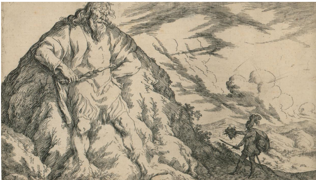
SLIKA 20. Johann Wilhelm Baur, Atlasova preobrazba u planinu , bakropis, 1641.?, Grafička zbirka Nacionalne i sveučilišne knjižnice u Zagrebu

Zanimljivo je usporediti način shvaćanja istog teksta na tri različita načina. Solis je obuhvatio najveći raspon epizode, koristeći čak simultani prikaz. Tempesta raščišćava scenu, podrazumijevajući da promatrač poznaje mitološki kontekst Atlasovog lika i podrijetla. Ipak, obojica postavljaju Perzeja na krilatog konja i Meduzinu glavu na štit, dok Baur to potpuno odbacuje. Baurov Perzej drži Meduzinu glavu u ruci, izvučenu iz torbe na leđima, kako je Ovidije i napisao. Za razlike ovih dvaju načina prikazivanja odrezane glave ne mora biti isključivi razlog nerazumijevanje teksta. Valja uzeti u obzir da je Baurov rad najkasniji te je već duboko u sredini XVII. stoljeća kad je barok u punom jeku. Barok i njegova monumentalnost, dramatičnost i dinamika nisu definirali samo naglašene duhovne prikaze kako bi se privukao vjernik, već i naturalističke prikaze životnih situacija. Krvava odrubljena glava nije šok u baroknom vokabularu, već je i tražena pojava kako bi se evocirala drama trenutka. Jedan od popularnijih primjera u prethodnim stoljećima je Juditino odrubljivanje Holofernove glave gdje je glava postavljena čista na pladanj gdje se kao barokni kontrast pojavljuje brutalno odrubljivanje kod, na primjer Artemisie Gentileschi. Upravo se tu uviđaju posljedice Baurovog putovanja u Napulj i Rim.