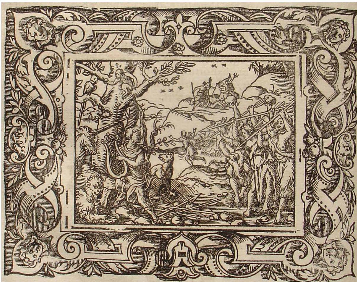
SLIKA 6. Virgil Solis, Orfejeva smrt , drvorez, iz: P. OVIDII METAMORPHOSIS, izdavač Sigmund Feyerabendt, Frankfurt, 1581.

Baurova scena Orfejeve smrti u bakropisu (SL. 7), zbog većih dimenzija i dinamičnije tehnike, smještena je u rahliji šumski prostor, gdje Orfej bježi od žena koje trče za njime. Ipak, radi se o identičnom Solomonovom kompozicijskom predlošku do kojeg je Baur došao preko reprodukcije Virgila Solisa. Jedan je ovo od mnogih primjera različitih ovidijanskih motiva, no s istim ikonografskim predloškom, zbog čega se uvijek iznova dokazuje koliko su Metamorfoze bogat izvor za razvoj osobnog umjetničkog izraza.