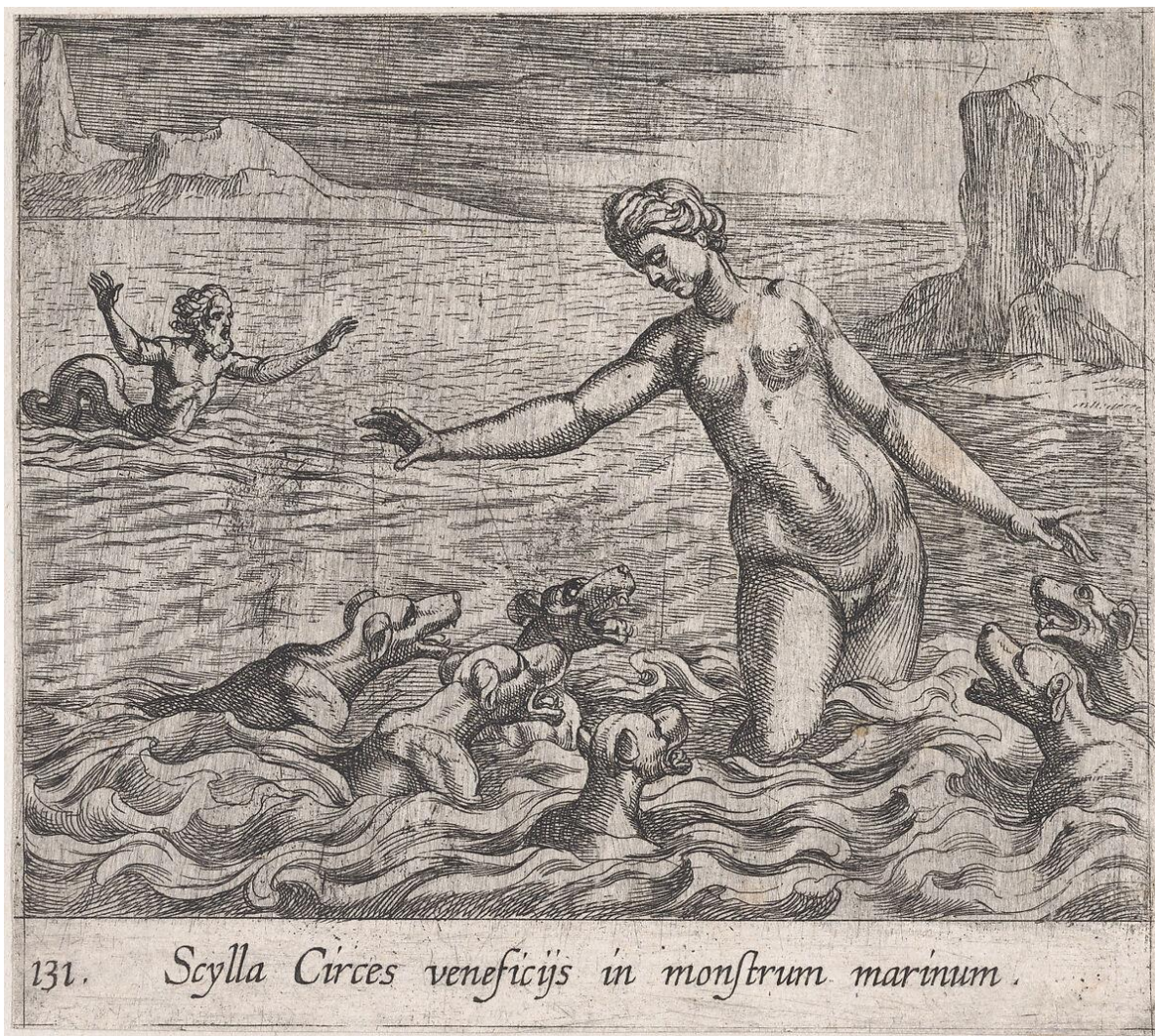
SLIKA 32. Antonio Tempesta, Scilina preobrazba , bakrorez, 1606.

Johann Wilhelm Baur, Scilina preobrazba , 1641.(?), bakropis, dimenzije 125 x 204 mm (SL. 33). Grafika je isto orijentirana kao grafika u albumu Abrahama Aubryja. Bakropis je bez okvira te je rezan do slike. Baur u potpunosti ne slijedi ikonografsku formulu Solisa i Tempeste; njegova Scila je naizgled sama u borbi s psima. Događaj je postavljen u monumentalni morski krajolik, niskog horizonta s velikim gromadama kamena kao na prethodnoj sceni Glauk i Scila . Scila je prikazana leđima okrenuta od promatrača dok se bjesomučno okreće oko vlastite osi dok joj psi proizlaze iz bedara koja su otrovana morem. U prikazanom trenutku su njena bedra već rastopljena u tijela pasa te su prikazana spojena s pasjim leđima. Taj doista grozomoran trenutak preobrazbe dodatno je naglašen Scilinom samoćom prvog plana unutar tog monumentalnog morskog pejzaža. S lijeve strane u pozadini je Glauk prikazan izuzetno malen, čime se naglašava njegova udaljenost od zastrašujućeg događaja. U daljini iza Scile, iz oblaka