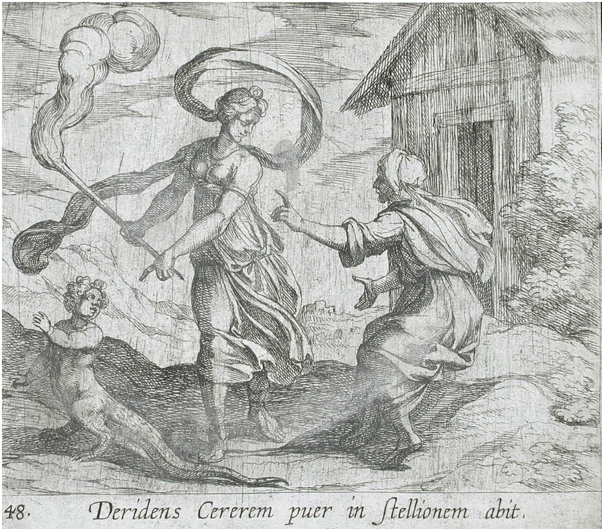
SLIKA 25. Antonio Tempesta, Cerera i uvrjedljivi dječak , bakrorez, 1606., The Metropolitan Museum of Art.

pretvorbe. Njihov međusobni pogled nabijen je prepirkom oko nastale situacije, dok dječak samo bespomoćno gleda prema starici. Cererino tijelo nije toliko naglašeno elongirano kao što je slučaj kod Tempestine Venere i prethodnog primjera, no ipak je na Cererinom tijelu vidljiva elongacija vrata. Njen zalet prema dječaku nije samo evidentan po vatri i dimu baklje u njenoj ruci, već i dugačkom velu koji se s njene glave vijori u elipsastoj putanji oko nje prema dječaku na lijevo. Ponovno se primjećuje Tempestin lagani rukopis u izvedbi grmlja pored drvene kuće, kao i gustom, dinamičnom šrafiranju sjene tla na kojem akteri stoje.