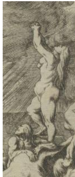
SLIKA 17. Abraham Aubry, Poplava , Sveučilišna knjižnica Erlangen-Nürnberg, detalj.

Moguće je da su Aubryjeve Metamorfoze doista vjerodostojna reprodukcija Baura te da je njegova razina grafičke mogućnosti izrazito visoka te bliska Baurovoj. Njegova osobna tendencija ipak je prema većim kontrastima zbog postizanja dojma dramatičnosti scena koje prikazuje. Naposljetku, Baurov kasniji pristup grafici polazi od određenih slikarskih utjecaja iz