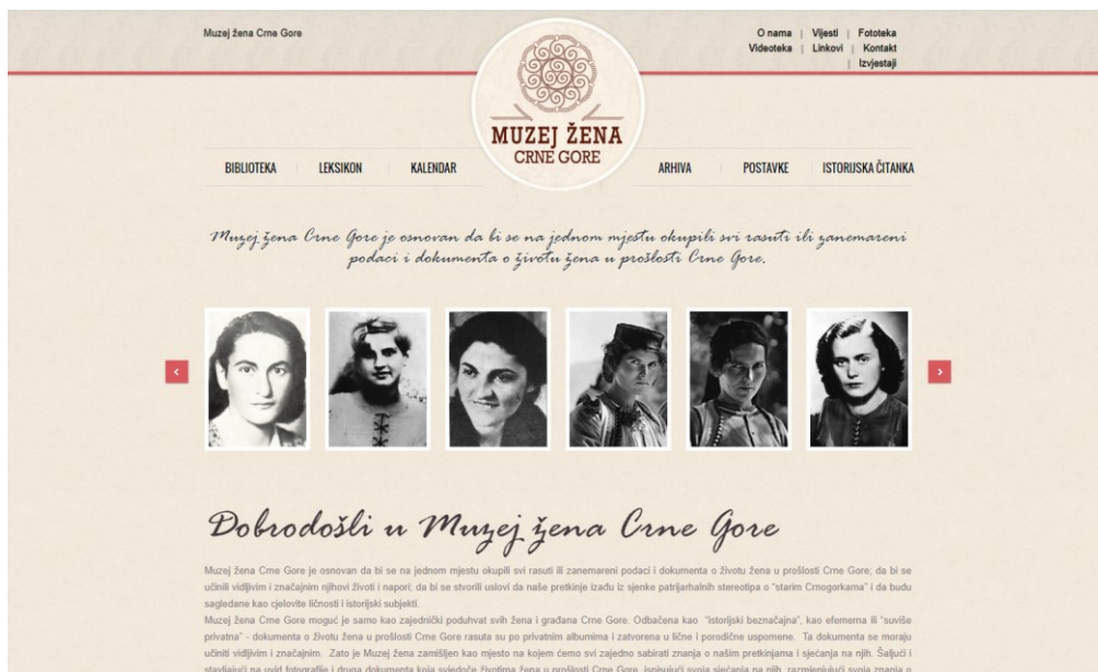
Slika 3. Muzej žena Crne Gore – internetska stranica ( www.muzejzena.me/ , 2023)

Također su aktivni i na svojoj Facebook stranici gdje objavljuju pozive za radove, događanja.