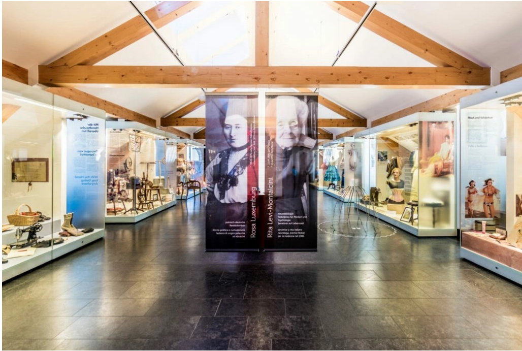
Slika 4. Frauenmuseum u Meranu