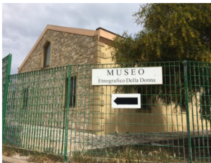
Slika 7. Museo Della Donna di Pauli Arbarei

Ovaj Muzej žena se nalazi u gradu Pauli Arbarei na Sardiniji. Audiovizualni muzeja pomažu ispričati povijesti sela te predmetima koji su pomogli pružati veselje i mir ovom mjestu. Moguće je i vidjeti majke kako se igraju sa svojom djecom, žene kako u svojim kućama tkanu, žene s kosama u poljima, modu tih žena, plesove, pobožne žene, žene kao čuvarice dobrih vrijednosti (Municipality of Pauli Arbarei, 2016). Po muzeju se mogu naći i fotografije toga vremena. Kasnije se mogu vidjeti i izloženi fizički predmeti, a kako bi se posjetitelji još više uživjeli u svijet prošlosti dopušteno ih je i dirati. Iako je po mnogim pogledima tradicionalni muzej što se tiče načina izloga postava, uz pomoć stolova na kojima se nalaze filmovi i fotografije koje posjetitelji mogu dodirnuti, iskustvo se pretvara u multimedijско. Muzej žena u Pauli Arbareiju uz stalni postav nudi i privremene izložbe (Municipality of Pauli Arbarei, 2016).