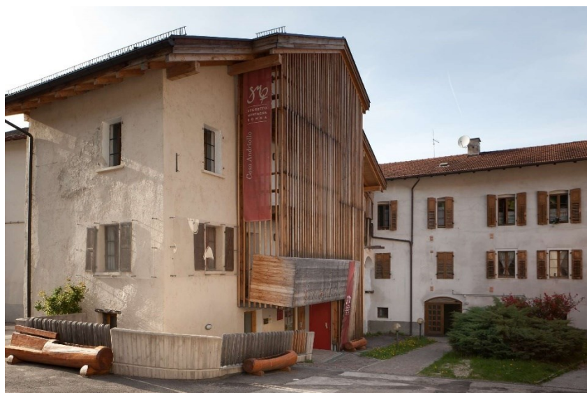
Slika 6. Muzej Casa Andriollo ( www.facebook.com/CasaAndriollo , 2023)

Lako je zanemariti i podcjenjivati one osnovne i potrebne poslove po kući, iako ih je nužno obavljati njima se ne daje nikakva vrijednost, čak ih se smatra inferiornima (Bean et al, 2016). Ti poslovi su se obavljali u tišini tj. anonimnosti, u samoći, a sada ih ovaj muzej slavi. Tako su po sobama kuće izloženi dokumenti i artefakti te razni predmeti koji pokazuju kreativnost tih žena (Tretino, 2017). Tako se mnoge stvari mogu smatrati vrlo običnima na što ne bismo inače obraćali previše pažnje i pridavali previše važnosti, kao što su na primjer posteljine i tkanine, kuhinjski pribor, predmeti za religijske obrede, itd. (Museo Diffuso Valsugana Orientale, 2017). Ovaj etnografski muzej sastoji se od šest soba, a osnovala ga je Rosanna Cavallini, slikarica i grafička dizajnerica. Još je 2003. godine krenula s projektom Soggetto Montagna Donna gdje bi posvetila muzejski prostor planinskim ženama. Zatim se 2007. godine taj projekt ostvario otvaranjem Muzeja Casa Andriollo koji daje svoj prostor „ženskom znanju” (Rosanna Cavallini, 2020). Iako nemaju svoju vlastitu službenu stranicu, imaju dio o sebi na internetskoj stranici Museo Valsugana Diffuso Orientale koja je mreža muzeja koja spaja razne etnografske muzeje tog planinskog područja. Instagram profil @casa_andriollo i Facebook stranicu Scopri il Museo Casa Andriollo koriste kako bi mogli pokazati širokoj publici razne detalje predivnog postava ovog muzeja.