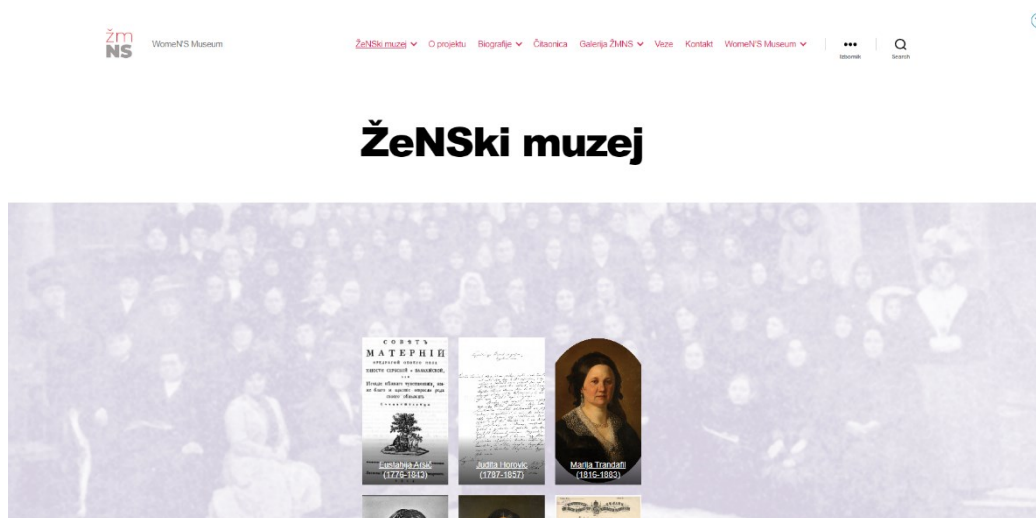
Slika 2. ŽeNSki muzej – internetska stranica ( www.zenskimuzejns.org.rs/ , 2023)

U Novom Sadu je osnovan njihov prvi muzej žena u Srbiji i to u digitalnom obliku. U ŽeNSkom muzeju smatraju da se kroz povijest politički i kulturni utjecaj i značaj žena ignorirao. Njihovi životi nisu označeni i njihovi doprinosi nisu uvaženi ni kroz diskurse, obrazovne programe, muzejske kolekcije, a nisu ni vidljive u svakodnevnom životu, kao što su nazivi ulica, trgova, škola, institucija, nagrada, itd. (ŽeNSki muzej, 2019). ŽeNSki muzej omogućava korisnicima digitaliziranu građu koja im približava živote i rad žena kroz povijest Novog Sada. Građa im uključuje fotografije, dokumente, tekstove, umjetničke radove, artefakte, rukotvorine, albume, plakate, a imaju i sekundarnu građu teorijskih i kritičkih tekstova, te imaju istraživačke projekte i teorijske tekstove koji povijesno i kulturološki kontekstualiziraju muzej (ŽeNSki muzej, 2019). No, ŽeNSki muzej se ne bavi samo poviješću, već rade i na tome da predstave i afirmiraju suvremeno žensko stvaralaštvo (ŽeNSki muzej, 2019).