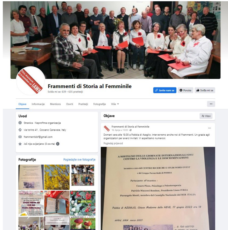
Slika 10. Facebook stranica inicijative Frammenti di Storia al Femminile ( www.facebook.com , 2023)

ženском državljanstvu“ (With Roots We Can Fly – fragments of history for a new idea of women’s citizenship). Knjiga skuplja iskustva 42 žene koja govore o proteklom stoljeću i kako su se žene prilagođavale promjenama koje su se velikim brzinama događale (IAWM, 2017).