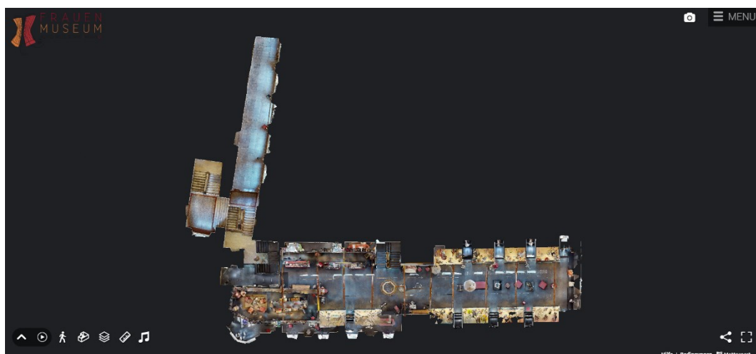
Slika 5. tlocrt 3D virtualnog prikaza Frauenmuseuma u Meranu ( https://www.museia.it/ , 2023)

Frauenmuseum Meran uz fizičke posjete nudi korisnicima i 3D virtualnu šetnju muzejom. U „šetnji” je moguće vidjeti i „hodati” kroz prostor muzeja, približavati se raznim kutcima s predmetima i otvarati prozore s informacijama odnosno legendama dostupnim na njemačkom, talijanskom i engleskom jeziku. Uz samostalno korisnikovo istraživanje muzeja, virtualni muzej nudi video šetnje koji prolazi kroz izložbeni prostor, kao i highlighte odnosno istaknute trenutke. Zatim postoji opcija za pregled s mogućnosti rotacije u izoliranom prostoru kako bi se pomoću 3D modela predočio izgled i prostor muzeja. Dostupan je i tlocrt svih tri katova muzeja, pojedinačno i skupno, kao i mogućnost mjerenja soba i predmeta. Ponuđena je i popratna ambijentalna muzika (Frauenmuseum Meran, 2020).