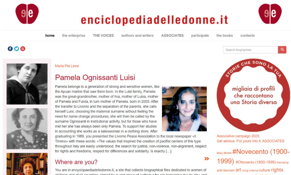
Slika 9. Museo delle Donne di Milano – internetska stranica ( www.enciclopediadelledonne.it/ , 2023)

Enciklopedija postoji samo u online obliku čime nisu ograničeni prostorom i mjestom. Inicijativa radi s i involvira mlade ljude pošto ova stranica i postoji za nove generacije. Naime, potiču učenice, a i učenike osnovnih i srednjih škola da sudjeluju u operativnim dijelovima Enciklopedije, odnosno da i oni unose zapise svojih glasova (Enciclopedia delle Donna, 2010).