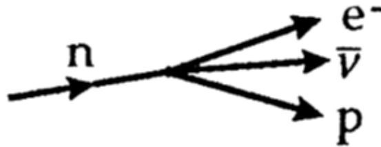
Slika 1. Raspad neutrona na elektron e^- , antineutrino \bar{\nu} i proton p.

Ta energija je raspoređena između neutrina i elektrona. Prema današnjim eksperimentima masa mirovanja neutrina je manja od 20 eV, je različita od nule. No zbog jednostavnosti i lakšeg razumijevanja aproksimiramo je nulom. Beta raspadom neutron se raspada u proton, uz zračenje elektrona i antineutrina, što je grafički prikazano na Slici 1. [1].