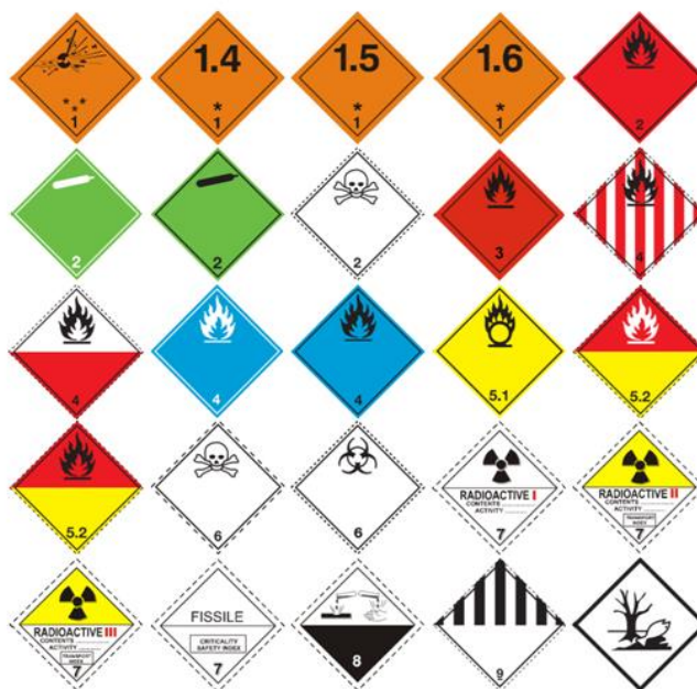
Slika 9. Listice opasnosti