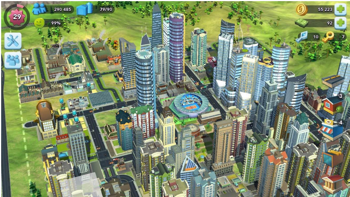
Slika 6. Prikaz slike iz igre SimCity

Dobar primjer može biti popularna igra SimCity. Igru je izvorno dizajnirao Will Wright, a radi se o videoigri u kojoj se gradi grad. Dakle, igrač u igri razvija grad iz puste površine. Sam kontrolira gdje smjestiti svoje razvojne zone, infrastrukturu poput bolnice, škola, cesta, elektrana itd. Igrač također određuje poreznu stopu, proračun, te socijalnu politiku. A taj grad naseljavaju simulirane osobe koje je stvorio sam igrač. Igra nema posebnih uvjeta da bi se pobijedilo u igri nego ravnoteža spomenutih čimbenika pruža ograničenja koja omogućavaju igranje. (Walker, 2006)