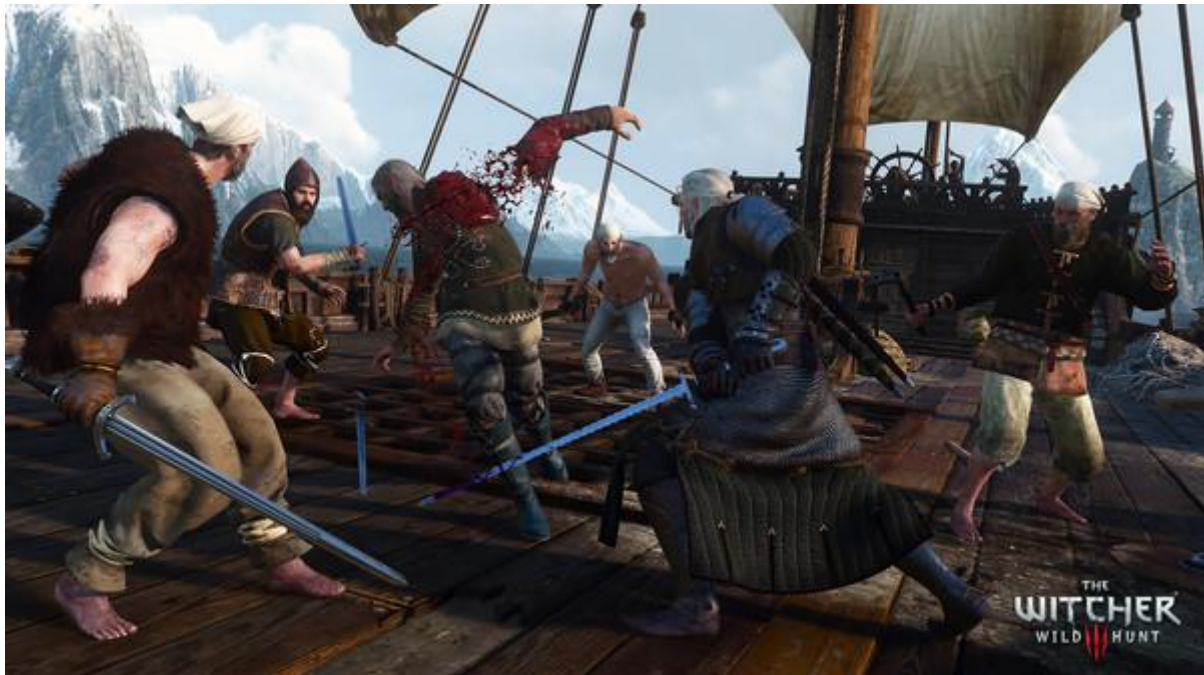
Slika 5. Prikaz slike iz igre The Witcher 3: Wild Hunt

To je RPG otvorenog svijeta temeljen na pričama, priča je postavljena u vizualno zapanjujući fantastični svemir pun značajnih izbora i utjecajnih posljedica. U igri igrate kao profesionalni lovac na čudovišta Geralt iz Rivia, koji ima zadatak pronaći dijete proročanstva u tom golemom otvorenom svijetu bogatom trgovačkim gradovima, gusarskim otocima, opasnim planinskim prijevojima i zaboravljenim pećinama. Lik u igrici je od ranog djetinjstva mutiran kako bi stekao nadljudske vještine, snagu i reflekse, a vještice su protuteža svijetu čudovišnog svijeta. (Steam, n.d.)