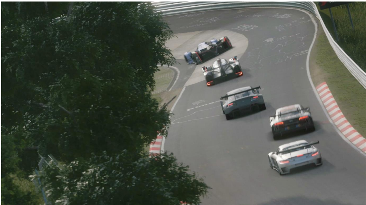
Slika 9. Primjer igre Gran Turismo

Kao primjer igre utrka navest ćemo jedan od popularnih serijala igre Gran Turismo. Zadnja verzija ili zadnji serijal ove igre je Gran Turismo Sport koji je orijentiran na online igranje. U ovome serijalu igrači se natječu u prvenstvima, te mogu predstavljati svoju zemlju u Kupu nacija i voziti za najdražeg proizvođača automobila. U igri su vozila napravljena i rekonstruirana do najsitnijeg detalja, te to igraču daje poseban doživljaj igrajući ovu igru. (Sony, n.d.)