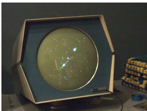
Slika 1. Spacewar u muzeju računalne povijesti.

Za prvu računalnu igru smatra se Spacewar! koju je osmislio Steve Russell sa svojim timom 1962. godine. Tom timu na čelu sa Russell-om je trebalo oko 200 sati da napišu prvu verziju Spacewar-a. Napisana je na PDP-1, ranom interaktivnom mini računalu DEC, a on je koristio ekran s katodnom cijevi i unos tipkovnice. Ovu su igru mogli igrati dva igrača, tako što je svaki od igrača imao pod kontrolom svoj svemirski brod koji su ispaljivali rakete. Bodovi su se skupljali na način da se rakete ispaljuju na protivnika, te se moralo odupirati gravitaciji sunca. (Bellis, 2019)