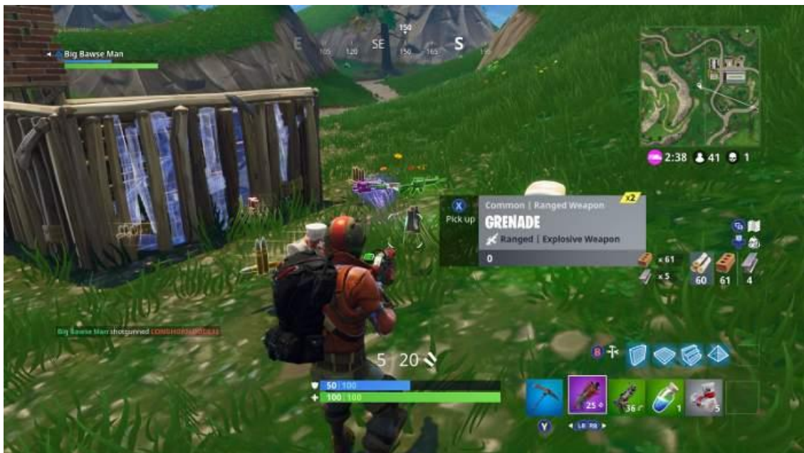
Slika 12. Prikaz igre Fortnite

možete skupljati materijale poput drva, metala ili cigle, a to ćete dobiti tako da srušite drvo, auto ili npr. kuću. Ti materijali služe za samostalnu gradnju, a možete napraviti pod, zidove ili krov koji će vas zaštititi ako neko puca na vas. Što više takvog materijala jedan igrač ima ima veće šanse da ostane zadnji i pobijedi, a naravno za takav pothvat i trijumf igrač mora biti dobro uvježban jer uskladit pucati i graditi je jako teško, te treba dosta igranja i vježbe da sr to uskladi. (PCChip, 2018)