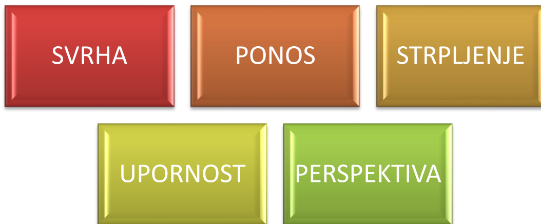
Slika 2. Pet moći etike za pojedinca

Etičko ponašanje počiva na tzv. „pet moći etike za pojedinca“ , a isto je prikazano Slikom 2.