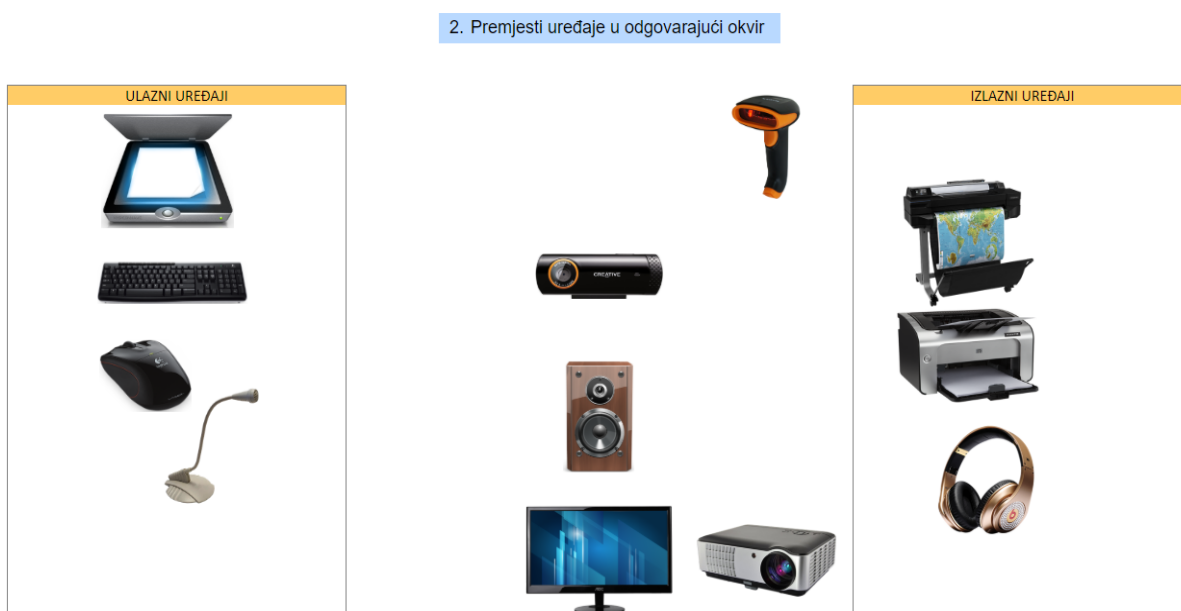
Slika 4. Ulazni i izlazni dijelovi računala – interaktivna igra za učenike [16]

Velika prednost gore navedenih i prikazanih kvizova kao i ostalih nastavnih materijala na mrežnim stranicama je da učenicima na interaktivan i zanimljiv način učenicima pomogne u savladavanju nastavnog gradiva te da ih čim bolje pripremi na provjere znanja u školi.